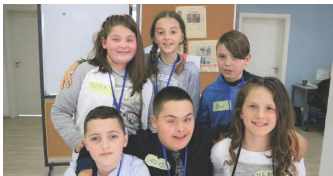
A po dukemi si yje? Vlerësojeni vetë këtë gjë!

tyre. Qytetarët aktiv nuk harrojnë të paguajnë taksat e shtetit, ata hapin edhe OJQ nëse kanë ndonjë ide të mirë dhe të rëndësishme për vendin e tyre. Qytetarët aktiv hapin edhe qendra mjekësore, por nuk e harrojnë arsimin, pasi që ata hapin edhe qendra edukative për të mirën e fëmijëve, arsimimin dhe edukimin e tyre. Qytetarët aktiv marrin pjesë në tubime publike dhe në zgjedhje, vetëm për të mirën e përgjithshme të shtetit. Ata i zbatojnë elementet e demokracisë si: bara-