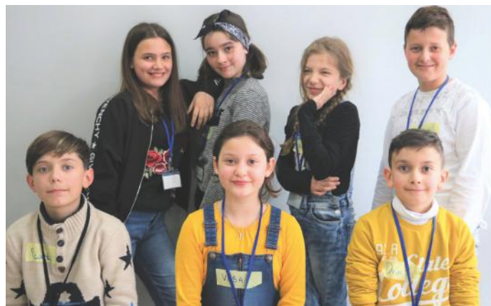
Ne, gazetarët e këtij artikulli

Për të kuptuar më shumë se ku ka lindur demokracia, dhe si ka qenë atëherë e si është sot, ne ju ftojmë të lexoni faqen tjetër. Nuk do të zhgënjeheni nga informatat tona.