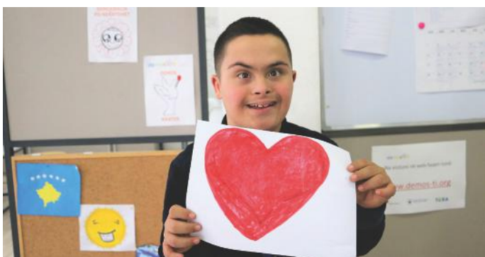
Kjo është zemra e madhe e qytetarëve aktiv

Edhe pse jemi të vegjël, ne mundohemi të jemi aktiv. Kemi shumë raste kur: iu kemi ndihmuar të varfërve, kemi pastruar ambiente të ndryshme, iu kemi ndihmuar të moshuarve, kur kanë pasur nevojë, si dhe kemi organizuar programe të ndryshme shkollore. Të gjitha këto i kemi bërë nga vullneti ynë dhe nga dëshira për të qenë sa më produktiv në komunitetin tonë. Ne si qytetarë duhet të jemi gjithmonë aktiv dhe kjo është porosia nga ne, grupi „Yjet“. Mos harroni se qytetarët aktiv kanë duar të arta!