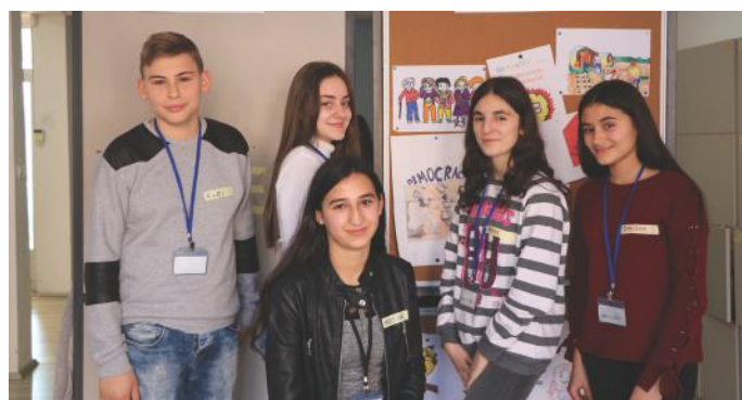
Deputetët e ardhshëm të Kuvendit