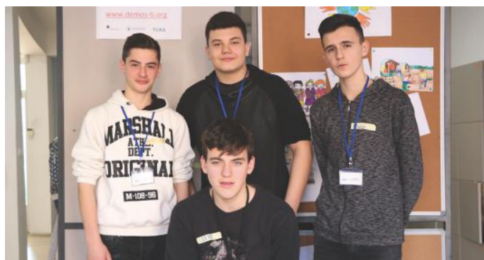
Gazetarët e këtij artikulli dhe...

Gjatë muajit të kaluar është miratuar ligji nga Kuvendi i Kosovës për fuqizimin e masave parandaluese në lidhje me rregullat e komunikacionit. Kjo do të thotë se nga tani, kush shkel ligjin, do të dënohet më rreptësisht se më parë. Faleminderit për leximin dhe vëmendjen tuaj.