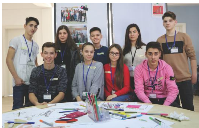
Përfaqësuesit e ardhshëm të demokracisë

Kjo ishte e tëra për sa i përket artikullit tonë për demokracinë. Edhe pse për të shkruajtur për këtë temë neve nuk na mjafton vetëm një artikull. Andaj, ne zgjedhëm që në pika të shkurtëra t'ua shpjegojmë në mënyrën tonë se si ne e shohim demokracinë.