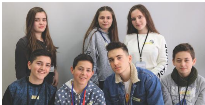
Gazetarët të cilët shkruan këtë artikull

Këto parti politike, edhe pse nuk paraqesin shumicën, marrin pjesë në Kuvend me numër të caktuar të anëtarëve të tyre. Funkcioni kryesor i partive politike opozitare është kritika e programit dhe mendimeve të partisë politike në pushtet dhe qeverisjes së saj. Partitë mendojnë edhe për mirëqenien tonë.