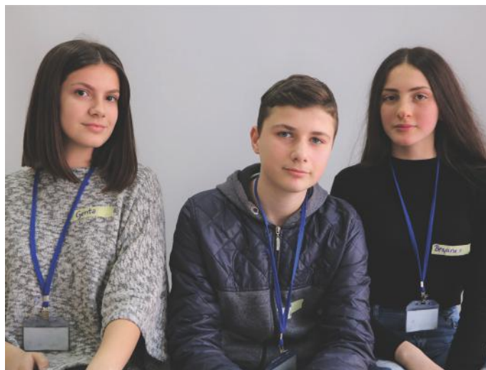
Gazetarët e këtij artikulli