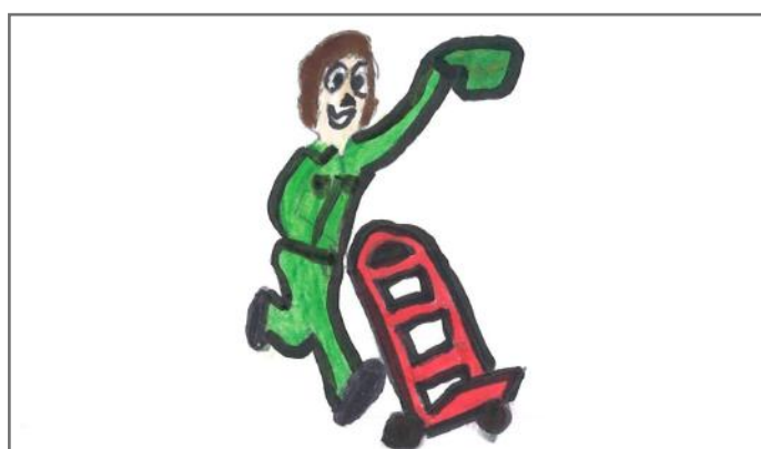
Mbi moshën 18 vjeçare e kemi të drejtën e punës