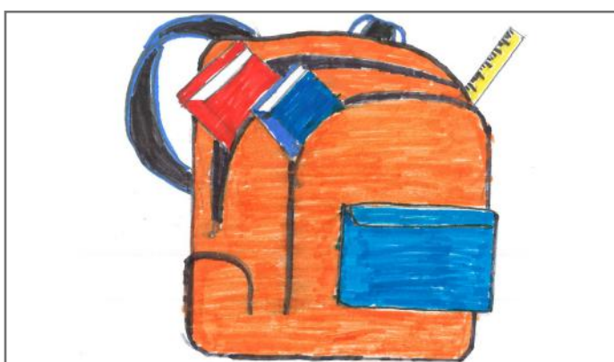
Shkolla është vendi ku ne marrim dije