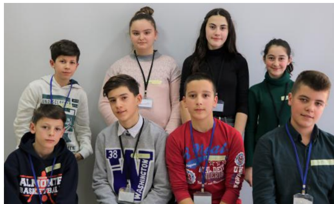
Ardhmëria e vendit

Në zgjedhjet e fundit parlamentare, babai dhe nëna ime kanë marrë pjesë në procesin zgjedhor. Ata kur erdhën në shtëpi na treguan se kësaj radhe kanë votuar për dikënd tjetër. Jo personin që e kishin votuar para 4 vjetëve. Ata më treguan se personin që e kanë votuar atë kohë nuk i ka përmbushur premtimet që i kishte dhënë. Për këtë arsye me thanë prindërit se ai person të cilin e kanë votuar, nuk e meriton votën e tyre. Pra, deputetët e marrin pushtetin prej qytetarëve. Prandaj, duhet të miratojnë vetëm ligje që janë në të mirën e tyre. Ne si qytetarë jemi shumë të rëndësishëm kur është fjala në demokraci. Andaj, të votojmë me kujdes.