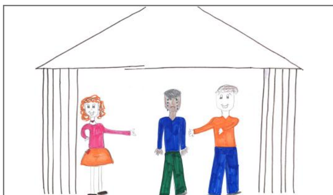
Ne duhet ta pranojmë njëri-tjetrin pa dallime