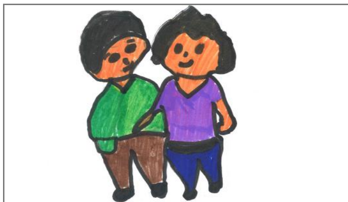
Të bashkuar shkojmë drejt së ardhmes