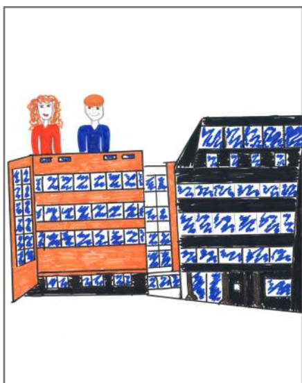
Kuvendi i Kosovës ka tri funksione kryesore: funksioni legjislativ, funksioni përfaqësues dhe funksioni kontrollues.

LUM (13), ALTINA (13), EMA (12), RINESA (13), ERLAND (13), RODON (13), BLIN (13), EDEN (11)