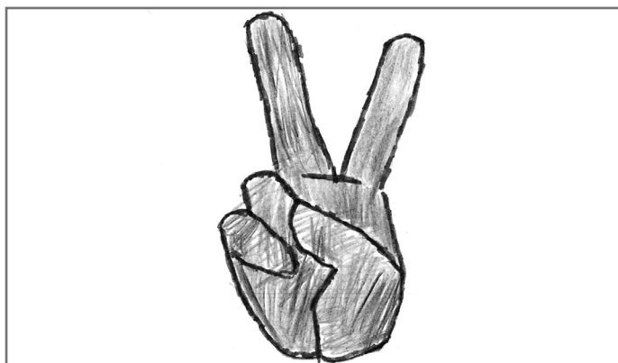
Ejani të jetojmë një jetë paqësore