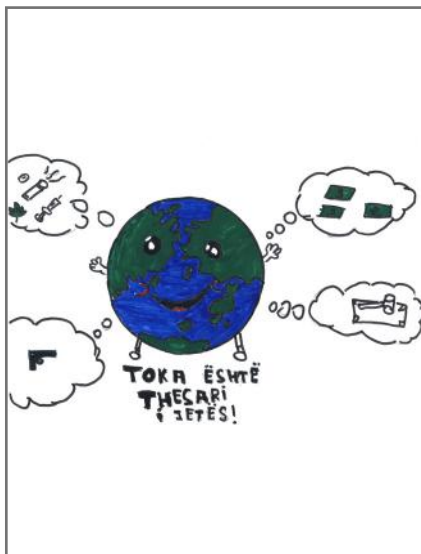
Me anë të këtyre vizatimeve dëshirojmë të tregojmë sesi qytetarët nganjëherë tregohen të papërgjegjshëm ndaj ambientit ku ata jetojnë. Për ne është shumë e rëndësishme respektimi i ligjeve.