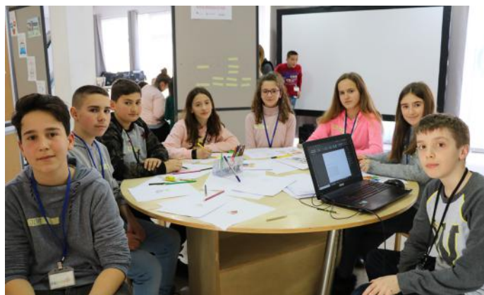
Ne sot në rolin e gazetarit

Aktiv mund të jemi edhe duke marrë pjesë në zgjedhje dhe tubime. Mund të jemi edhe duke marrë pjesë në shoqata apo organizata të ndryshme që kanë për qëllim të mbrojnë të drejtat e njeriut apo fëmijëve, etj. Ju lexues të nderuar, mos harroni se gjithçka që bëni në të mirë të vendit tonë ju bën aktiv dhe ndihmon në rritjen e demokracisë. Andaj, të jemi të gjithë aktiv. Vetëm kështu mund të arrijmë sukses. Bëhuni edhe ju si ne: punëtorë dhe shumë aktiv. Ju mund të rregulloni gjithçka që nuk iu pëlqen. Duhet vetëm vullnet.