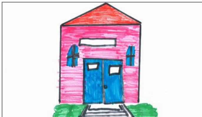
E drejta e strehimit për të gjithë qytetarët demokratik