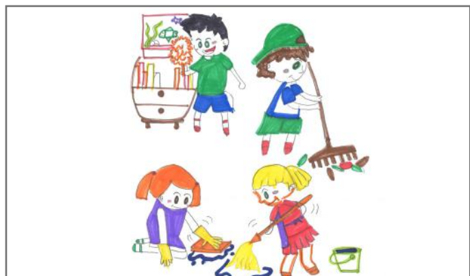
Ta mbajmë ambientin ku jetojmë sa më pastër