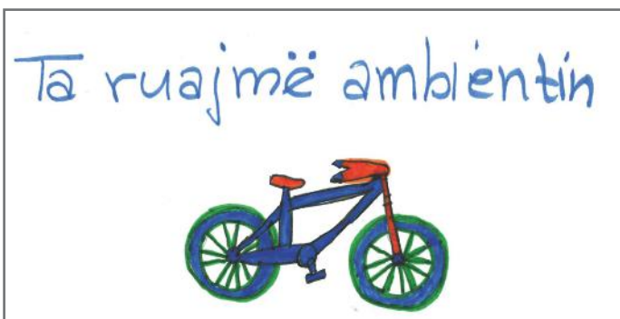
Qytetarët aktiv ruajnë ambientin e tyre

Pra, qytetaria aktive përfshin angazhimin e qytetarëve për të përmirësuar jetën në komunitet. Ajo është dëshirë e vullnet për të ndihmuar dhe bashkëpunuar me të tjerët. Pa qytetari aktive nuk mund të kemi as nivel të lartë të demokracisë. Ndër vite është dëshmuar se vetëm me kontributin e pandalur të popullit, demokracia rritet. Andaj, e kemi detyrë dhe përgjegjësi ta duam, ta ruajmë dhe ta mbrojmë shtetin tonë demokratik. Mbesim me shpresën se gjithmonë do të tregohemi aktiv dhe do t'i ftojmë të tjerët për bashkëpunim.