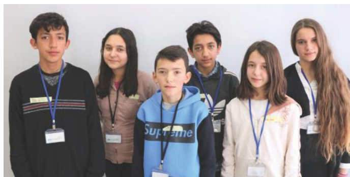
Gazetarët e shkëlqyer të „Demos-ti“

Ne e zbatojmë të drejtën e votës në shkollë. Në klasën tonë kryetarin e zgjedhim sipas votave të nxënësve. Kush merr më shumë vota, ai nxënës zgjedhet kryetar. Pas kryetarit, personi me më pak vota zgjedhet sekretar. Ndërsa, arkatari vjen i treti në radhë në bazë të numrit të votave. Ne jemi shumë të kënaqur që po e shohim demokracinë kosovare duke u zhvilluar.