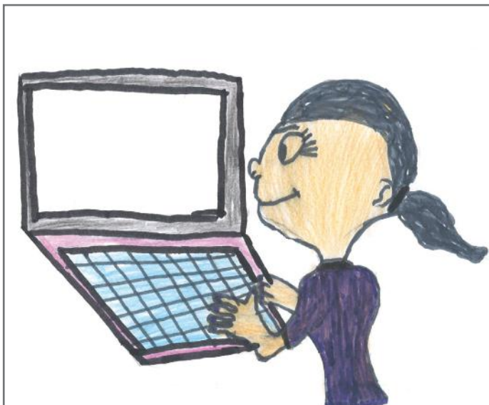
Shoqja jonë imagjinare Arta duke hulumtuar në kompjuter

Detyrë e deputetëve është që t'i përfaqësojnë qytetarët e Kosovës. Pastaj, të miratojnë apo të mos miratojnë ligje, ta zgjedhin Kryetarin e Kuvendit, Presidentin, Qeverinë, si dhe ta kontrollojnë punën që e bën Qeveria. Ne u kënaqem me rolin e të qenurit gazetarë dhe shpresojmë se ju kemi dhënë informata të mjaftueshme, që do t'iu hyjnë në punë edhe në jetën e përditshme.