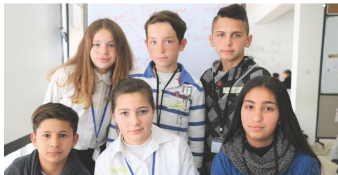
Bëhuni aktiv si ne

tit Medvec, të cilët ndjejmë përgjegjësi të madhe për t'iu ndihmuar të tjerëve. Në mesin e këtyre qytetarëve, bëjmë pjesë edhe ne nxënësit, të cilët kemi ndërmarrë iniciativa pro qytetarisë aktive. Për shembull, ne nga vullneti ynë i mirë, shumë shpesh e pastrojmë ambientin e shkollës sonë. Po ashtu, ne vazhdimisht ndihmojmë të tjerët, si p.sh. të moshuarit, të vegjëlit dhe