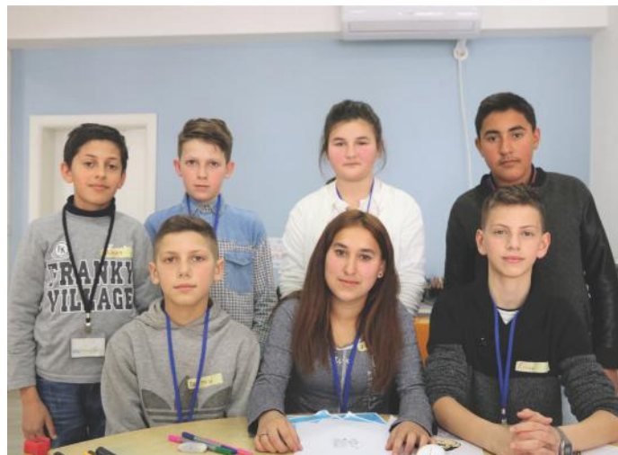
Gazetarët e Kuvendit të Kosovës

Fushata ime përfitoi shumë, si nga media elektronike, ashtu edhe nga ajo e shkruar. Ky është një shembull se si ne mund ta shfrytëzojmë internetin për gjëra të mira dhe të cilat do të sigurojnë fuqizimin e parimeve të demokracisë.