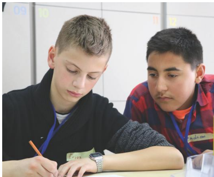
Kurse, bashkëpunimi na orienton drejt suksesit