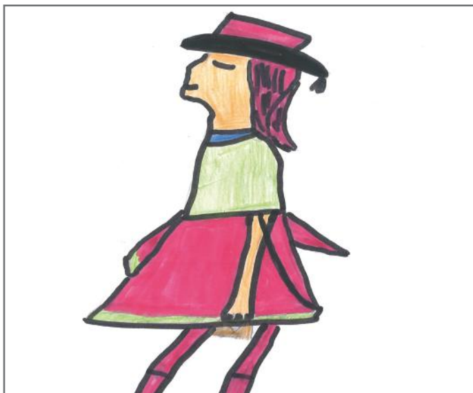
Demokracia na jep një ndjenjë qetësie në shpirtin tonë