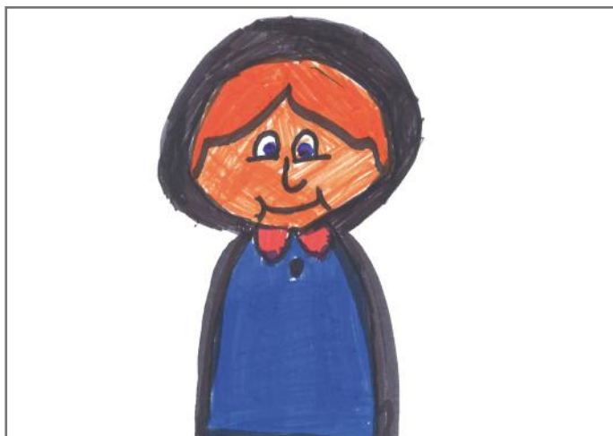
Ne gjithmonë ndihmojmë të moshuarit