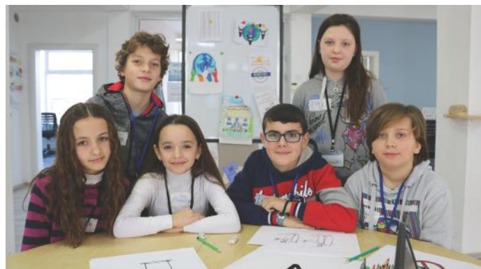
Viti 2018, në Punëtorinë „Demos-ti“ na bëri gazetarë

Ne e vlerësojmë shumë ekzistencën e ligjeve, por gjithashtu i respektojmë dhe i zbatojmë ato. Kur shkojmë në shkollë, ne e kalojmë rrugën tek vendkalimi për kombësorët dhe kjo dëshmon se ne jemi qytetarë të rregullt. Duam që të gjithë qytetarët të vetëdijësohen dhe t'i respektojnë institucionet e shtetit, gjegjësisht ligjet që dalin nga Kuvendi. Me respektim të ligjeve, Kosova do të zhvillohet shumë më shumë.