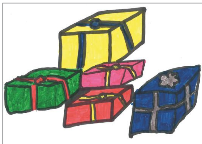
Dhurata të filla kemi përgatitur për fëmijët e tjerë