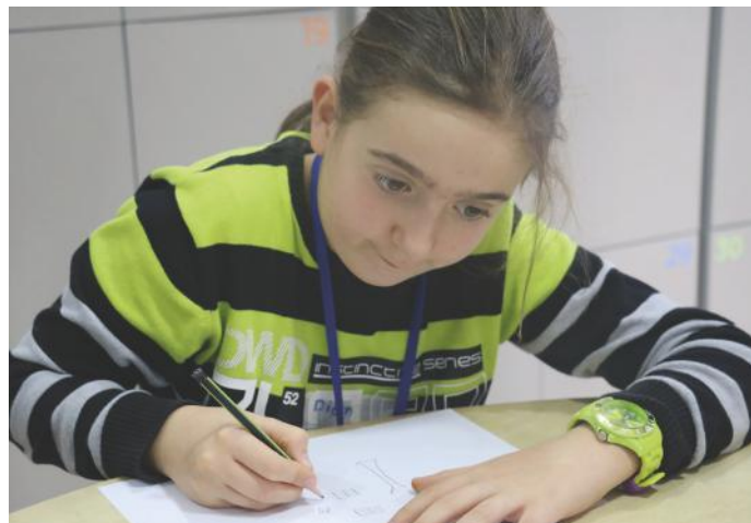
Dioni duke vizatuar për qytetarinë aktive

Jo çdo herë duhet t'i ndihmojmë vetëm vetes sonë. Neve si qenie sociale na takon dhe e kemi përgjegjësi të kujdesemi edhe për të tjerët. Duke u nisur nga ky fakt, ne kemi ndërmarrë disa iniciativa për bashkëmoshatarët tanë. Disa nga iniciativat tona i kemi paraqitur edhe në vizatimet më poshtë. Çfarë kemi bërë ne? Ne kemi mbledhur fonde për fëmijët me probleme shëndetësore, kemi mbledhur lodra për fëmijët të cilët janë jetim, si dhe kemi përgatitur dhurata për fëmijët e varfër. Nga këto veprimtari, ne jemi frymëzuar edhe më shumë që gjithmonë të jemi aktiv. Kështu sigurohet e ardhme e mirë dhe e sigurt për të gjithë. Andaj, me shumë kënaqësi iu ftojmë që të na ndihmoni të promovojmë së bashku sa më shumë qytetarinë aktive.