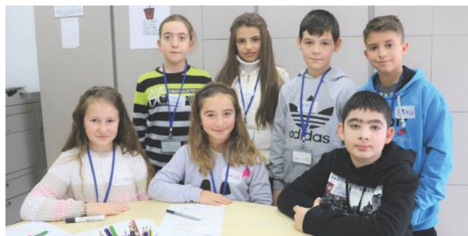
Ne jemi demokratët e vegjël të Kosovës

toleranca, respekti, etj. Që nga shfaqja e demokracisë e deri më tash ka pasur zhvillim të vazhdueshëm të këtyre elementeve. Këtë zhvillim të elementeve të demokracisë e ka bërë vetë populli, përmes punës së tij të pandalshme. Kur themi se populli ka ndikuar në zhvillimin e demokracisë nënkuptojmë qytetarët të cilët janë treguar dhe vazhdojnë të tregohen aktiv. Pa aktivizim të qytetarëve, demokracia si koncept nuk mund të zhvillohet. Andaj, përgjegjësia na takon neve për ta ruajtur dhe për ta mbajtur atë ashtu siç na ka hije. Demokracia ka arritur edhe në shtetin tonë Kosovën në vitin 2008. Që nga ky vit, shihet se ka gjithmonë tendencë që të punohet në ngritjen e nivelit të saj. Kjo vërehet edhe nga vetë interesimi ynë për të mësuar që nga kjo moshë për vlerën dhe rëndësinë e demokracisë. Do të mundohemi gjithnjë të shpërndajmë sa më shumë informata lidhur me të, në mënyrë që të formojmë një shoqëri edhe më demokratike.