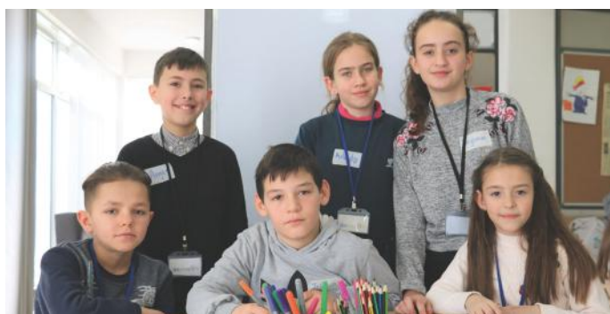
Fytyrat dhe mendjet e përkushtuara të gazetarëve

Pasi që jetojmë në demokraci, vendosëm të votojmë. Loja që mori vota më shumë ishte loja delfin. Kështu të gjithë së bashku u argëtuam duke luajtur këtë lojë. Këta pra, janë vetëm disa shembuj se si ne, edhe pse nuk jemi akoma të rritur, mund të votojmë. Kurse, në zgjedhjet e para që do të mbahen pasi të arrijmë moshën 18 vjeçare, ne premtojmë se do të votojmë!