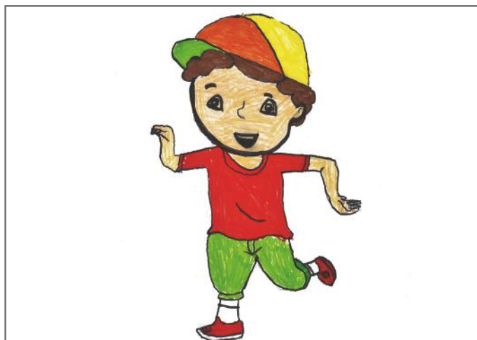
Jam i lumtur që jam aktiv