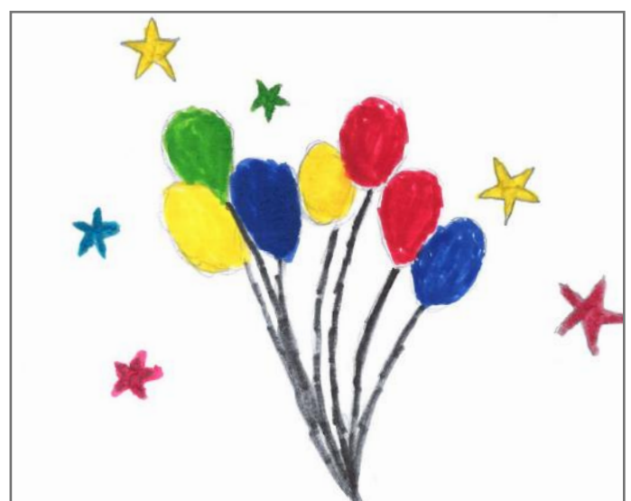
Demokracia është një botë e bukur me ngjyra dhe plot mrekulli