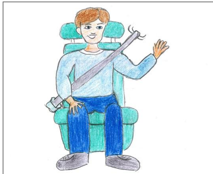
Arti i respekton ligjet. Gjatë vozitjes së veturës, ai vë rripin e sigurimit