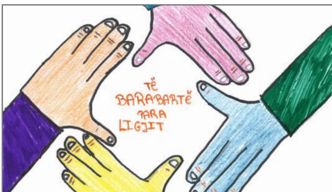
Jemi një, jemi të barabartë

Vendimet për këto ligje merren në Kuvend, si institucioni më i lartë legjislativ në vendin tonë. Në Kuvend punojnë deputetët, të cilët propozojnë ligje që duhet të jenë në të mirën tonë. Ky institucion i rëndësishëm ka tri funksione kryesore: funksionin legjislativ, atë përfaqësues dhe funksionin kontrollues. Përmes këtyre funksioneve, Kuvendi miraton ose nuk miraton ligjet, përfaqëson popullin dhe kontrollon punën e Qeverisë. Në Kuvendin e Kosovës punojnë gjithsej 120 deputetë, prej të cilëve 100 janë të kombit shqiptar, ndërsa 20 prej tyre janë të komuniteteve jo shumicë. 10 nga ta janë serbë dhe 10 të tjerë janë turq, boshnjakë, romë, egjiptianë, ashkalinjë dhe goranë. Deputetët, të cilët punojnë në Kuvend zgjedhen me votat e popullit. Pra, vullneti i popullit është themeli i demokracisë.