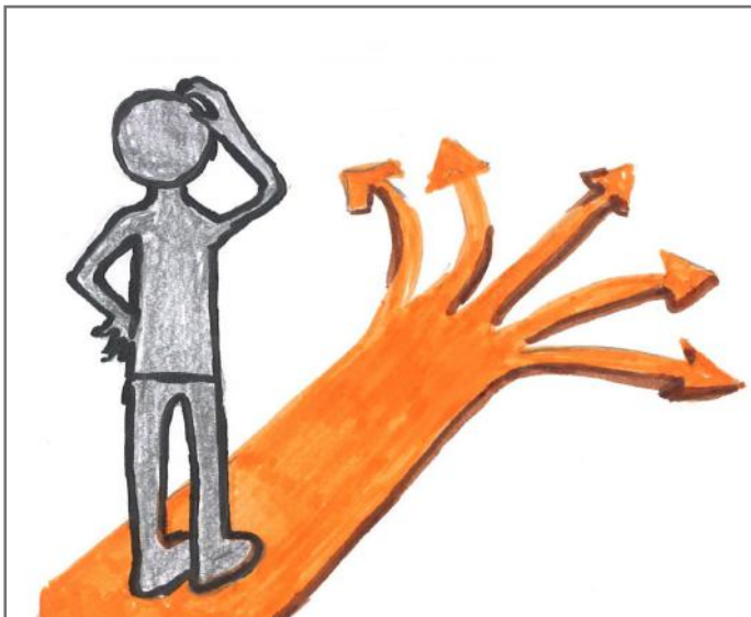
Vendimi na takon neve, prandaj të mendohe mi mirë para se të veprojmë diçka