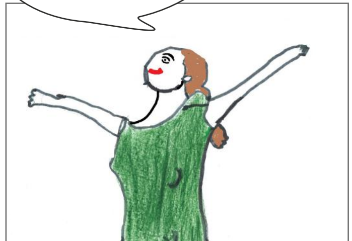
Jam e lirë të shpreh mendimet e mia

Menduat se artikulli ynë përfundoi? Jo kaq shpejt. Qytetarë të dashur të cilët lexuat këtë artikull, ne nxënësit e grupit tonë iu falenderojmë. Megjithatë, ne kërkojmë nga ju që të punoni për të rritur demokracinë. E paraqitëm demokracinë si një shtëpi të madhe, që na pranon të gjithëve. Në këtë mënyrë menduam se do ta kuptoni rëndësinë që ka ajo në jetën tonë. Por, shpresojmë se keni kuptuar gjithashtu rëndësinë që ne kemi në demokraci. Ja edhe një fakt tjetër për demokracinë. Demokracia ka dy forma. Në demokracinë e drejtpërdrejtë qytetarët marrin vendimet direkt. Kurse, në demokracinë përfaqësuese qytetarët i zgjedhin përfaqësuesit e vet me anë të votave. Mirëupafshim lexues.