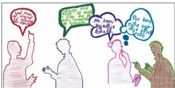
Qytetarët duke bashkëbiseduar për zgjedhjet

Në këto dy vizatime kemi paraqitur zgjedhjet qendrore dhe lokale. Parimisht, këto zgjedhje janë të njëjta sepse qytetarët dalin dhe votojnë për përfaqësuesit e tyre. Për këtë i kemi paraqitur si të njëjta. Ndryshimi mes tyre është se në zgjedhjet qendrore qytetarët i zgjedhin deputetët, ndërsa në zgjedhjet lokale ata votojnë për asamblistët dhe kryetarin e komunës