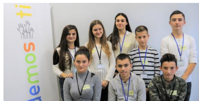
Ne e shkruajtëm këtë artikull me shumë dashuri për ju