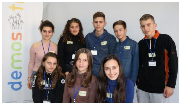
Bashkohuni me ne