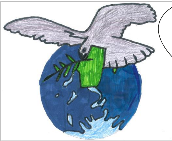
Jetojmë në paqe dhe liri

Akoma nuk kemi përfunduar artikullin tonë. Në këtë pjesë të artikullit do të tregojmë më shumë fakte rreth demokracisë. Mësojeni cilat janë dy llojet e demokracisë