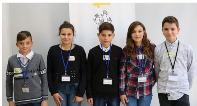
Shokët të cilët bashkëpunuan sot për këtë artikull