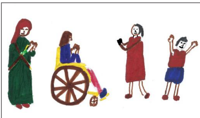
Shoku ynë Mendimi, ka paraqitur qytetarët e fshatit tonë

Ne nxënësit e klasëve të VII-të, të premtën e fundit të muajit mblidhemi dhe pastrojmë të gjitha klasat e shkollës sonë. Ndërsa, nxënësit e klasëve të VIII-të mblidhen të hënën e parë të muajit. Ky është një proces që ne e bëjmë me shumë kënaqësi, sepse shkolla është shtëpia jonë e dytë. Aty marrim dije dhe trajtohemi në mënyrë të barabartë.