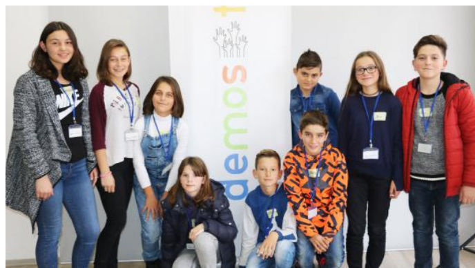
Fryma e re e gazetarëve demokratikë ndihet ngado që shkojmë

Pra, me gjithë këtë çka ne kemi shkruar në këtë artikull, ne dëshirojmë të themi se votat tona ndikojnë më së shumti tek shteti ynë, prandaj duhet të kemi kujdes se kë e zgjedhim.