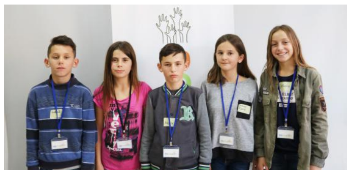
Autorët e kësaj pune të mrekullueshme

vetëm ky institucion në Kosovë. Kuvendi ka edhe një detyrë tjetër. Ajo është kontrollimi i punës që e bën Qeveria. Këtë e bënë duke i bërë pyetje ministrave. Në këtë pjesë të artikullit, dëshirojmë të shkruajmë për ligjet. Ligjet janë rregulla që duhet të zbatohen nga të gjithë ne. Disa prej tyre janë: ligji i komunikacionit, ai i shkollimit, ai për pirjen e duhanit, ai i mbeturinave, etj. Për më shumë, ne do të flasim për ligjin e mbeturinave. Ne si nxënës duhet të respektojmë ligjin e mbeturinave në mënyrë që t'i hedhim mbeturinat në vende të caktuar e jo t'i lëmë ato vend e pa vend. Një ditë prej ditësh, ne pamë disa fëmijë të cilët po hedhnin mbeturina në rrugë. Ne ndaluan dhe filluam t'i u tregonim që ata duhet të kenë kujdes, t'i hedhin mbeturinat në vende të caktuar e ta mbrojnë mjedisin që të gjithë të kemi një ambient të pastër. Biseda jonë përfundoi, kur ata u bindën se nuk kishin vepruar edhe aq mirë. Falenderojmë Kuvendin që na ka sjellur ligje të reja të mirë. Me respektimin e ligjeve dashuria dhe harmonia mes njëri-tjetrit rritet. Kështu rritet edhe demokracia!