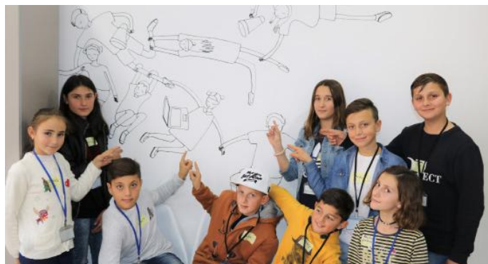
Aktiv mund të jemi në forma të ndryshme. E se si nxënësit e moshës tonë mund të jenë aktiv, shikoni vizatimet e shokëve dhe shoqeve të mia

Çka është edukimi qytetar dhe cila është rëndësia e tij? Me këtë pyetje të parashtruar nga edukatorja jonë, ne filluam diskutimin për qytetarinë aktive. Edukimi qytetar është përgatitja e individëve për të marrë pjesë si qytetarë aktiv në demokraci. Qytetaria aktive në një mënyrë apo në tjetrën, iu referohet marrëdhënieve në mes qytetarëve, si dhe marrëdhënieve në mes qytetarëve dhe personave të cilët udhëheqin vendin. Janë qytetarët aktiv, ata të cilët i zgjedhin përfaqësuesit, por edhe kërkojnë llogari prej tyre. Pra, qytetarët aktiv, nuk janë aktiv vetëm në një periudhë të vitit, por ata janë aktiv gjatë gjithë jetës së tyre.