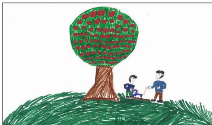
Floari ka paraqitur gjelbërim dhe qytetarët aktiv të fshatit