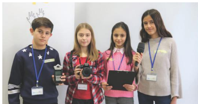
Ne jemi gazetarët e së ardhmes

Sot, njerëzit anembanë botës, për shkak të zhvillimit të teknologjisë janë bërë shokë me njëri-tjetrin. Kjo mundësohet vetëm në një vend ku ka demokraci.