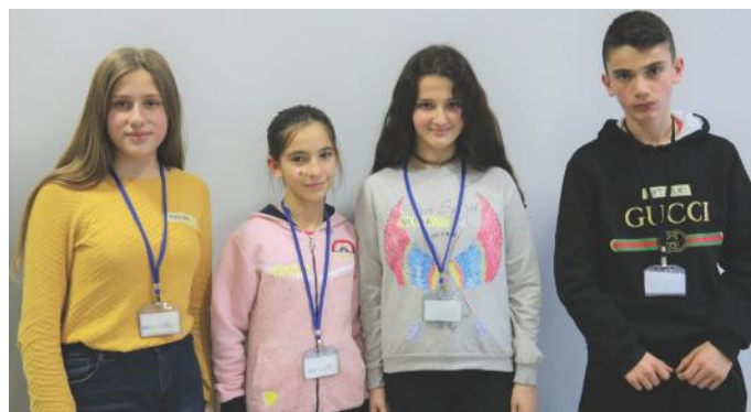
Ne trajtohem i të barabartë me ju