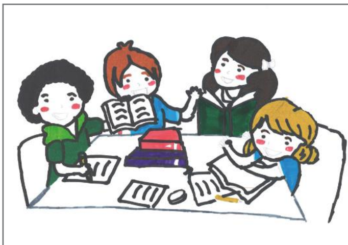
Këtu kemi paraqitur disa qytetarë aktiv. Së pari ata mendojnë se çka ka nevojë të përmirësohet në vendin e tyre

Gjatë kohës sa ishim duke bërë mbledhjen e mbeturinave, hasnim në qytetarë të ndryshëm. Ata u gëzuan shumë që ne po kujdesemi për ambientin, por njëri nga shokët tanë iu drejtua: „Ne po e pastrojmë sot, por që të jetë fshati i pastër çdo ditë, duhet të kujdeseni edhe ju, të gjithë së bashku“. Ata na premtuan që do të kenë më shumë kujdes. Pastaj, ne vazhduam punën me më shumë vullnet e entuziazëm. Puna jonë pati ndikim pozitiv.