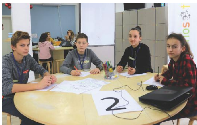
Autorët demokratikë të këtij artikulli

në demokraci. Kjo është arsyeja pse të gjithë ne pa dallime, kemi të drejtë të shkojmë në shkollë, të mjekohemi, të marrim patentë shoferin, etj. Në të kaluarën ka qenë më e rrallë që gratë të vozisnin veturën. Mirëpo, sot, ky dallim nuk ekziston. Kjo falë ligjeve që i kemi dhe falë Kuvendit. Funksion tjetër i Kuvendit është funksioni përfaqësues. 120 deputetët të cilët e ushtrojnë këtë funksion janë përfaqësues dhe zëri i popullit në Kuvend. Andaj, themi se Kuvendi ka funksion përfaqësues. Si dhe funksioni i tretë është funksioni kontrollues. Kuvendi kontrollon Qeverinë nëse ky institucion është duke i zbatuar ligjet. Roli i tij është shumë i madh për të gjithë ne. Sot e kuptuam këtë gjë, ngase më herët nuk e kemi menduar rëndësinë e tij për ne. Shpresojmë që e kuptuat edhe ju, përmes këtij artikulli të shkruar nga ne.