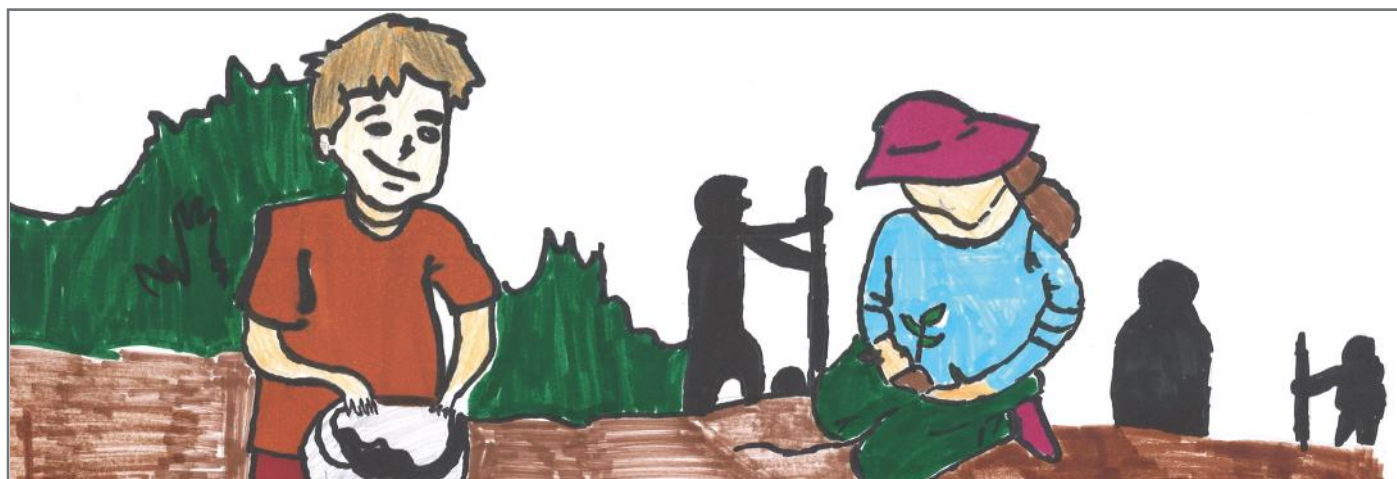
Pasi diskutuan, qytetarët morën një vendim që do të ndaheshin në grupe për të pastruar ambientin e tyre