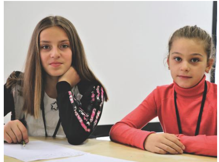
Punojmë dhe veprojmë së bashku, sepse të bashkuar mund ta ndriçojmë vendin ku jetojmë, por ndoshta edhe gjithë botën