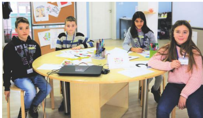
Gazetarët e Kuvendit

demokracinë. Mësuam se cili është roli ynë në demokraci dhe kuptuam se ne jemi ata, të cilët udhëheqim në demokraci. Këtë e bëjmë duke votuar. E pikërisht, procesi zgjedhor është tema që ka pasur grupi ynë. Në vizatimin tonë pak më lart, kemi paraqitur një qytetar, i cili ka zgjedhur profesionin e tij të preferuar. Mirëpo, zgjedhje të tilla bëjmë çdo ditë. Për shembull, edhe ne si klasë kemi votuar dhe kemi zgjedhur vendin ku dëshirojmë të shkojmë bashkë me