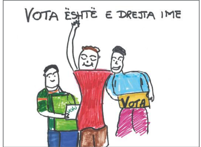
Vota e secilit ka peshë të madhe. Kjo e drejtë duhet të shfrytëzohet, sepse me votë mund të sjellim ndryshimin