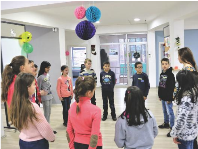
Respekti për veten dhe të tjerët është element bazë i demokracisë. Prandaj, bëhuni edhe ju si ne, respektoni njëri-tjetrin