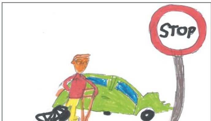
Kur ne e shohim shenjën „STOP“ ne duhet të ndalemi

Besojmë se kemi dhënë mjaft arsye për të na kuptuar pse e theksuam aq shumë rëndësinë e ligjeve. Shpresojmë shumë që përmes këtij artikulli, edhe ju ta kuptoni ndjeshëm më shumë rëndësinë e ligjeve.