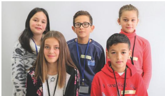
Ne jemi qytetarë, të cilët i respektojmë ligjet