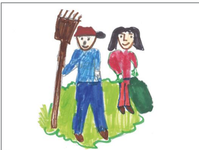
Qytetarë aktiv janë të gjithë ata, të cilët kontribuojnë në vendin e tyre. Ne fëmijët mund të kontribuojmë duke pastruar ambientin nga mbeturinat, duke ndihmuar të moshuarit, etj.