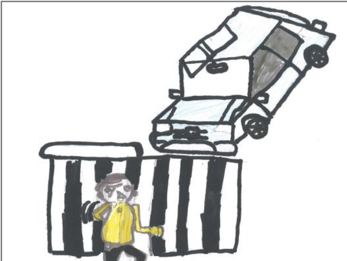
Ligjet, rregulla të cilat qytetarët e përgjegjshëm i respektojnë dhe i zbatojnë