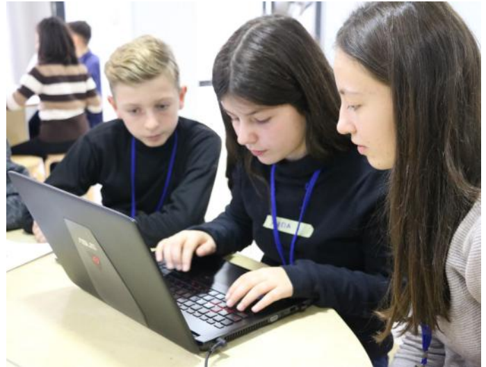
Shkruajmë dhe mësojmë për Kuvendin

Falë demokracisë ne përfirojmë shumë. Andaj, jemi të lumtur për ekzistimin e këtij institucioni demokratik ligjvënës. Ky institucion përfshinë 120 deputetë, në mesin e të cilëve janë 20 nga komunitetët jo shumicë, sepse demokracia duhet të zbatohet në çdo hap dhe në çdo vend.