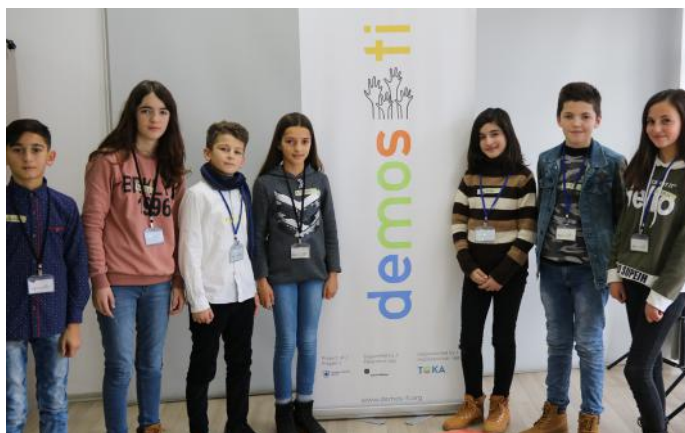
„Demos-ti“ zgjedhja më e mira që kemi bërë ndonjëherë

tu duhet të veprojmë edhe për zgjedhjet politike. Në vendin tonë zhvillohen dy lloje të zgjedhjeve: zgjedhjet lokale dhe qendrore. Në zgjedhjet lokale, qytetarët votojnë për kandidatët për kryetarë të komunës dhe asamblistët. Kandidatët për zgjedhje lokale, duhet të jenë qytetarë të regjistruar në komunën përkatëse. Nuk mundet një qytetarë i cili është i regjistruar në Klinë të kandidoj për zgjedhje lokale në Gjakovë dhe anasjelltas. Ndërsa, në zgjedhjet qendrore, qytetarët votojnë për kandidatët për deputetët të cilët miratojnë ligje në mirën e qytetarëve të Kosovës. Si në zgjedhjet qendrore ashtu edhe ato në ato lokale, qytetarët që kanë drejtë vote janë ata mbi moshën 18 vjeçare. Sipas grupit tonë, qytetarët duhen të ndihen të lirë për të votuar atë që mendojnë se do të punojë në të mirën e tyre dhe të vendit. Vota është dhe duhet të jetë e lirë.