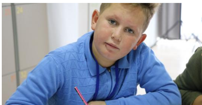
Kuvendi miraton ligje edhe për mua

Ky institucion për të cilin po flasim është Kuvendi. Kuvendi siç edhe e keni parë nga titulli i gazetës, është institucion që e përfaqëson popullin me shumë dinjitet. I tërë ky përfaqësim rrjedh nga puna e palodhshme e deputetëve që punojnë aty. Detyra themelore e deputetëve është që të na përfaqësojnë ne qytetarët-