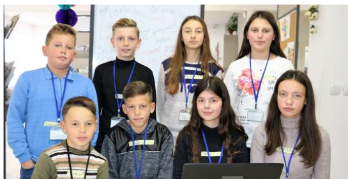
Edhe ne mund të jemi përfaqësues në të ardhmen

të përjashtuar nga çdo lloj diskriminimi që mund të ndodh brenda institucioneve shkollore. Këtu përfshihet mospërdorimi i dhunës ndaj nxënësve, mospërdorimi i shprehjeve fyese, mosbërja e dallimeve të nxënësve, etj. E tërë kjo sigurohet vetëm që të arrihet mirëqenia dhe barazia mes nxënësve. Pra, siç po e shihni të dashur lexues, Kuvendi ka rol shumë të rëndësishëm në jetën tonë, sepse falë ligjeve të miratuar aty, ne fitojmë vlerë dhe respekt si qytetarë. Prandaj, është e rëndësishme që kur populli të del në votime për zgjedhje parlamentare, të bëjë zgjedhjen e duhur për të mirën e vendit. E tërë qeverisja varet nga duart e popullit. Prandaj, ndikimi i popullit në demokraci është i patjetërsueshëm. Punën e Kuvendit e lehtësojmë ne me zbatimin e ligjeve të marra aty. Pikërisht për këtë arsye, apelojmë tek të gjithë ju qytetarë që të jeni të përgjegjshëm për veprimet tuaja. Vetëm kështu ndërtohet shteti demokratik.