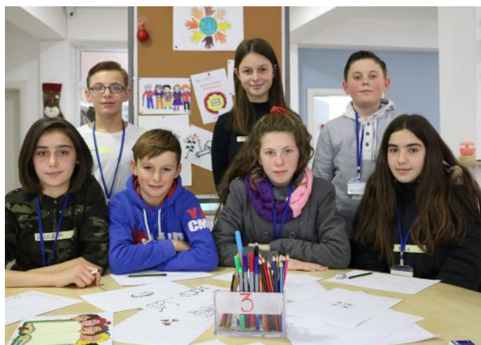
E duam dhe e mbrojmë sistemin më të mirë të qeverisjes

Ne zgjedhim deputetët dhe ata flasin në emrin tonë. E kjo formë e demokracisë quhet demokraci përfaqësuese me sistem parlamentar. Ne këtë artikull e shkruajmë për ju të dashur lexues, me qëllim që t'iu informojmë më shumë për rëndësinë e demokracisë dhe vlerat e mëdha që ka ajo.