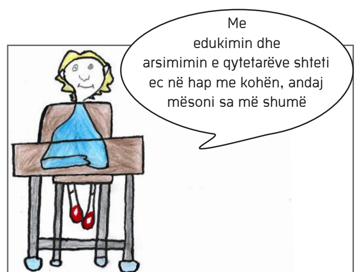
Ligji për arsimin