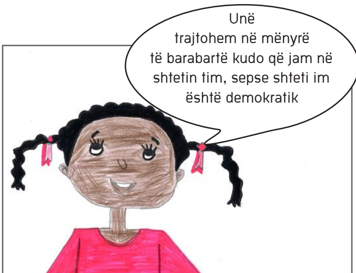
Ligji kundër diskriminimit