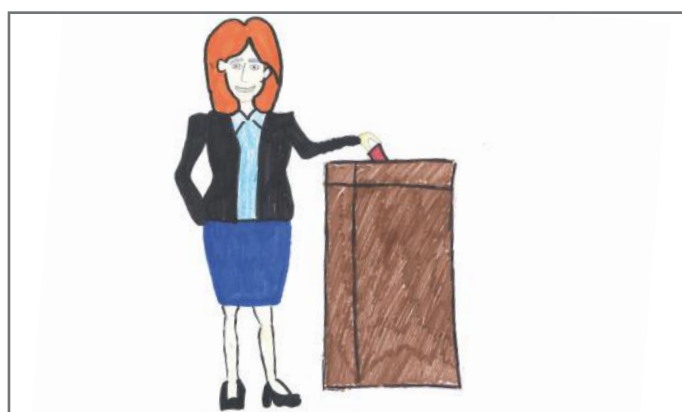
Vota e secilit ka vlerë të madhe