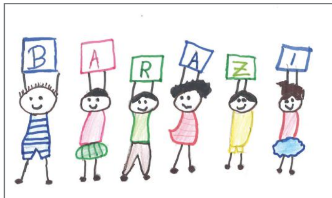
Jemi të barabartë ngado që shkojmë