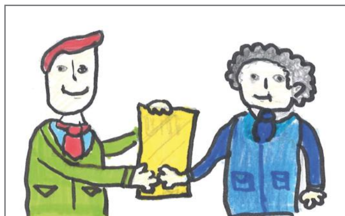
Mirëkuptimi dhe bashkëpunimi, elemente të demokracisë

jislaviv, sepse aty bëhet pikërisht miratimi i ligjeve nga deputetët, të cilët janë edhe përfaqësuesit e popullit.