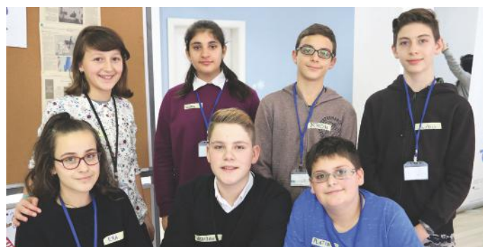
Me publikimet tona, ne bëhemi pjesë e medias

Prandaj, ju ftojmë të gjithë juve, të cilët jeni pjesë e medias që të jeni të kujdesshëm me publikimet që i bëni. Veprimet tuaja mund të kenë ndikim të madh tek të tjerët. Ne, qytetarët e kemi lirinë për t'u shprehur, andaj nëse ju keni dëgjuar raste të ngacmimit përmes internetit, ju ftojmë që t'i adresoni ato tek organet kompetente. Së bashku e ndërtojmë një shoqëri demokratike dhe me vlere.