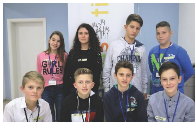
Bashkohuni me ne