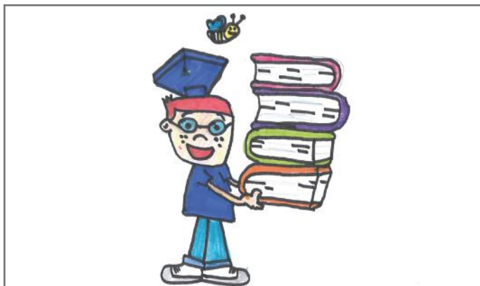
Rëndësia e edukimit qytetar në demokraci