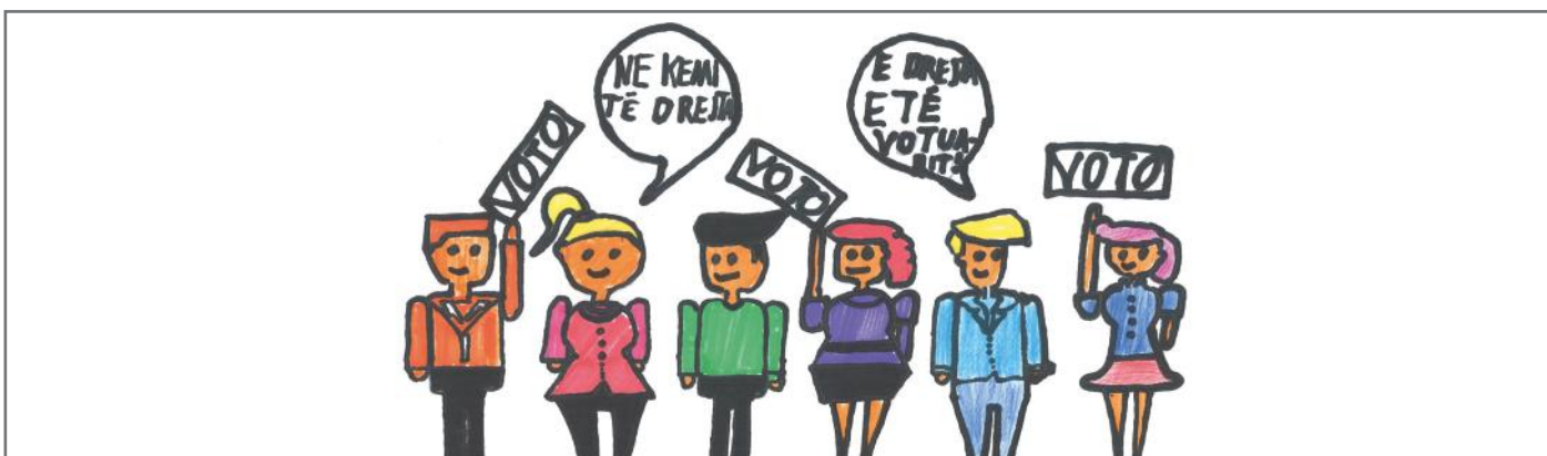
Jemi ne populli ata që vendosim për të ardhmen tonë. Prandaj, përgjegjësia jonë është që të votojmë