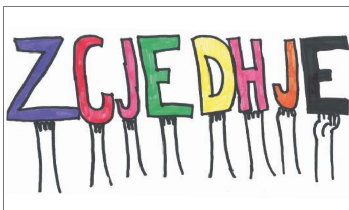
Procesi zgjedhor, baza e demokracisë përfaqësuese