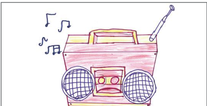
Edhe radio bën pjesë në media elektronike

Media luan rol shumë të rëndësishëm në ndërtimin e një demokracie të mirëfilltë. Përmes saj, populli është në linjë me ngjarjet më të reja që ndodhin në vend.