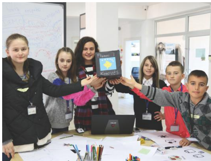
Shteti ndërtohet nga qytetarët aktiv. Prandaj, ne kemi zgjedhur të jemi të tillë

Entuziazmin tonë për fjalën vullnet, duam ta lidhim edhe me qytetarinë aktive. Asnjë qytetar nuk mund të realizoj asgjë të madhe, pa e përjetuar këtë koncept dhe pa e ditur rëndësinë e saj. Kjo sidomos vlen për qytetarët aktiv, të cilët nga humanizmi dhe vullneti që kanë, arrijnë të bëjnë ndryshme të mëdha në nivel shoqëror. Këtë mund ta ndërlikim me disa iniciativa që ata i ndërmarrin. Shembull, ne vetë marrim pjesë në OJQ të ndryshme, pastrojmë ambientin ku jetojmë dhe ndihmojmë të tjerët. Gjatë gjithë jetës sonë, kemi shumë raste kur jemi treguar qytetarë të denjë. Janë veprimet tona ato të cilat na bëjnë aktiv. Ne vetë kemi vendosur se kush do të jetë pjesë e Parlamentit të shkollës sonë, përmes votave të nxënësve. Kjo dëshmon faktin se ne me votat tona jemi bërë pjesë e vendimmarrjes.