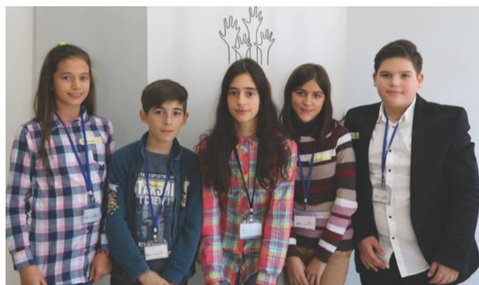
Të lumtur me përfaqësimin e shtetit tonë