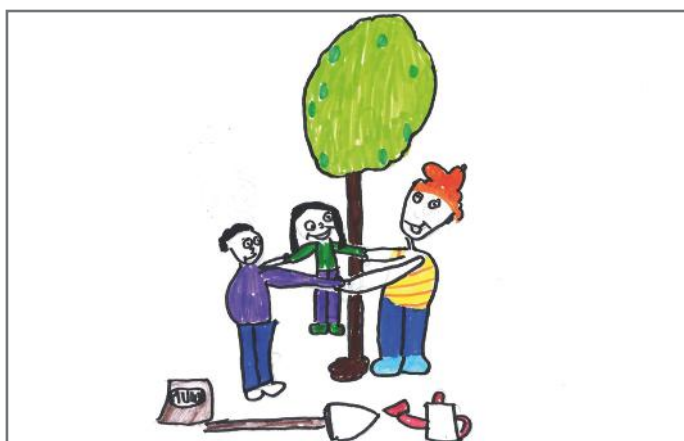
Bashkimi i ideve tona bën ndryshime të duhura