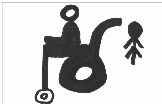
Qytetarë aktiv jemi të gjithë, pa dallim aftësive tona