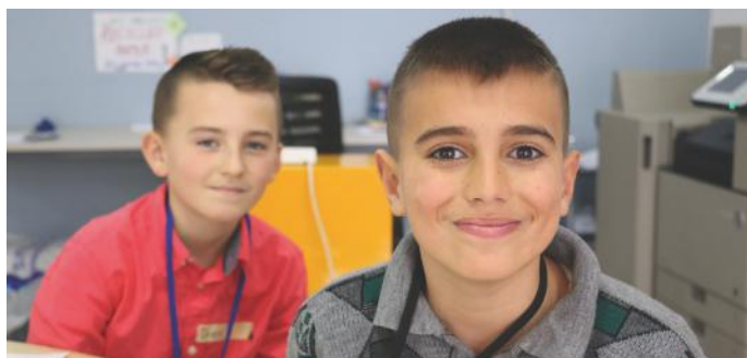
Të lumtur që kemi të drejta të shumta

Andaj, ne ndihemi shumë krenarë që jemi pjesë e këtij vendi. Për këtë arsye, çdo herë jemi duke provuar të bëhemi shembull i qytetarëve të përgjegjshëm dhe të zellshëm. Vetëm me aktivizim qytetar sigurojmë mirëqenie sociale. Për të arritur të jemi shembull i mirë, duhet që t'i ndajmë informatat që i kemi me njëri-tjetrin dhe duhet që të marrim mendimin e secilit. Qëllimi i kësaj është të arrijmë një bashkëpunim të suksesshëm. Mundësinë për t'i bërë të gjitha këto e kemi në shtetin tonë demokratik. Veçse, na takon neve që të aktivizohemi dhe t'i zbatojmë të gjitha përgjegjësitë që në takojnë si qytetarë. Se cilat janë këto përgjegjësi, vazhdoni të lexoni artikullin vijues.