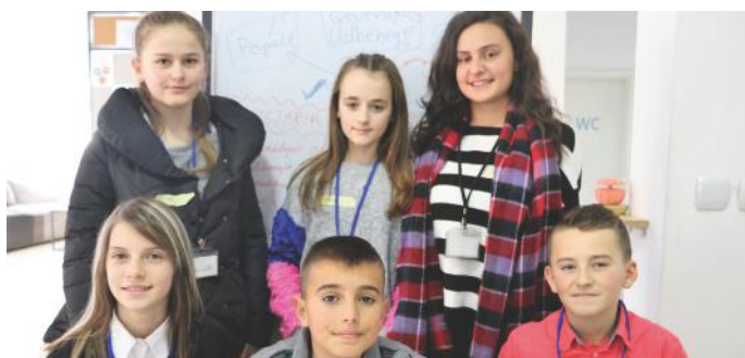
Gazetarët aktiv të Kosovës