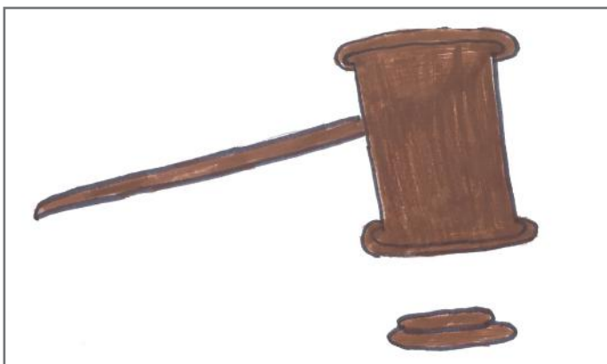
Nëse ne i thejmë ligjet, atëherë ne ndëshkohemi

Institucioni, të cilin e cekëm pak më lart, pra Kuvendi, është institucion në të cilin punojnë 120 deputetë. Këta deputetë i zgjedhim ne qytetarët, me anë të votave. Ata kanë disa detyra. E para është përfaqësimi i popullit, meqenëse ne i votojmë ata. Detyrë tjetër është të miratojnë apo të mos miratojnë ligje, si dhe detyra e tretë është ta kontrollojnë punën të cilën e bën Qeveria. Ne e kuptuam që Kuvendi është shumë i rëndësishëm, për vetë faktin se aty punojnë deputetët, të cilët flasin në emrin tonë. Është mirë të dijmë më shumë për Kuvendin dhe deputetët, sepse ata mendojnë për të ardhmen tonë.