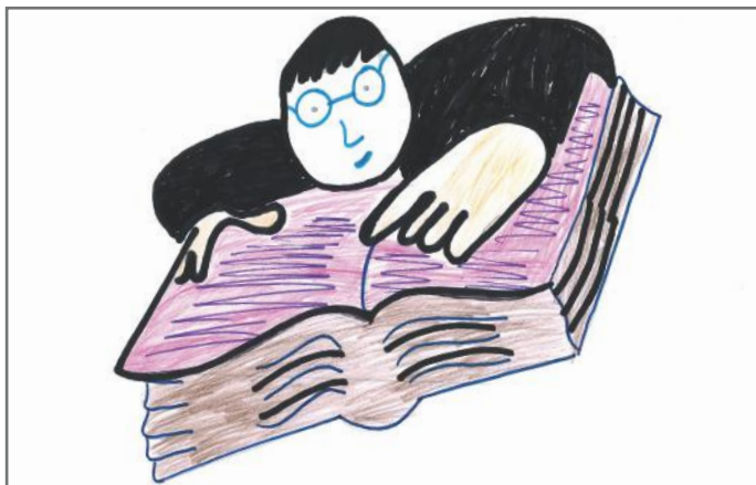
Ne mund të lexojmë se si mund të bëhemi edhe më aktiv