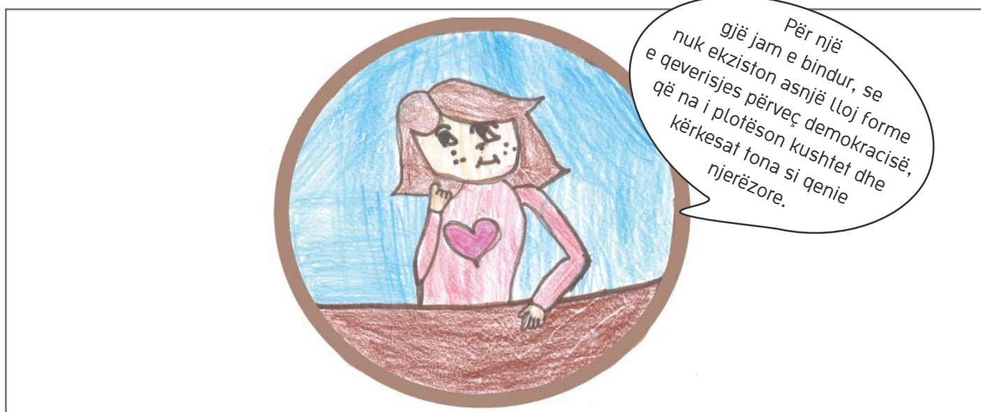
Ne punojmë së bashku

Për një gjë jam e bindur, se nuk ekziston asnjë lloj forme e qeverisjes përveç demokracisë, që na i plotëson kushtet dhe kërkesat tona si qenie njerëzore.