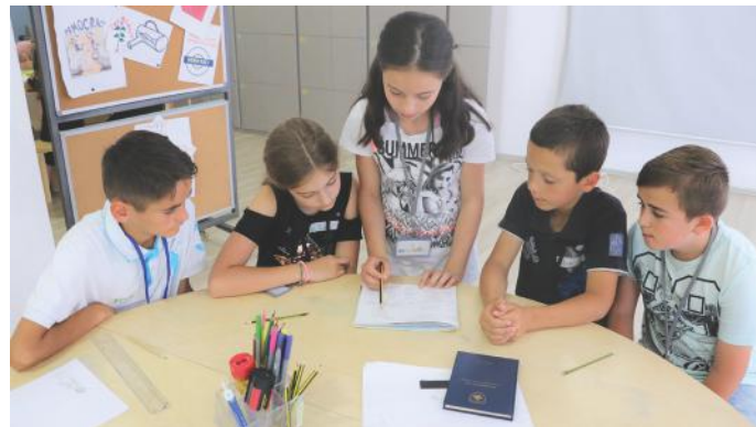
Në grupin tonë punuam me shumë përkushtim