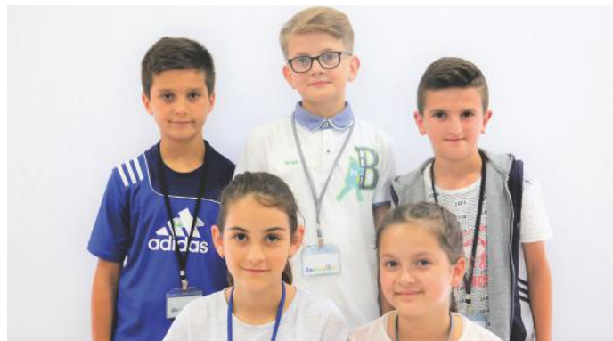
Disa nga nxënësit e klasës V-2

Gjatë leximit të artikullit tonë do të vëreni se ka më shumë fakte, por për ta bërë më tërheqës leximin e artikullit jemi munduar që përmes vizatimeve të paraqesim një shembull të vogël se si edhe ne mund të jemi ideator për ndryshime, edhe pse jemi të vegjël në moshë. Ne e kemi zgjedhur rrugën e suksesit. Edhe për ju e dëshirojmë të njëjtën gjë!