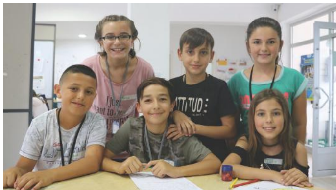
E bëjmë me dashuri rolin e gazetarëve në demokraci

jmë në harmoni me njëri-tjetrin. Kjo quhet tolerancë fetare. Këto elemente e plotësojnë formën e qeverisjes të quajtur demokraci. Dhe ne të fillë e duam, me plot gjëra të bukura që na ushqejnë me pozitivitet. Kosova edhe pse është formuar si shtet demokratik në vitin 2008, në thellësi ne çdo herë kemi qenë paqësorë dhe të denjë për të pasur një sistem të fillë.