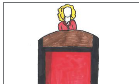
Prindërit e Zanës ditën e zgjedhjeve i menduan idetë e vajzës së tyre, dhe votuan kandidaten që menduan se do t'i ndihmoj t'i realizojë ato