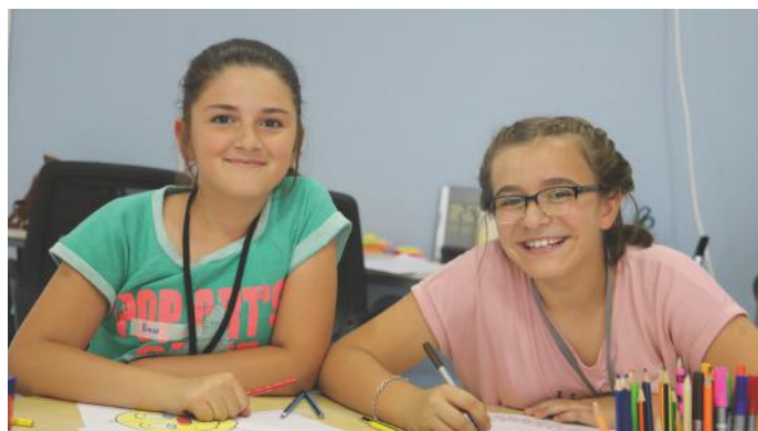
Puna në grupe na ka bërë edhe më produktiv

Element tjetër është toleranca, gjë për të cilën ne si qytetarë të Kosovës njihemi. Edhe pse jemi shtet i vogël, ne jemi praktikues të feve të ndryshme, por jeto-