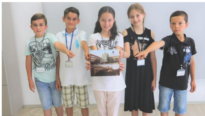
Kuvendi, vendi i ligjeve

Në grupin tonë kemi diskutuar pikërisht për një institucion i cili ndryshe njihet edhe si „Shtëpia e Popullit“, e që është Kuvendi. Në Kuvend merren vendime shumë të rëndësishme, pra aty miratohen ligjet. Deputetët e zgjedhur nga populli, i votojnë ato ligje, të cilat pastaj miratohen ose nuk miratohen varësisht nga numri i votave të tyre. Përveç që merren vendime për ligje, në Kuvend deputetët kontrollojnë punën e Kryeministrit, zv. kryeministrave, ministrave dhe zv. ministrave. Po ashtu, është e rëndësishme të përmendet që deputetët zgjedhen nga populli. Prandaj, Kuvendi ka funksion përfaqësues, sepse deputetët e përfaqësojnë popullin. Pra, me pak fjalë Kuvendi është institucioni më demokratik dhe më i rëndësishëm i vendit.