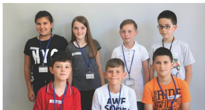
Sepse kemi dëshirë të mësojmë për zgjedhjet