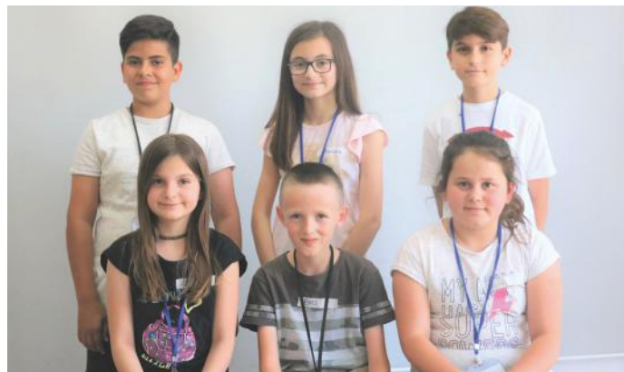
Jemi të buzëqeshur, sepse kemi të drejta