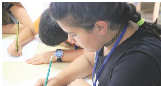
Këtu jemi duke punuar në artikullin tonë

Në vendin tonë ne kemi dy lloje të zgjedhjeve. Janë zgjedhjet qendrore dhe ato komunale. Në zgjedhjet qendrore ne qytetarët i zgjedhim përfaqësuesit tanë, të cilët janë deputetët. Ndërkaq, në zgjedhjet komunale i zgjedhim kryetarët e komunave përkatëse dhe asamblistët. Asnjëherë mos harroni se vota është e drejtë dhe përgjegjësi e jona, si qytetarë.