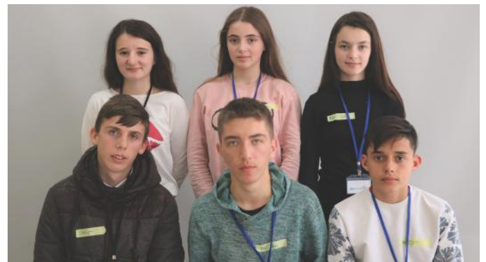
Autorët e artikullit