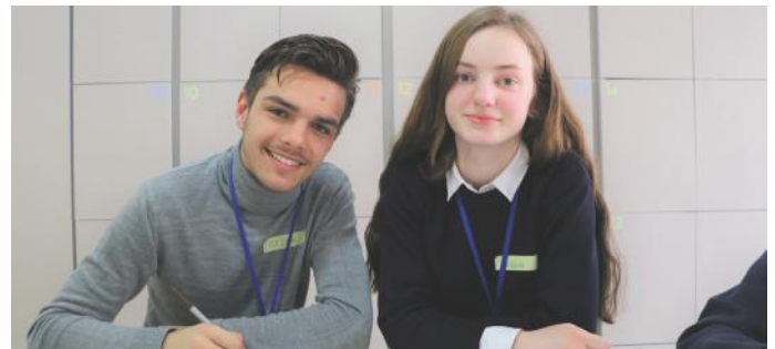
Vizatimet janë bërë nga ne të dy

Ne si nxënës, duke qenë e ardhmja e vendit, duhet t'i bëjmë krenarë mësuesit tanë, duke mësuar sa më shumë dhe duke qenë nxënës të përgjegjshëm.