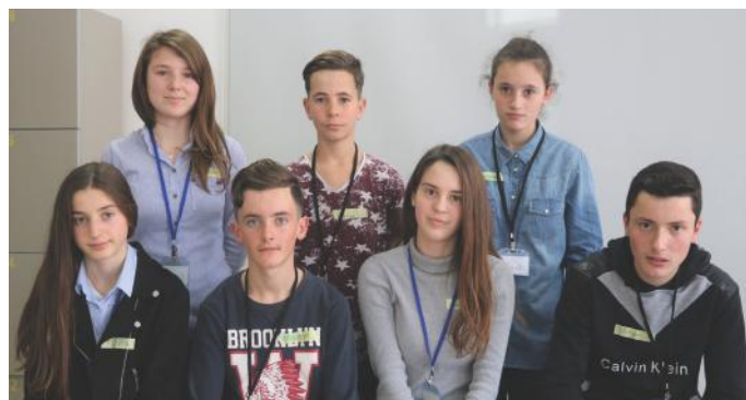
Ne e kemi fuqinë, sepse ne jetojmë në demokraci

një shumë e parave nëse ata i kthejnë shishet dhe kanaçet e zbrazëta në dyqanet ku i kanë blerë ato. Ligji për të cilin shkruajtëm më lart, do të na ndihmonte shumë në mbrojtjen e ambientit, por kemi edhe ligje të tjera të cilat na mbrojnë nga rreziqe të tjera p.sh. Ligji për Sigurinë në Komunikacionin Rrugor. Ligjet janë rregulla të shkruara të cilat duhet të respektohen nga të gjithë ne. Ato mund të jenë edhe mësim për ne. Nëse ne e shkelim një ligj, ne pa dyshim se dënohemi. Mirëpo, ana pozitive është që ne nuk e përsërisim atë gabim prapë, sepse njeriu duhet të mësojë nga gabimet. Të drejtën për të propozuar një projektligj e kanë deputetët, Presidenti, Qeveria, dhe 10.000 qytetarë. Por miratimin e ligjeve, e bëjnë deputetët me anë të votave të tyre. Ne si grup, i cili shkroi për ligjet, e kuptuam rrënjën se pse duhet t'i respektojmë ato. Tani ju mbetet edhe juve të bëni të njëjtën gjë.