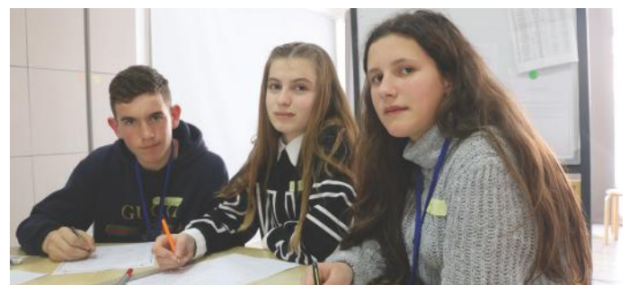
Roli ynë ishte të shprehim idetë tona rreth artikullit