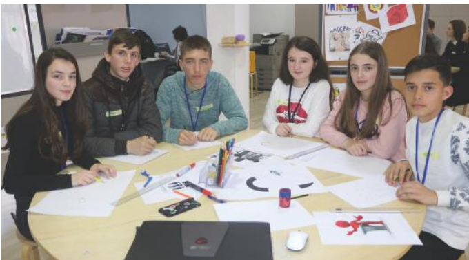
Gjatë realizimit të punës në grup të vogël

në shkollë për shembull. Kur e zgjedhim kryetarin e klasës, jemi shumë më të kujdesshëm, sepse kryetari i klasës është përfaqësuesi ynë. Ashtu siç edhe popullin e përfaqësojnë deputetët. Zgjedhja si e deputetëve, kryetarit të komunës dhe asamblistëve bëhet në të njëjtën mënyrë qysh e zgjedhim edhe ne kryetarin e klasës. Pra, me anë të votave të lira. Por jo të gjithë këta përfaqësues që i cekëm zgjedhjen në të njëjtat zgjedhje. Deputetët i zgjedhim në zgjedhjet qendrore, kurse kryetarin e komunës dhe asamblistët në zgjedhjet lokale. Kuptohet, të drejtë për të marrë pjesë dhe për t'i zgjedhur përfaqësuesit tek të dy llojet e zgjedhjeve e kanë personat mbi moshën 18 vjeçare. Vota e secilit ka vlerë dhe rëndësi. Kjo është arsyeja pse ne kërkojmë nga ju që gjithmonë të votoni.