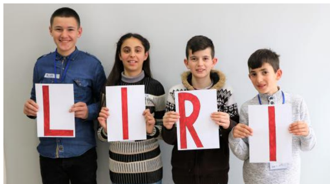
Përfaqësuesit e së ardhmes

Shpresojmë që nga ky artikull, ju të dashur lexues, keni kuptuar rolin e Kuvendit në jetën tonë. Ne kemi një mesazh për ju: t'i respektojmë ligjet, të jemi të përgjegjshëm dhe të jemi tolerant në mënyrë që të jetojmë një jetë paqësore.