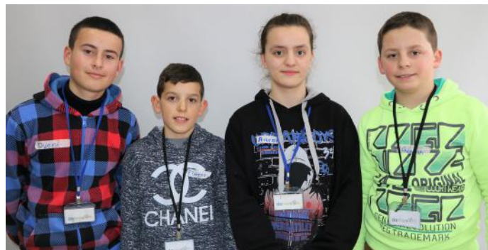
Le ta prijë e mbara vendin tonë

Për ne si nxënës nuk ka rëndësi se cila formë e demokracisë është e pranishme, përderisa qëllimi i saj është mirëqenia e përbashkët e qytetarëve. Për këtë e duam demokracinë. Ajo na falë ngrohtësi dhe barazi.