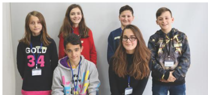
Të lumtur dhe demokratikë sa më s'ka

Fjala demokraci rrjedh nga fjalët e vjetra greke që në gjuhën tonë shqupe kanë një kuptim të madh. „Demos“ do të thotë popull dhe „kratos“ do të thotë udhëheqje ose fuqi. Demokracia ka prejardhjen pikërisht nga Greqia e lashtë, ku është paraqitur në vitin 507 para erës sonë. Në fillim demokracia ishte direkte, që do të thotë se vetë qytetarët merrnin vendime për të ardhmen e tyre brenda shtetit të tyre. Mirëpo, fatkeqësisht në këtë demokraci gratë, të varfërit, të moshuarit, fëmijët dhe jo vendasit, nuk kishin të drejtë të merrnin pjesë në këtë lloj vendimmarrje. Kurse tash, ne jetojmë në një demokraci përfaqësuese ku kemi të drejtën e votimit, të fjalës së lirë, të pjesëmarrjes dhe përfshirjes në protesta, peticione, debate, takime, parti politike, etj. Këto të drejta janë të barabarta për të gjithë qytetarët e Kosovës. Faleminderit për leximin. Mirëupafshim!