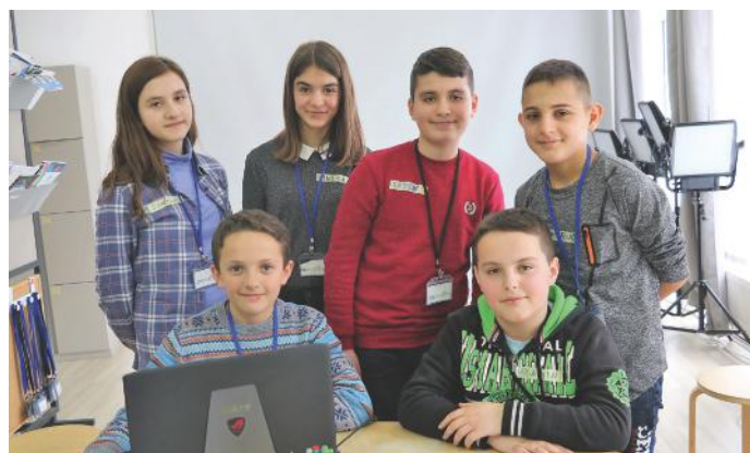
Demokracia mbi të gjitha

goranë. Duke jetuar në një shtet demokratik, siç është Kosova, duhet të respektojmë njëri-tjetrin, pa dallime gjinore, racore, etnike, etj.