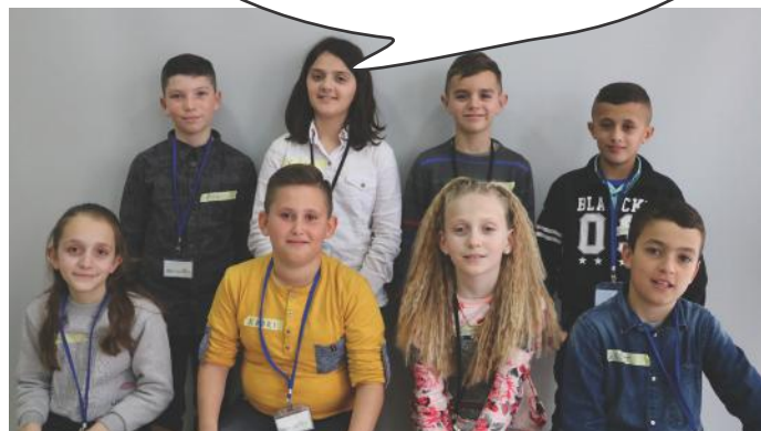
Lumturinë e kemi në zemrat tona. Gëzuar pavarësia!

Festojmë 10 vjetorin e pavarësisë. Festojmë së bashku, sepse jemi qytetarë të demokracisë dhe gëzojmë shumë të drejta