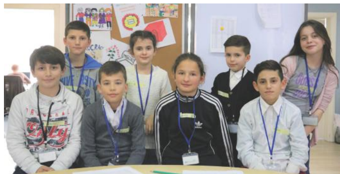
Të drejtat tonë mbrohen me ligj

Duam ta ndajmë me juve një skenë të cilën e kemi parë rrugëve të qytetit tonë, pra në Viti. Ishte një moment shumë i papëlqyer nga ne, kur tek sa po shkonim në shkollë, e kemi parë një bashkëmoshatar tonin i cili po kërkonte lëmshë. Ne donim ta ndihmonim atë, duke e ditur se në demokraci të gjithë duhet të trajtohen në mënyrë të barabartë dhe të gjithë duhet të ndihen se po trajtohen në këtë mënyrë. Këtë edhe e realizuam, duke i ndihmuar familjes së djaloshit dhe duke ua bërë me dije se të drejtat e fëmijëve duhet të mbrohen gjithmonë. Këtë fakt e kemi mësuar ndër vite, por sot e mësoam edhe njëherë që në shtetin tonë kemi një ligj i cili lidhet pikërisht me të drejtat tona dhe kjo na bën shumë të lumtur, sepse ne duam që çdo fëmijë kudo që jeton, të gëzojë të drejta, sikurse edhe ne.