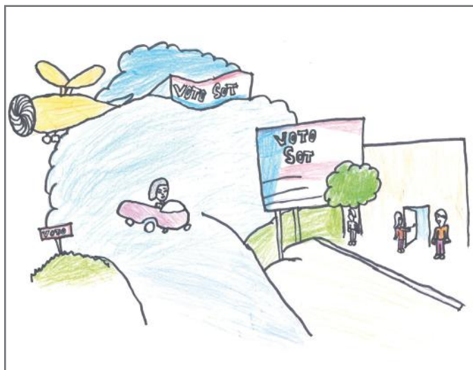
Një votë sjell ndryshimin, prandaj qytetari aktiv tregohet i përgjegjshëm dhe e shfrytëzon të drejtën e votës