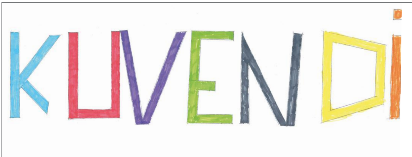
Të gjitha ligjet miratohen ose nuk miratohen në institucionin më të lartë legjislativ, në Kuvend. Deputetët janë përfaqësuesit e popullit dhe ata marrin vendime të cilat ndikojnë drejtpërdrejt në jetën e secilit qytetar