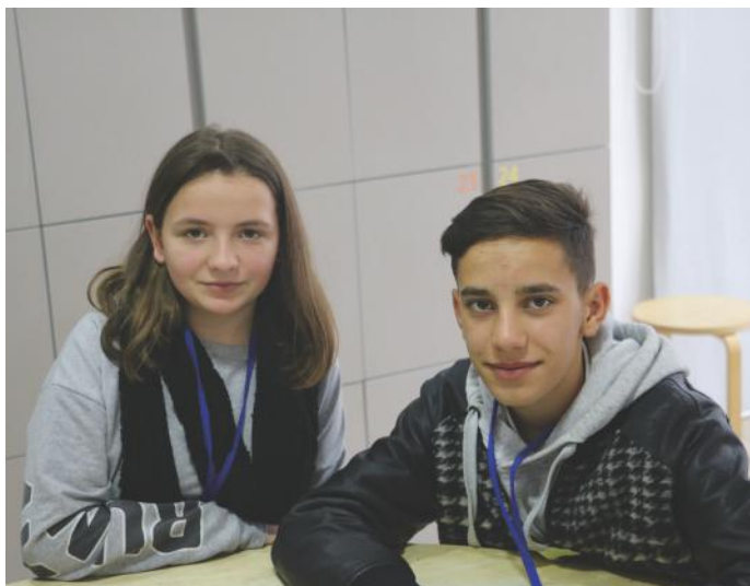
Të gjithë fëmijët i kemi të drejtat e barabarta, dhe ato janë: e drejta e shkollimit, e drejta e lojës, e drejta e familjes, etj