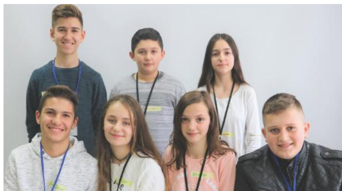
Demokratë dhe jo vetëm

Por, si demokracia përfaqësuese ashtu edhe ajo e drejtpërdrejtë kanë për qëllim arritjen e mirëqenies së qytetarëve. Prandaj, për ne nuk ka rëndësi cila është, me rëndësi që është demokraci.