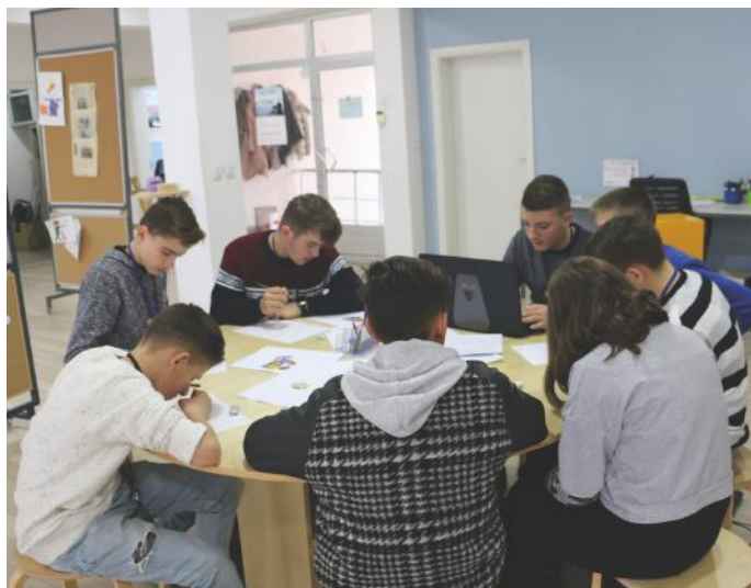
Sot kemi pasur rastin të jemi në rolin e gazetarëve, dhe gjatë punës sonë kemi bashkëpunuar me njëri-tjetrin