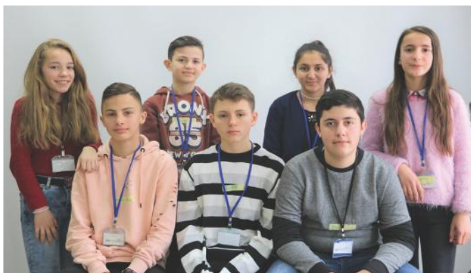
Ne iu mbajmë të informuar për çdo gjë, sepse jemi gazetarë

Pra, e drejta e informimit është një nga të drejtat bazike, e cila na ndihmon që të kemi një shoqëri demokratike e me të drejta të barabarta. Po ashtu, informimi i drejtë dhe i mirë, krijon shoqëri mendjehapur dhe civilizim të mirëfilltë.