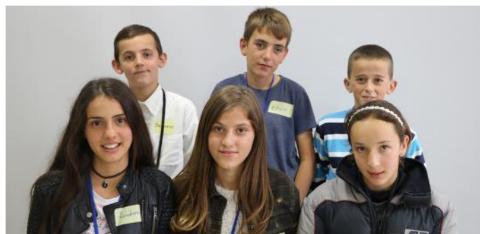
Këta jemi ne, fytyrat prapa këtij artikulli

Në këto mënyra, ata mund ta bëjnë zërin e tyre të dëgjohet pastër dhe fuqishëm. Ne kërkojmë nga ju që të bëheni qytetarë sa më aktiv dhe iu themi faleminderit me gjithë zemër të gjithë lexuesve të këtij artikulli, qofshin ata fëmijë apo të rritur.