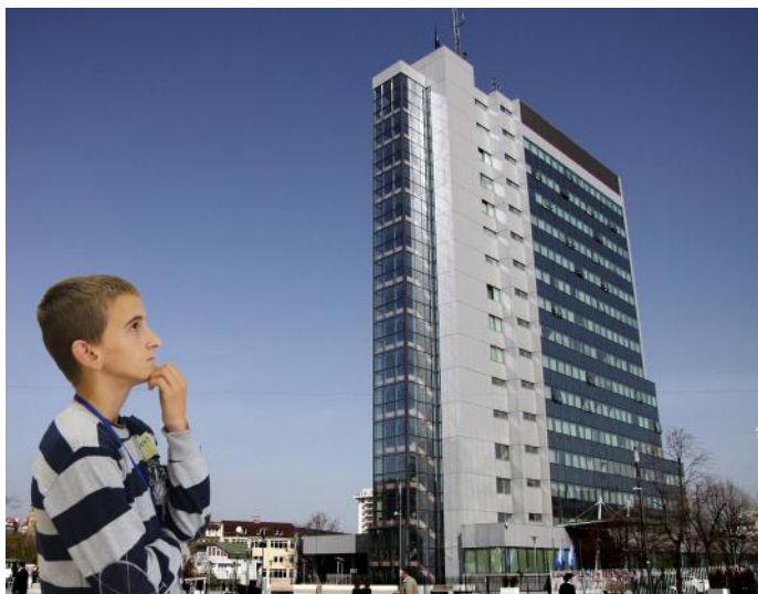
Qeveria siguron paqe dhe harmoni në vend