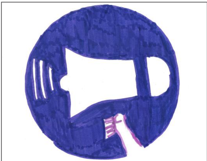
Zëri im dëgjohej