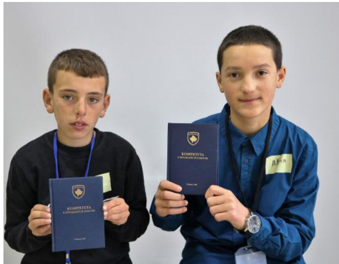
Të drejtat e mia janë të mbrojtura