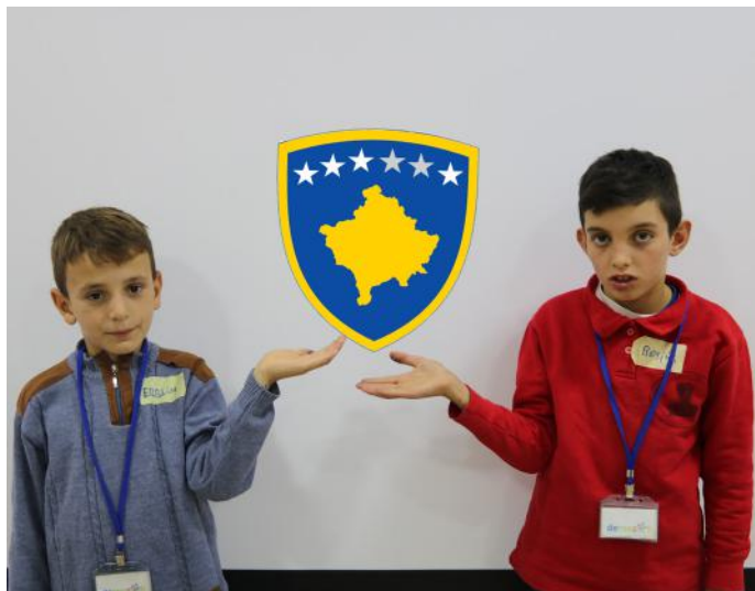
Ne kujdesemi për shtetin tonë