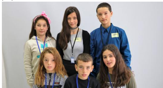
Të lumtur që kemi deputetët si përfaqësues të popullit

Demokracia, pra është kjo: mos bëra e as një lloj dallimi në asnjërin prej ligjeve të miratuara në Kuvend. Kuvendi ka miratuar edhe ligje për të drejtat e fëmijëve, pasi që fëmijët kanë rol të veçantë në fuqizimin e demokracisë. Këto ligje na mundësojnë që ne t'i gëzojmë të drejtat, që veçse i kemi. Prandaj, jemi shumë të lumtur dhe mirënjohës për shtetin tonë. Duke e parë rëndësinë e këtij institucioni ligjvënës, ju ftojme të gjithë juve qytetarë që ta ndihmoni punën e Kuvendit. Këtë ndihmë mund ta dhuroni duke i zbatuar ligjet e miratuara nga ky institucion. E megjithëse Kuvendi na jep kaq të mira neve qytetarëve, ne do të kujdesemi që ta ruajmë dhe ta zhvillojmë shtetin tonë paqësor.