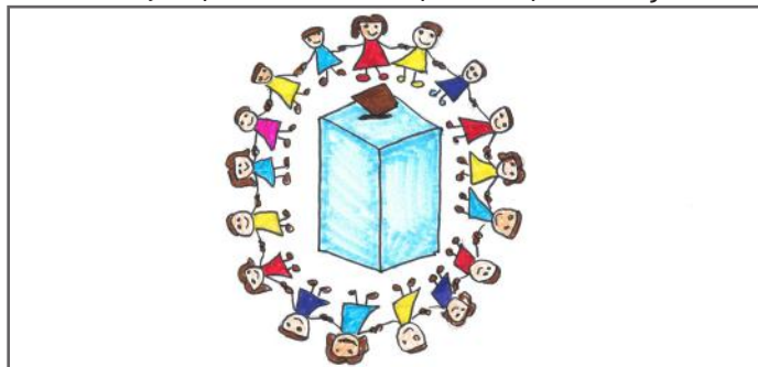
Të votosh është e drejtë e secilit

sin ata, e gjithashtu mund të marrin pjesë në protesta, por vetëm se ata duhet të mbajnë mend që gjatë tyre nuk duhet të përdorin dhunë. Po ashtu, qytetarët mund të marshojnë për të adresuar pakënaqësitë e tyre.