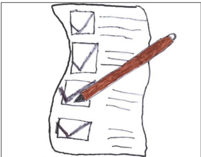
Votimi ndikon në zhvillimin e demokracisë