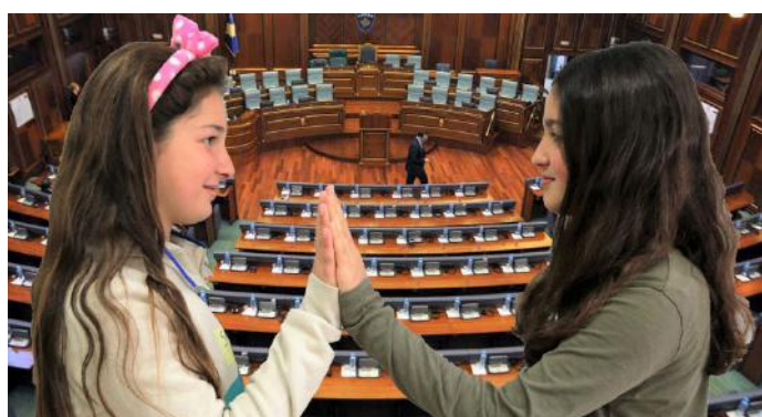
Kuvendi na sjell lumturi

Kuvendi është institucion shumë i rëndësishëm për popullin. Rëndësinë e tij mund ta vërejmë në çdo hap të jetës sonë. Kuvendi, punën e tij e realizon në mënyrë që qytetarët t'i kenë të gjitha kushtet jetësore të plotësuara. Me plotësimin e kushteve jetësore, arrihet