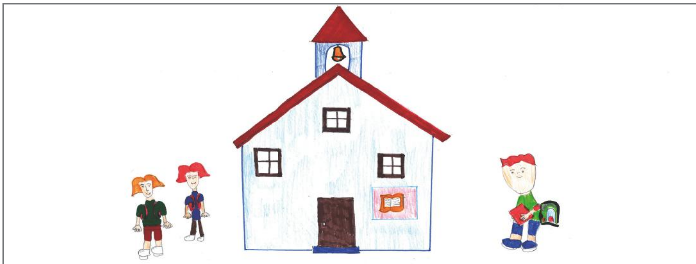
Asnjëherë nuk duhet të kufizojmë veten duke bërë dallime. Të gjithë jemi njerëz dhe të gjithë kemi të drejtat tona. Ta duam dhe ta respektojmë njëri-tjetrin, ashtu si edhe na ka hije