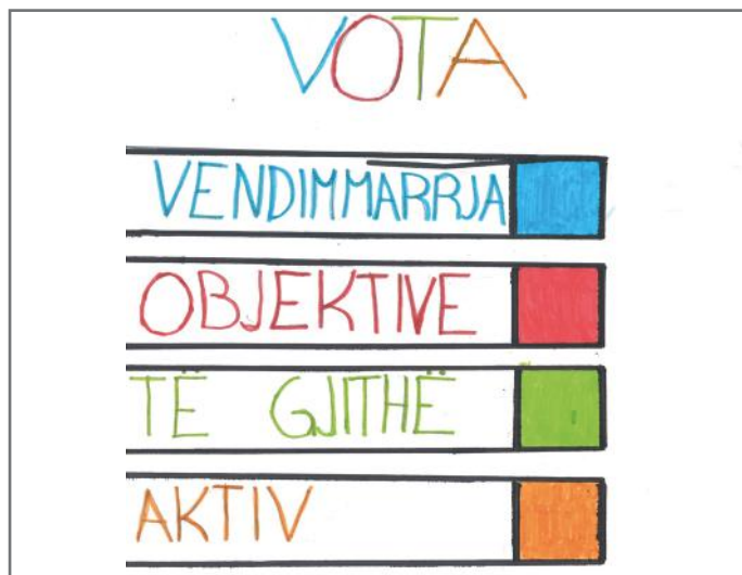
Vota është vendimmarrëse dhe duhet të jetë objektive. Të gjithë të jemi aktiv duke votuar