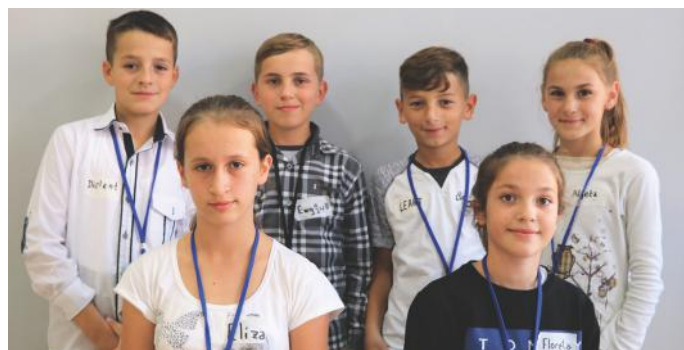
Qytetarët aktiv në demokraci