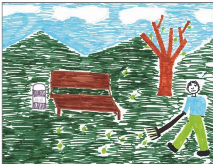
Qytetarët aktiv nuk mendojnë vetëm për veten. Ata marrin iniciativa që e përmirësojnë jetën në komunitet