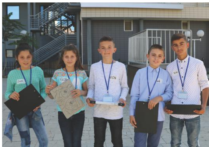
Ekipi më i ri i gazetarëve