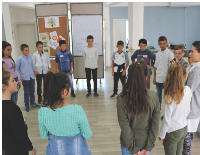
Në këtë fotografi mund të shihni atmosferën e këndshme sot në „Demos-ti“