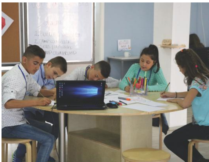
Mendojmë se gazeta jonë do të ndihmojë shumë që edhe ju të kuptoni rëndësinë e demokracisë