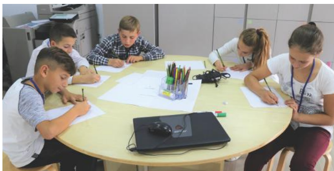
Gjatë punës në grup

Gjithashtu, vendi ynë ka shumë nevojë edhe për angazhimin tonë. Kontributi ynë është i domosdoshëm. Për shembull, puna vullnetare është shumë e rëndësishme për të përmirësuar jetën në komunitet. Këtë mund ta bëjmë duke u organizuar për ta pastruar lagjen, shkollën, apo edhe qytetin ose fshatin ku jetojmë.