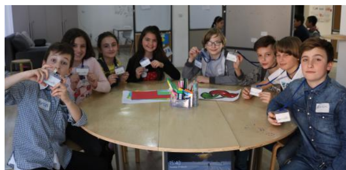
Autorët e artikullit

Në këtë mënyrë ne do të jemi aktiv dhe do të jemi shembull për të tjerët.