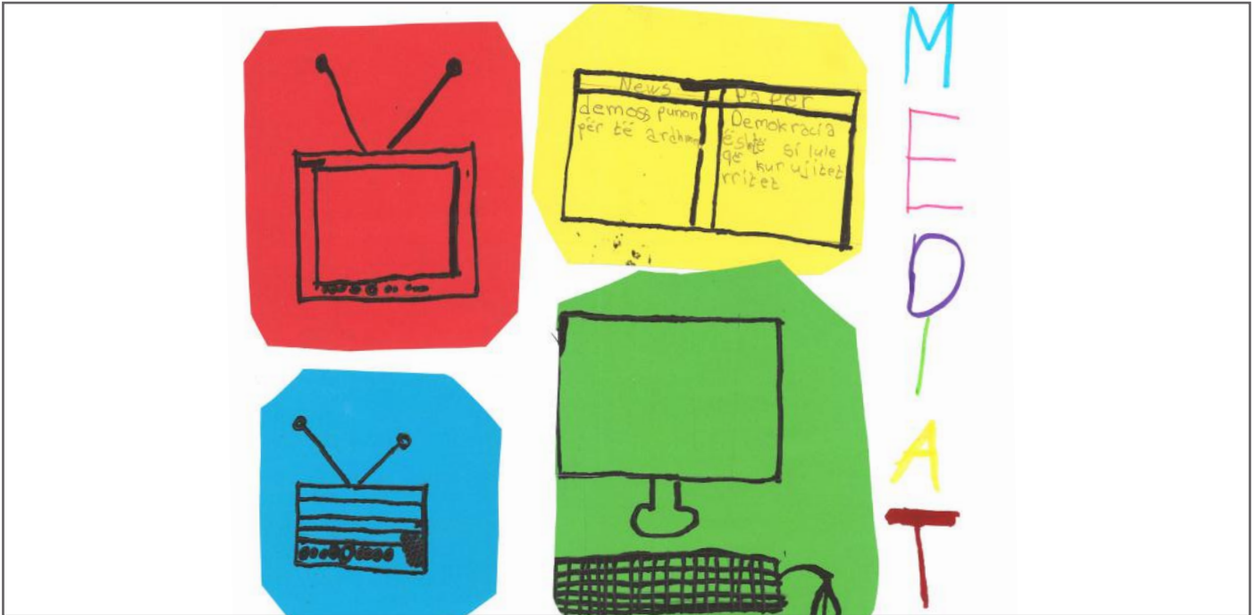
Këtu kemi paraqitur disa nga llojet e mediave të cilat luajnë rol shumë të rëndësishëm në jetën tonë