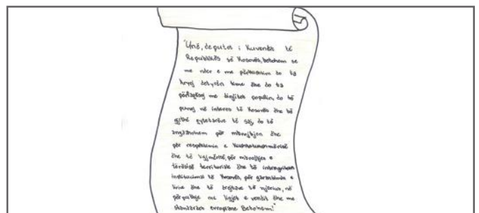
Deklarata e Betimit të deputetëve

Teksa ne mësuam sot për Kuvendin e Kosovës na u kujtua se edhe ne bëjmë zgjedhje në klasën tonë. Një ngjashmëri tjetër është se në klasën tonë ka vajza dhe djem, po ashtu edhe në Kuvend ka gra dhe burra deputetë. Nga njohuritë që morëm ne mësuam se puna e deputetëve është e rëndësishme dhe kërkon shumë përkushtim. Shpresojmë që një ditë të bëhemi edhe ne deputetë në të ardhmen. Faleminderit që lexuat artikullin tonë.