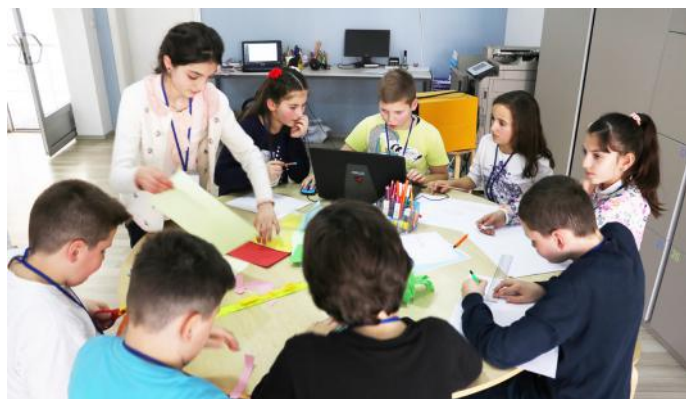
Puna e grupit „Rushi“

mundësinë të zgjedhim. Sigurisht se është më mirë kur ke mundësi zgjedhjeje, pra ke më shumë se vetëm një alternativë. Kjo jo vetëm që na gëzon ne si fëmijë, por po ashtu edhe na e bën jetën tonë më të lehtë. Ne e menduam si shembull më të mirë për ta shpjeguar procesin zgjedhor, zgjedhjet që i bëjmë në klasën tonë. Kjo funksionon përmes votave dhe shprehjes së lirë të mendimit nga shokët dhe shoqet e klasës, sepse kryesia e klasës tonë është zgjedhur me votat tona. Ne, jemi të lirë të votojmë për atë person që mendojmë që është më i miri për këtë detyrë.