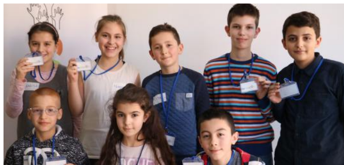
Gazetarët e ardhshëm të demokracisë

Kuvendi i Republikës së Kosovës vazhdoi punën e tij në mënyrë të pavarur që nga data 17 shkurt 2008, atëherë kur u shpall Pavarësia e Kosovës. Në Punëtorinë e Demokracisë sot ne mësuam se Kuvendi i Kosovës ka gjithsej 120 deputetë, prej të cilëve 100 janë shqiptarë, kurse 10 të tjerë janë serbë, dhe 10 të tjerë janë deputetë të komuniteteve të ndryshme jo shumicë.