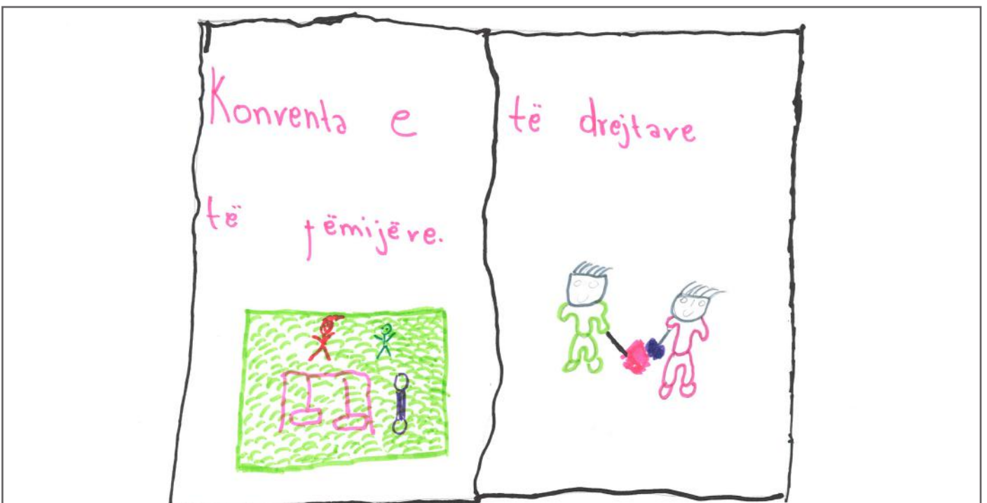
Ky libër, është një ndër librat më të dashur nga ne, sepse këtu janë të shkruara të gjitha të drejtat tona si fëmijë

Ne si qytetarë kemi të drejtë të informohemi saktë dhe në mënyrë korrekte. Andaj, mediat kanë përgjegjësi që informatat të cilat i marrin të na i përçojnë drejt.