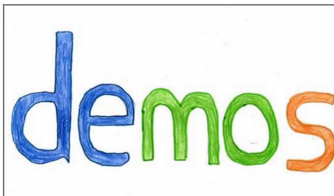
Demosi (populli) është i lirë të zgjedh përfaqësuesit e vet me anë të votave