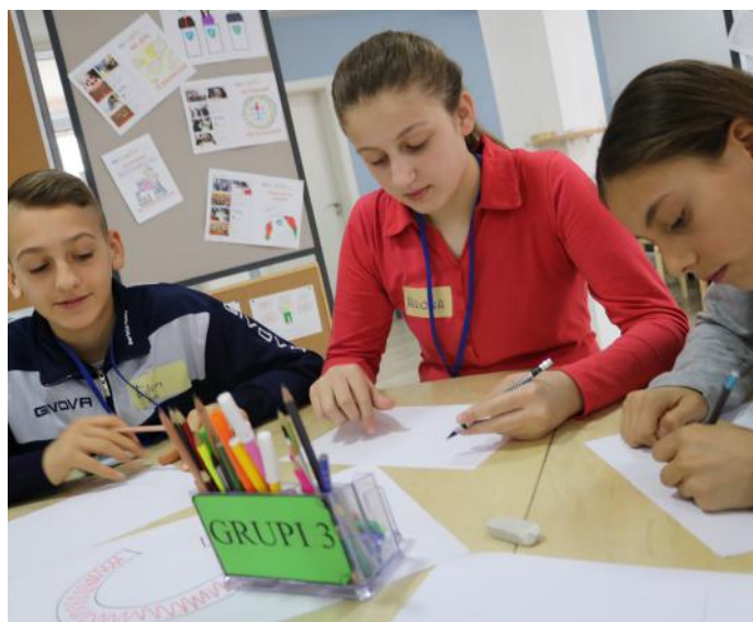
Ndarja e pushtetit e paraqitur në vizatim