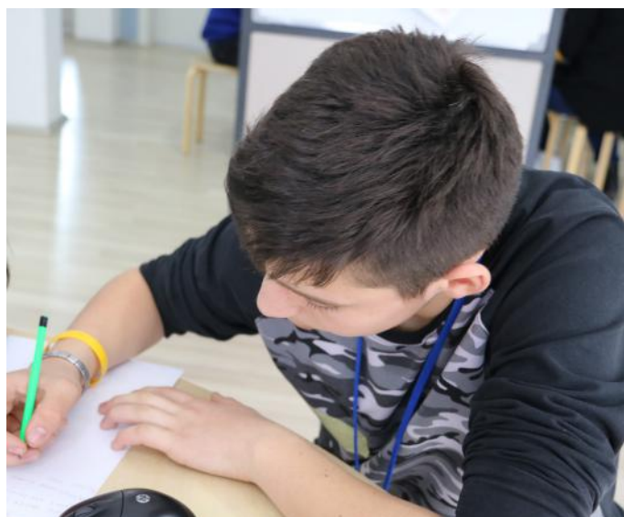
Ndarja e pushtetit e paraqitur në vizatim