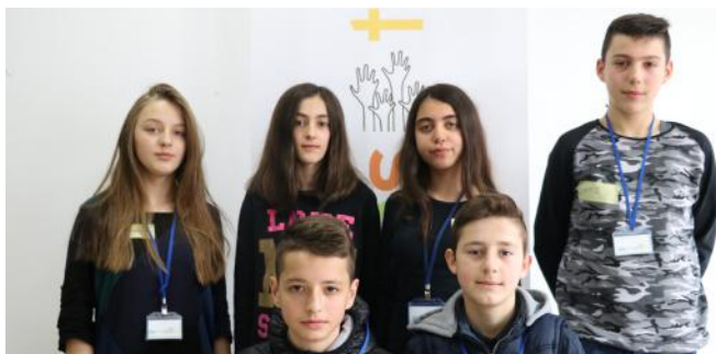
Grupi që punoi këtë artikull

Pushteti në Kosovë ndahet në tri degë. Ato janë dega legjislative, ekzekutive dhe gjyqësore. Si institucion legjislativ është Kuvendi i Kosovës. Ai i shkruan dhe miraton ligjet tona. Qytetarët e Kosovës zgjedhin deputetët e Kuvendit dhe udhëheqësit e vendit tonë me anë të votave. Kuvendi është i përbërë nga 120 deputetë dhe secili prej tyre ka detyra të caktuara. Qeveria është institucion ekzekutiv i cili i zbaton ligjet e miratuara nga Kuvendi. Qeveria dhe Kuvendi bashkëpunojnë me njëra-tjetrën për zgjidhjen e problemeve në vendin tonë. Si institucion gjyqësor kemi gjykatat të cilat ndajnë drejtësi. Ne në Kosovë e kemi Gjykatën Themelore, të Apelit dhe atë Supreme. Ndërsa Gjykatat Kushtetuese merret me interpretimin e Kushtetutës së Kosovës dhe neneve të saj. Secili nga këto institucione ka detyra të ndara por ato punojnë së bashku me njëra-tjetrën. Kjo ndodh edhe në një orkestër, ku të gjitha instrumentet luajnë së bashku që të krijojnë muzikën që ata dëshirojnë të bëjnë.