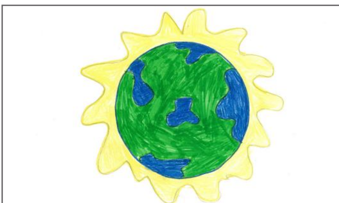
Një botë me shumë ndryshime të mira