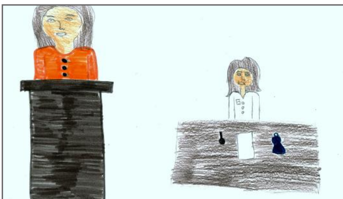
Një deputete duke folur për një çështje të rëndësishme parlamentare.