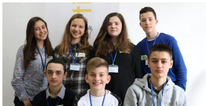
Gazetarët e këtij artikulli

Prandaj, ne mendojmë se duhet të jemi më të vetëdijshëm për jetën tonë të cilën dikush e ka ëndërr ta ketë si ne. Pa marrë parasysh racën, gjiinë, fenë, kombin apo gjendjen ekonomike, ne duhet të jemi demokrat. Kjo është porosia e grupit tonë për të gjithë ju.