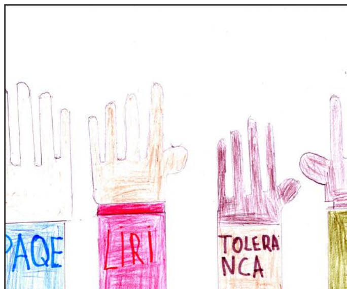
Jetojmë të lumtur dhe pa bregë me elementet demokratike