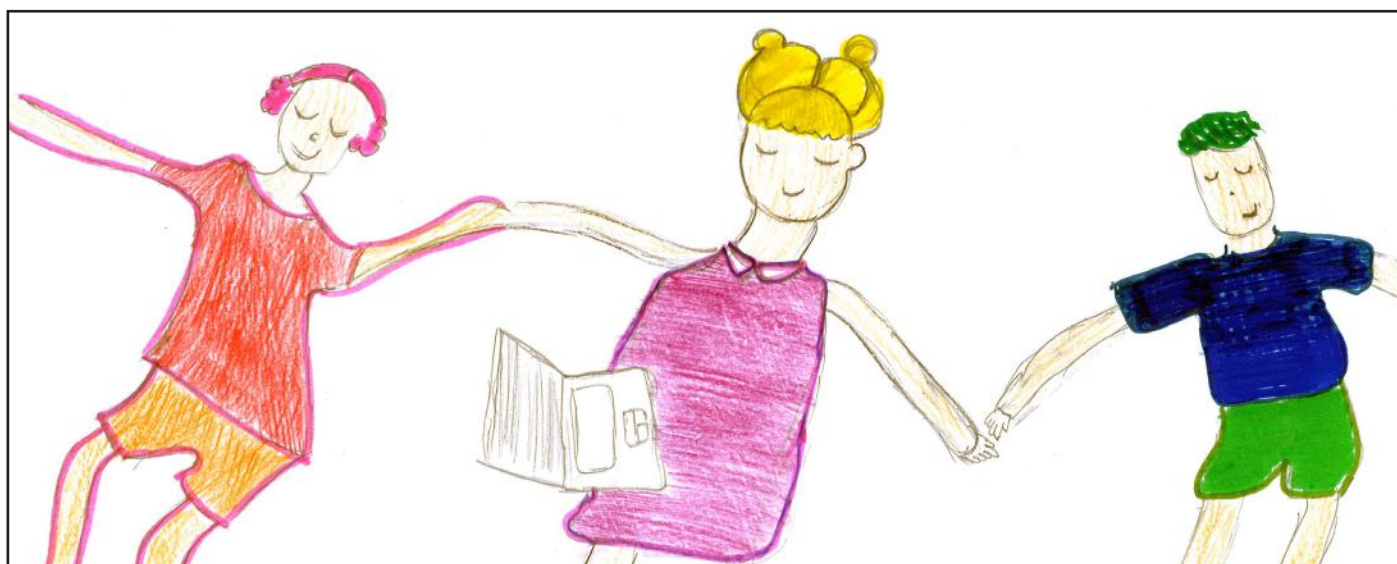
Të bashkuar ne shkojmë përpara. Ta ndihmojmë njëri - tjetrin sepse të gjithë jemi të barabartë