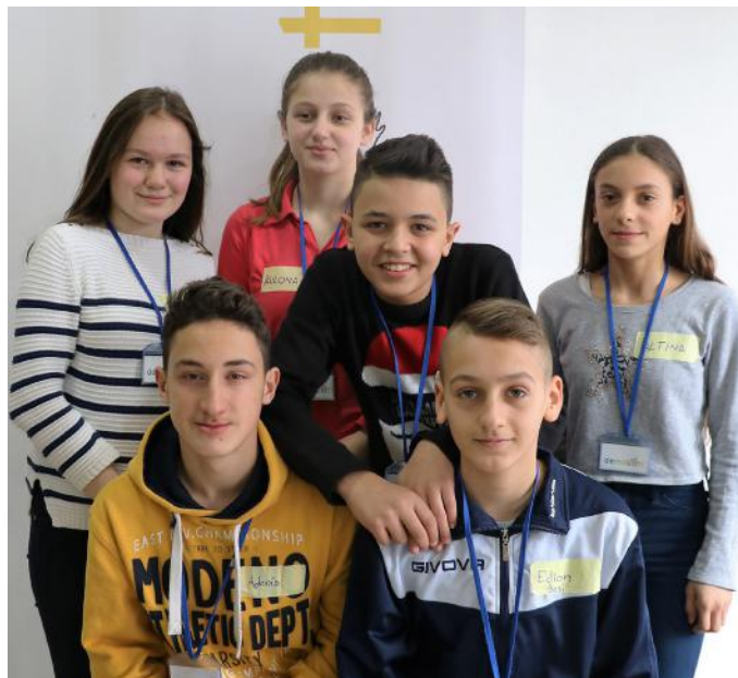
Autorët e artikullit

Kështu ne sadopak me fjalët tona e kemi shprehur fjalën demokraci dhe dashurinë për një ardhmëri me të ndritur për vendin tonë.