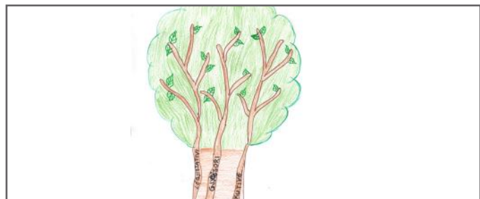
Ndarja e pushtetit e paraqitur në vizatim

ne demokracia ka vlerë të madhe. Për ne, demokracia nuk do të thotë se është Kryeministri, Presidenti apo ministrat ata që udhëheqin, por jemi ne ata që e udhëheqim vendin tonë. Ne mendojmë se duhet qeverisur me vëmendje të madhe ndaj zërit të popullit, sepse populli iu ka besuar përfaqësuesve të vet. Ky besim i madh nuk duhet humbur sepse nëse ne bëjmë padrejtësi, atëherë jemi të padrejtë si me popullin