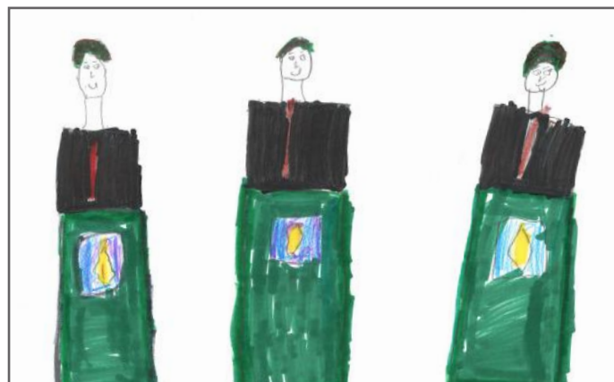
Këta janë kandidatët për deputetë