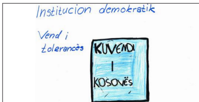
Kuvendi i zbaton parimet e demokracisë

fillor dhe i mesëm i ulët, të jetë i obliguar për të gjithë qytetarët që jetojnë në Kosovë, sepse shteti ka zhvillim më të madh kur qytetarët e saj janë të edukuar dhe të arsimuar. Kuvendi i Kosovës ka tri funksione: funksionin legjislativ, sepse Kuvendi propozon dhe miraton ligjet; funksionin përfaqësues, sepse deputetët të cilët punojnë në Kuvend e përfaqësojnë popullin; dhe funksionin kontrollues, sepse Kuvendi kontrollon Qeverinë, e cila i vë në zbatim ligjet e marra nga Kuvendi. Pra, Kuvendi është institucion mjaft i rëndësishëm për popullin, sepse çështjet më të rëndësishme për vendin diskutohen aty. Jemi shumë me fat që kemi pasur rastin të mësojmë për këtë institucion, dhe presim që edhe ju të mësoni sadopak. Së bashku mund t'i zbatojmë parimet e demokracisë dhe gjithmonë duhet bërë thirrje në këtë aspekt. Ne në demokraci kemi të drejtë të ndërtojmë të ardhmen tonë, prandaj bëhu edhe ti pjesë e ndërtimit të së ardhmes.