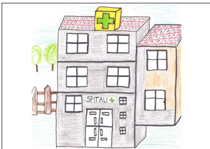
Spitali na ndihmon që të jemi të shëndetshëm dhe të lumtur

Ne në klasën tonë kemi mbledhur të holla për t'iu ndihmuar nxënësve të varfër që të blejnë libra, fletore dhe mjetet e tjera që na nevojiten për mësim. Gjithashtu, ne iu ndihmojmë qytetarëve të varfër. Këtë e bëjmë duke iu dhënë rroba. Kjo është një ndihmë që mund t'iu ofrojmë qytetarëve në nevojë, sepse edhe ata janë të barabartë me ne. Për të qenë të shëndetshëm, ne mbledhim mbeturina dhe mbajmë qytetin tonë të pastër. Kjo sipas nesh është qytetaria aktive.