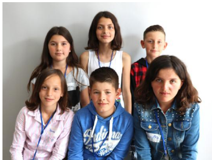
Autorët e artikullit

Kosova ka përafërsisht 2 milionë banorë. Për këtë arsye populli duhet të dal në zgjedhje, që të zgjedh përfaqësuesit e vet. Të drejtën për t'i zgjedhur përfaqësuesit e shtetit tonë e kemi nga moshja 18 vjeçare. Kjo ngase, në këtë moshë jemi më të pjekur dhe e dimë më mirë si duhet të jenë personat, të cilët do ta përfaqësojnë vendin tonë, Kosovën. Përveç që e kemi të drejtën për të zgjedhur, ne e kemi të drejtën edhe për të kandiduar për deputetë, kuptohet nga moshja 18 vjeçare. Këto të drejta sigurohen nga sistemi më i mirë i qeverisjes, që është demokracia. Pra, populli fuqinë që ka, ia jep deputetëve. Kurse, deputetët zgjedhin Presidentin. Kjo i bie se vota jonë ka vlerë të madhe në qeverisjen e vendit. Prandaj, bëhuni sa më shumë qytetarë aktiv.