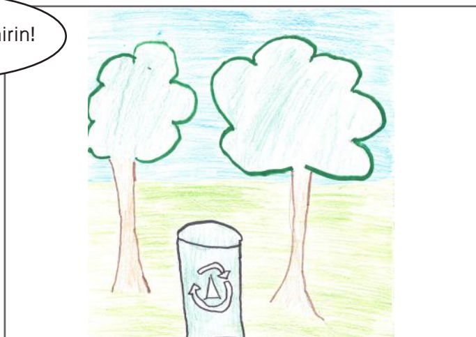
Ne kemi të drejtë të jetojmë në një ambient të pastër