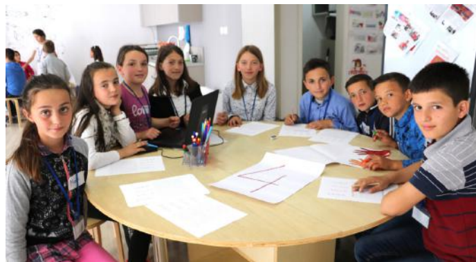
Në demokraci, fuqia i takon popullit