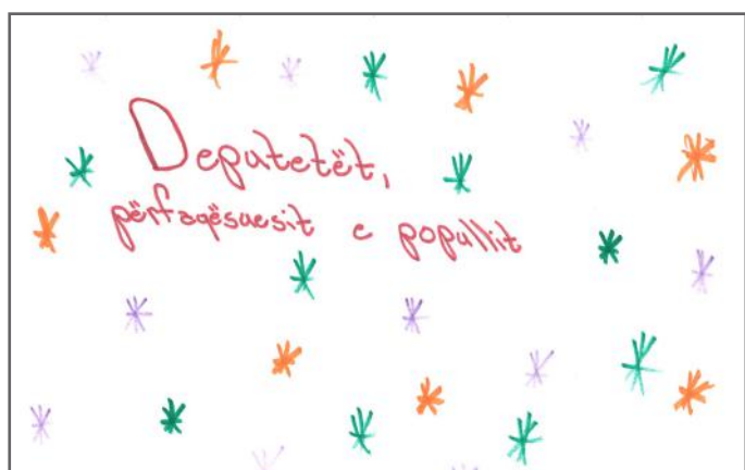
Nëse kandidatët për deputetë marrin shumë vota nga populli, ata do ta përfaqësojnë popullin