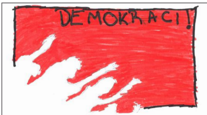
Ne e duam demokracinë

Përveç këtyre që i thamë, në demokraci vlerësohet edhe respektimi i njëri-tjetrit, ndihma që ne u ofrojmë të tjerëve, etj. Në Kosovë, të drejtën që na e mundëson demokracia e përdorim për t'i zgjedhur përfaqësuesit tanë. E kjo ndodh me anë të votave tona. Nga këto çka ne sot mësuam, ndamë me ju disa gjëra, të dashur lexues. Këtu në Punëtorinë për Demokraci „Demos-ti“ mësuam shumëçka për mënyrën e funksionimit të një shteti demokratik. Ne gjithashtu jemi ndjerë si në shtëpinë tonë, duke u shprehur lirshëm dhe duke u ndier të dashur. Pikërisht ashtu siç edhe e don demokracia.