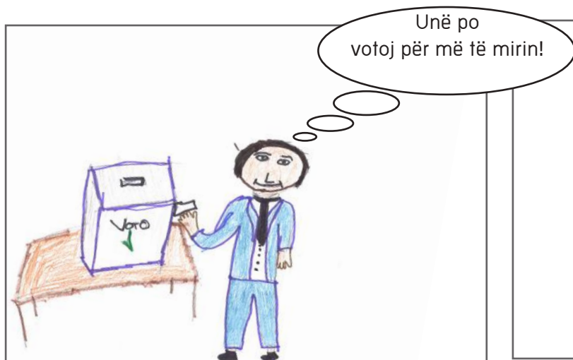
Kur të mbushim 18 vjet do të votojmë edhe ne!