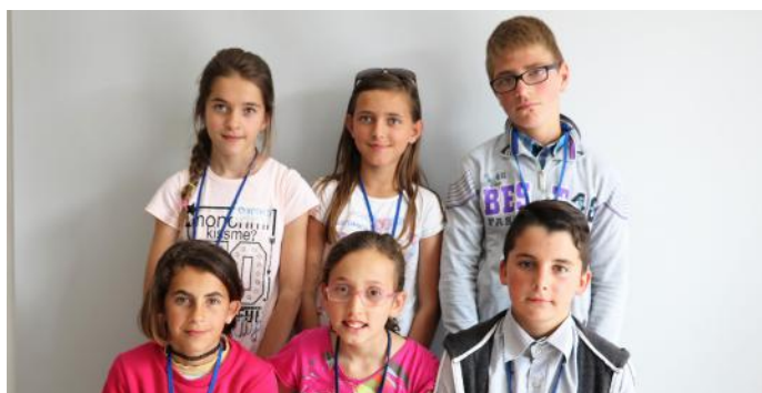
Demokratët e së ardhmes