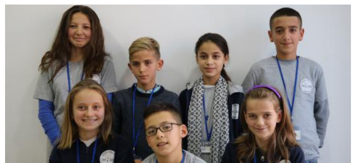
Gazetarët e artikullit

Ne i porosisim të gjithë lexuesit që t'i trajtojmë të gjithë në mënyrë të njëjtë. Të gjithë duhet të kemi mirëkuptim në mes vete, sepse vetëm kështu ne do të jemi një popull i suksesshëm dhe i lumtur.