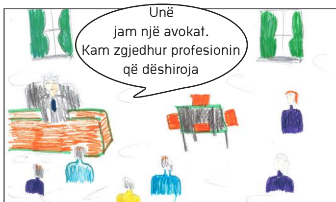
Ligji për të drejtat tona