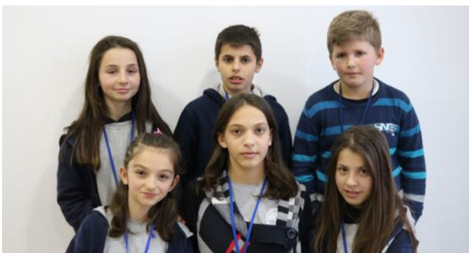
Gazetarët, autorë të artikullit

Ne mendojmë se pushteti duhet të ndahet, njëjtë sikurse ne ndajmë punët në mes vete. Në këtë mënyrë, këto institucione e kanë më të lehtë të kryejnë punët. Punët, poashtu kryhen shumë më shpejt, sesa nëse ato do të ishin përgjegjësi e një institucioni të vetëm.