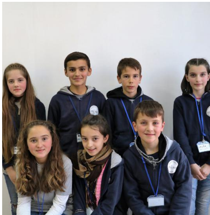
Grupi i cili ka shkruar artikullin

Përveç këtij funksioni, ky institucion ka edhe dy funksione të tjera. Ato janë: funksioni përfaqësues, sepse aty janë 120 deputetë të cilët na përfaqësojnë neve, ku 20 prej tyre janë prej komuniteteve jo shumicë. Si dhe funksioni kontrollues, sepse kontrollon Qeverinë. Gjatë mbledhjeve plenare të Kuvendit marrin pjesë: Kryetari i Kuvendit, nënkryetarët e Kuvendit dhe deputetët. Gjithashtu, në Kuvend janë disa grupe punuese që ndryshe quhen komisione parlamentare. Shpresojmë që ju do të kënaqeni duke lexuar artikullin tonë, si dhe do të merrni disa informata rreth Kuvendit.