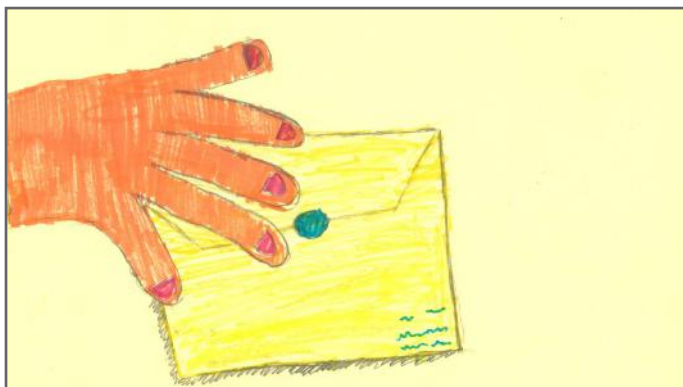
Këtu kemi vizatuar një dorë me një votë

Pra, të gjithë këta qytetarë që votojnë, natyrisht se janë mbi moshën 18 vjeçare, sepse vetëm kur të arrijmë këtë moshë kemi të drejtë të votojmë. Në një të ardhme të afërt, edhe ne do të gëzojmë të drejtën e votës, po ashtu edhe të drejtën për t'u kandiduar. Kjo është e drejta jonë dhe ne duhet ta shfrytëzojmë atë.