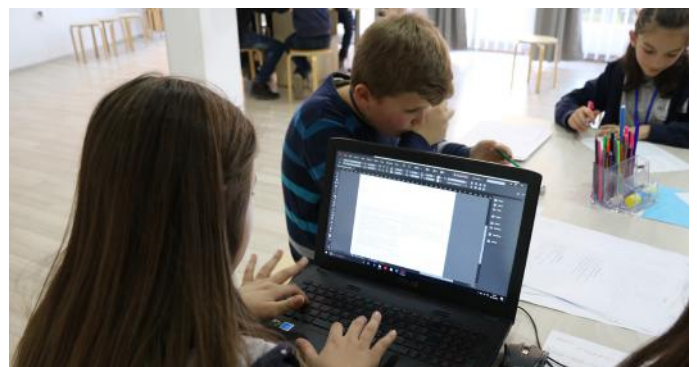
Artikulli ynë duke u shkruar