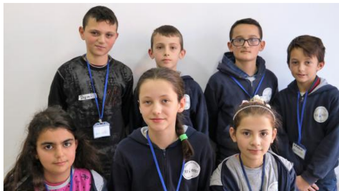
Autorët e artikullit