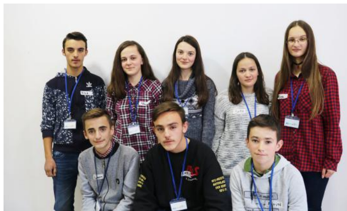
Grupi i parë