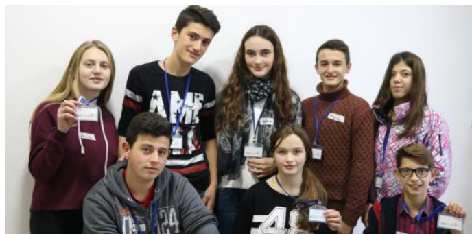
Autorët e artikullit

të tyre. Demokracia e drejtpërdrejtë, ndryshe nga ajo përfaqësuese, kryhet përmes formave të ndryshme si peticione ose referendume, ku populli me formimin e peticioneve dhe referendumeve kërkon atë që i duket më e drejtë në formimin dhe zhvillimin e vendit të tyre. Dallojmë po ashtu dy sisteme të demokracisë përfaqësuese: sistemi parlamentar dhe ai presidencial. Në vendin tonë, pra në Kosovë kemi sistemin parlamentar. Parlamenti ose Kuvendi ynë përbëhet nga 120 deputetë, ku 100 prej tyre përfaqësojnë popullin shumicë, kurse 20 të tjerë përfaqësojnë ata jo shumicë siç janë romët, ashkalinjtë, egjiptianët, boshnjakët, serbët, turqit si dhe goranët. Pra, nga gjithë kjo çfarë shënuam, na bën të kuptojmë që në ditët e sotme nuk ka vend për jo tolerancë, pa barazi e jo solidaritet e kufizim të lirisë së njerëzve. Të gjithë duhet të jemi të barabartë!