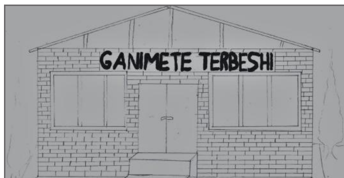
Shkolla jonë nënkupton të drejtën e shkollimit

respektuar së pari rregullat dhe ligjet. Qytetar aktiv është ai i cili merr pjesë në organizata të ndryshme, në aktivitete të ndryshme, ai i cili mbron ambientin, si dhe kryen obligimin e tij qytetar siç është e drejta e votës. Por, një qytetar aktiv në Kosovë ka të drejta dhe përgjegjësi të cilat duhet t'i respektoj.