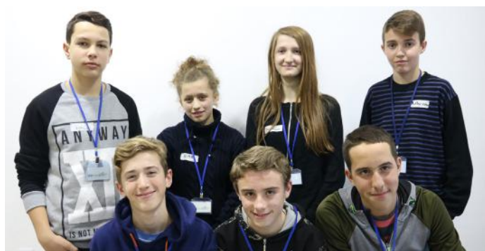
Autorët e artikullit

Ne kemi të drejtë të votojmë, të shkollohemi, të luajmë. Të drejtat të cilat na i mundëson shteti ynë, ne nuk duhet t'i keqpërdorim. Të drejtat dhe përgjegjësitë dallohen nga njëra-tjera në forma të ndryshme. Ne