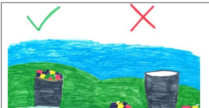
Si duhet vepruar dhe si nuk duhet vepruar me mbeturinat

nuk duhet të ngasim veturën nëse nuk e kemi moshën e duhur për ngasje. Ne duhet të respektojmë njerëzit me nevoja të veçanta, të moshuarit dhe shkollën. Ne duhet të votojmë kryetarin e duhur, e jo atë që nuk kujdeset për shtetin e vet. Ndërsa, si fëmijë ne kemi përgjegjësi të përfundojmë shkollën, të ndihmojmë fëmijët të cilët nuk kanë veshmbathje dhe ushqim. Pra, ne duhet të jemi aktiv në lagjen, shkollën, qytetin dhe shtetin tonë.