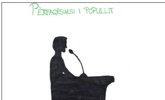
Fjalimi i një deputeti

Populli zgjedh deputetët, ndërsa deputetët përfaqësojnë popullin.