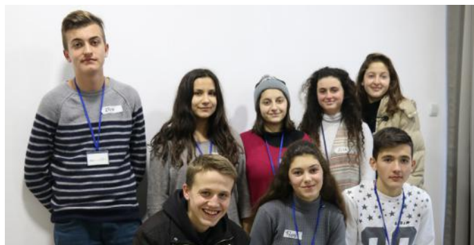
Grupi i gazetarëve të demokracisë