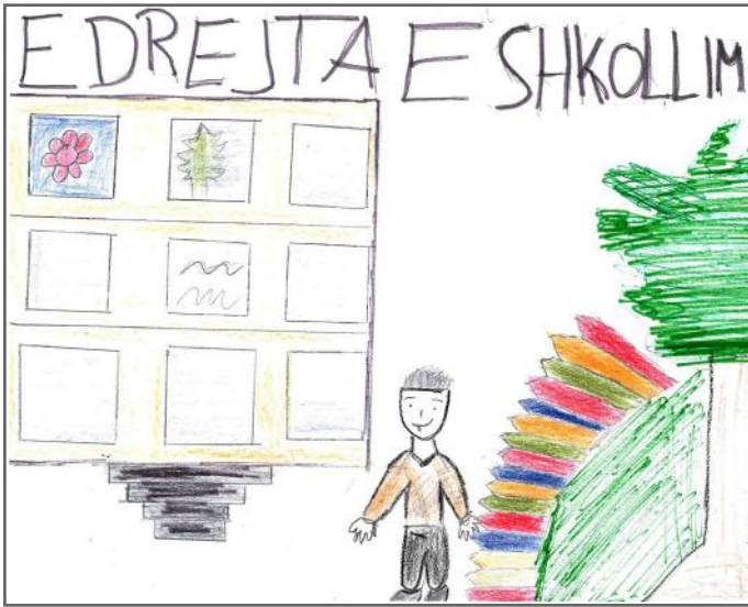
Të gjithë e kemi të drejtën e shkollimit