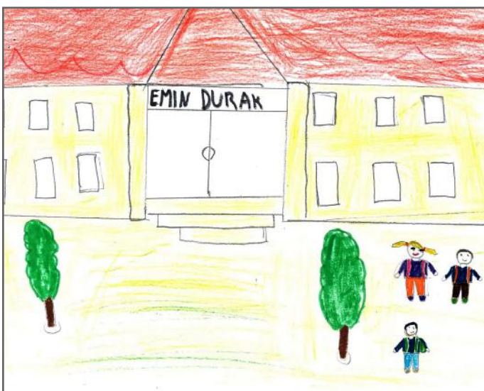
Shkolla jonë, vendi ku mësojmë shumë gjëra