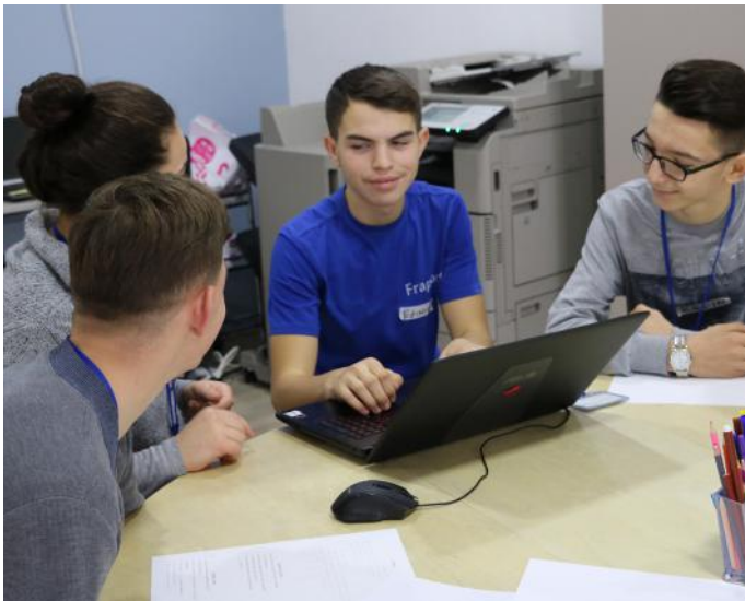
Ne bashkëpunojmë me njëri-tjetrin