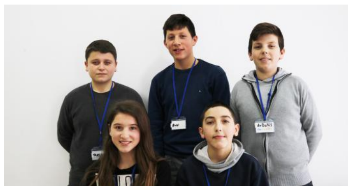
Autorët e artikullit

sideroheshin të pasur. Fatkeqësisht pleqtë, gratë dhe personat me gjendje të dobët ekonomike nuk kishin të drejtë të votonin. Kurse sot, të gjithë jemi të barabartë para ligjit si dhe në mes vete. Demokracia ndahet në dy lloje kryesore: demokracinë e drejtpërdrejtë dhe demokracinë përfaqësuese. Demokracia e drejtpërdrejtë është kur populli mbledhet dhe zgjedh përfaqësuesit aty për aty. Ndërsa, demokracia përfaqësuese është kur populli me anë të votës i zgjedh përfaqësuesit. Mirëpo, edhe demokracia përfaqësuese ndahet në dy sisteme: sistemin presidencial dhe atë parlamentar. Sistemi parlamentar funksionon në vendin tonë, ku Parlamenti apo Kuvendi ka më shumë kompetenca se Presidenti. Në sistemin presidencial Presidenti ka më shumë kompetenca sesa Parlamenti, siç ndodh në SHBA. Ne kemi një porosi për të gjithë moshatarët tanë: konsideroni shokët/shoqet të barabartë dhe mos ofendoni askënd, por jeni tolerantë.