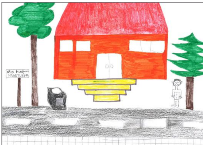
Ne kemi përgjegjësi ta mbajmë ambientin pastër