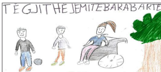
Të gjithë jemi të barabartë pa asnjë dallim

Ne kemi një mesazh për bashkëqytetarët tanë që nëse ata dëshirojnë të jenë më të shëndetshëm, duhet që ta ruajnë dhe të kujdesen për mjedisin.