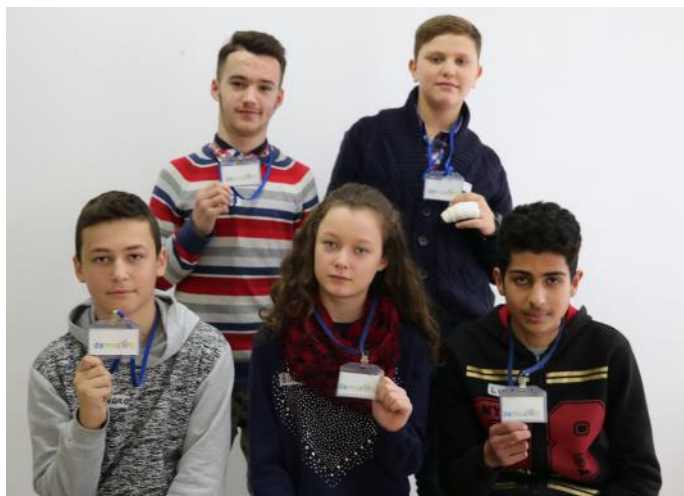
Qytetarë të Kosovës