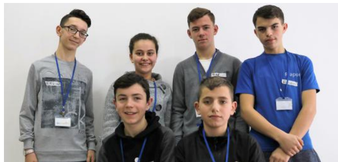
Gazetarët e këtij artikulli