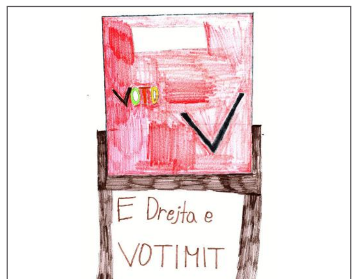
E drejta e votës, e drejtë shumë e rëndësishme