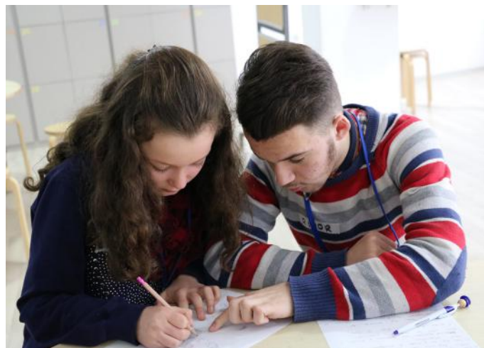
Ne kemi përgjegjësi ta ndihmojmë njëritjetrit