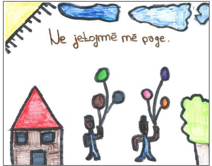
Paqja arrihet me tolerancë dhe mirëkuptim