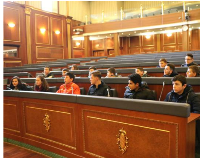
Vizita jonë në Kuvendin e Republikës së Kosovës