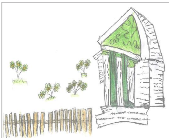
Institucioni i Gjykatës Themelore