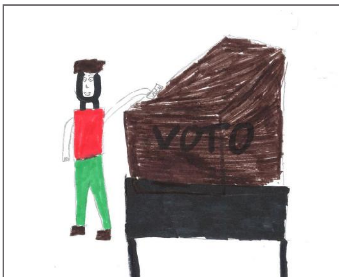
E drejta e votës së fshehtë