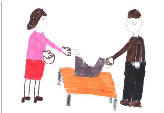
Unë kam të drejtë të votoj pavarësisht gjinisë sime