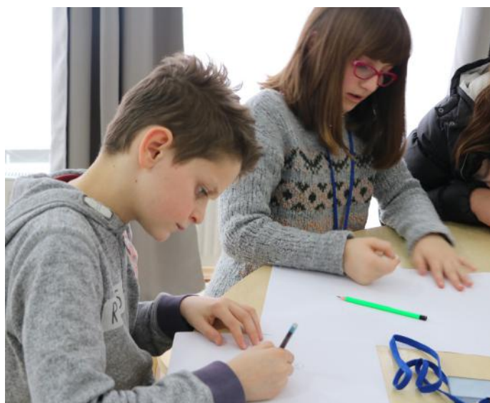
Puna na bën të jemi më të zhvilluar në çdo aspekt