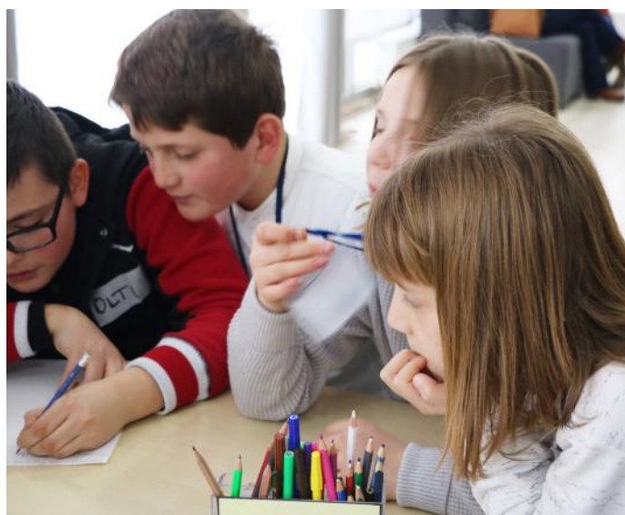
Interesimi ynë për të marrë më shumë informacione