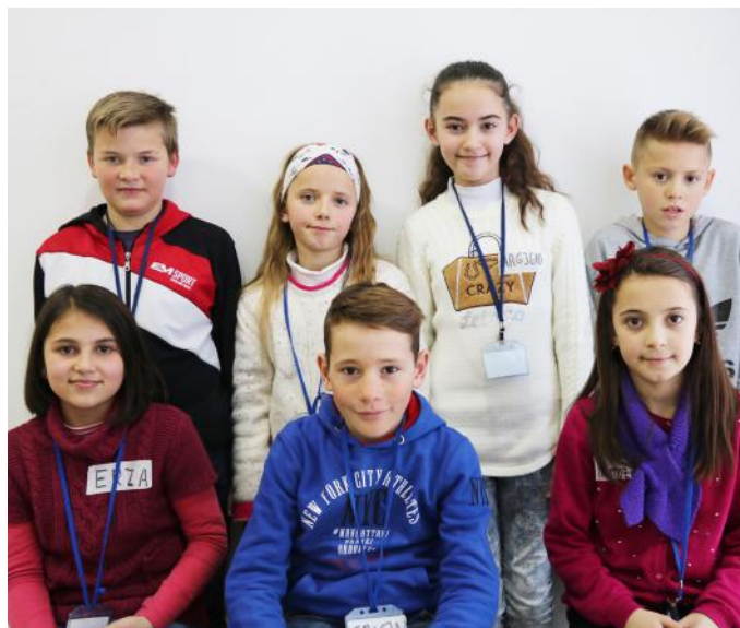
Autorët e artikullit

Ne si fëmijë që jemi, bëjmë zgjedhje në jetën e përditshme. Ne së bashku me mësuesen zgjedhim lëndët mësimore, të cilat duam t'i mbajmë në orët e para. Ne po ashtu zgjedhim kryesinë e klasës, shokët apo shoqet, ushqimin që na pëlqen etj. Mirëpo, kur të mbushim moshën 18 vjeçare mund të marrim pjesë në procesin zgjedhor. Pra, do të jemi pjesë e rëndësishme e një procesi vendimmarrës për vendin tonë. Në këtë proces, ne do t'i zgjedhim udhëheqësit ose përfaqësuesit tonë. Prandaj, duhet të kemi kujdes se kë e votojmë. Në Kosovë kemi dy lloje të zgjedhjeve: lokale (komunale) ku e zgjedhim kryetarin e komunës, si dhe zgjedhjet qendrore (parlamentare) ku i zgjedhim deputetët. Ne të gjithë duhet të votojmë, sepse ne bëjmë ndryshimin. Ne do të jemi pjesë e zgjedhjeve.