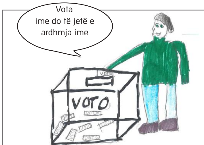
Të gjithë duhet të votojmë