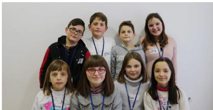
Autorët e artikullit

Ne mendojmë se nëse nuk iu tregojmë prejardhjen e demokracisë, artikulli ynë do të dukej paksa i mangët, prandaj shpresojmë se lexuesit tanë do të marrin informata të reja mbi demokracinë.