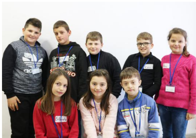
Gazetarët e Kuvendit të Kosovës

Në Kosovë, kemi tri lloje të gjykatave: Gjykatat Themelore, që gjenden në çdo komunë të Kosovës, Gjykata e Apelit dhe Gjykata Supreme që gjenden në kryeqytetin e Kosovës, pra në Prishtinë. Ne nxënësit e klasës V-5, sot kemi për ta vizituar Kuvendin e Kosovës, ku do të mësojmë më shumë për punën që e bëjnë deputetët dhe detyrat e tyre. Ne urojmë që të gjithë fëmijët e tjerë sikurse ne, të kenë mundësi ta vizitojnë Kuvendin e Republikës së Kosovës.