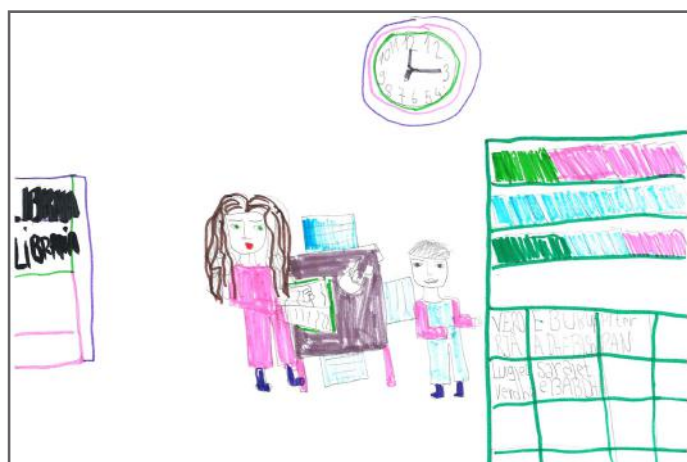
Ne mund të zgjedhim çdo ditë