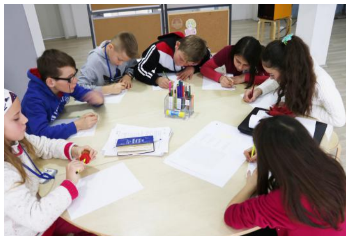
Grupi duke punuar për artikullin