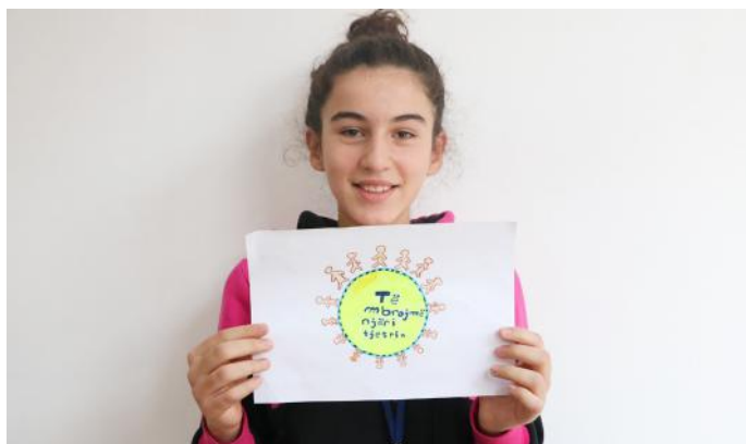
Ne jemi të barabartë dhe mund të mbrohemi