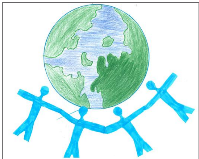
Të lumtur në demokraci, sepse gëzojmë të drejta dhe mund të shprehemi lirshëm