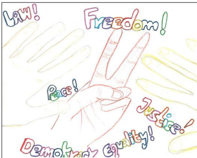
Liria, barazia, drejtësia dhe paqja janë disa nga elementet e demokracisë