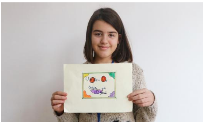
Unë si qytetare, kam të drejta por edhe përgjegjësi