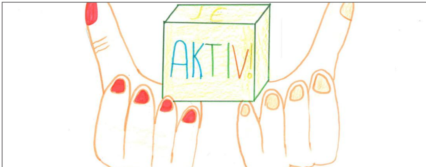
Në demokraci të gjithë jemi të barabartë. Mirëpo, ne kemi përgjegjësi të jemi aktiv për të mirën e vendit tonë.