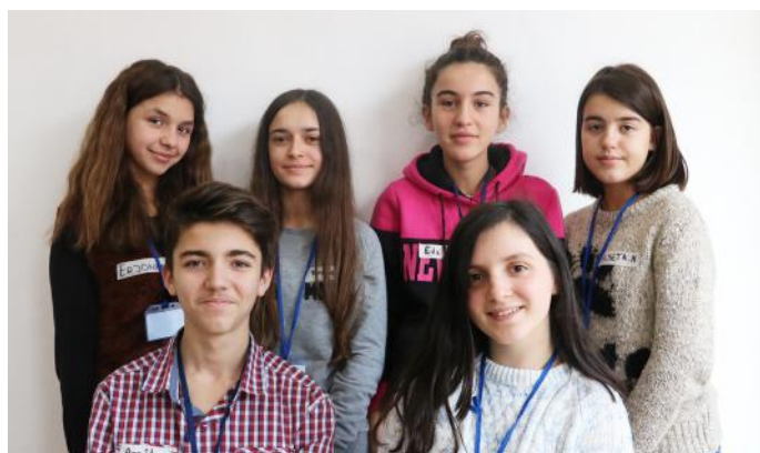
Ne si qytetarë aktiv që jemi