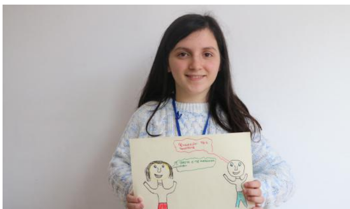
Të mos i diskriminojmë fëmijët

Ndërkaq, përgjegjësi e jona është ta ruajmë ambientin, ta respektojmë ligjin dhe njëri-tjetrin, të mos kemi diskriminime ndaj njëri-tjetrit. Pjesëmarrja në OJQ, iniciativat për vetëdijësim, protestat si dhe pjesëmarrja në shoqata të ndryshme të shquajnë si qytetar aktiv. Porosia jonë është: bëhu qytetar aktiv dhe ndihmo për zhvillimin e vendit tënd.