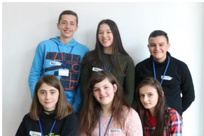
Ne punojmë për demokraci të mirëfilltë

Demokracia është kur ne qytetarët vendosim për vendin tonë, prandaj vëreni guximin ta mposht forcën. Jeta është e mirë me gjërat që i ka. Të punojmë për ato gjëra që sot i kemi, para se njerëzit të qeverisin në atë mënyrë që është e padrejtë për qytetarët e vendit tonë. Qytetarë, demokracia sot është njëra ndër gjërat e rëndësishme. Demokracia ju ndihmon që të arrini gjërat që i dëshironi, prandaj mos e humbisni atë!