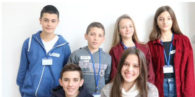
Grupi i demokratëve