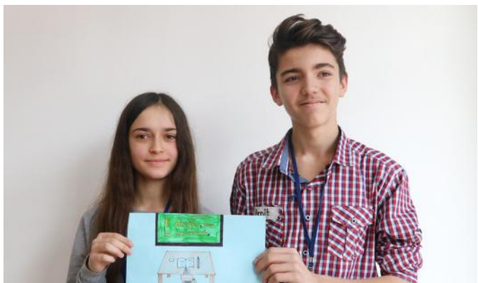
E drejtë e jona është arsimimi dhe edukimi