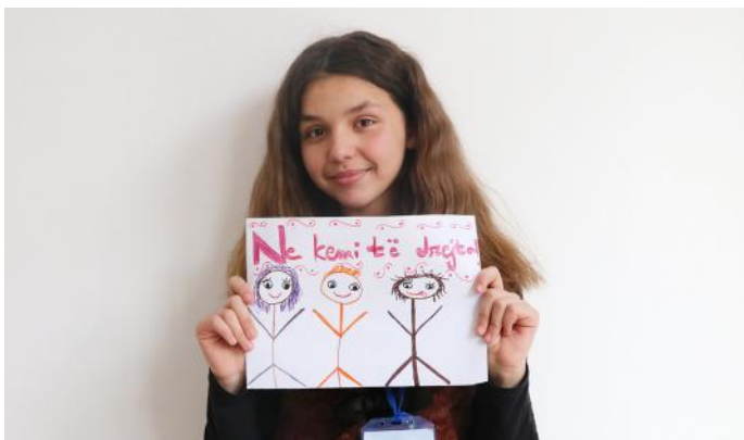
T'i respektojmë të drejtat e njëri-tjetrit