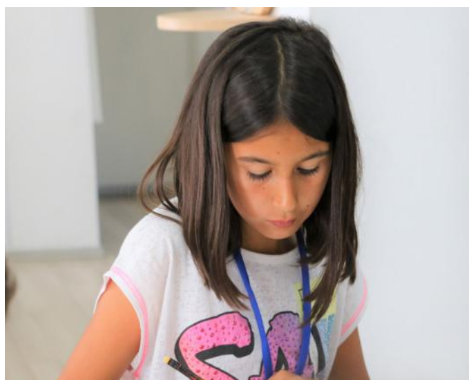
Erza duke vizatuar