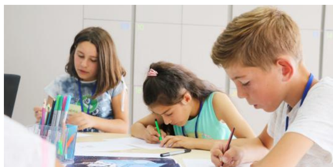
Puna në grup