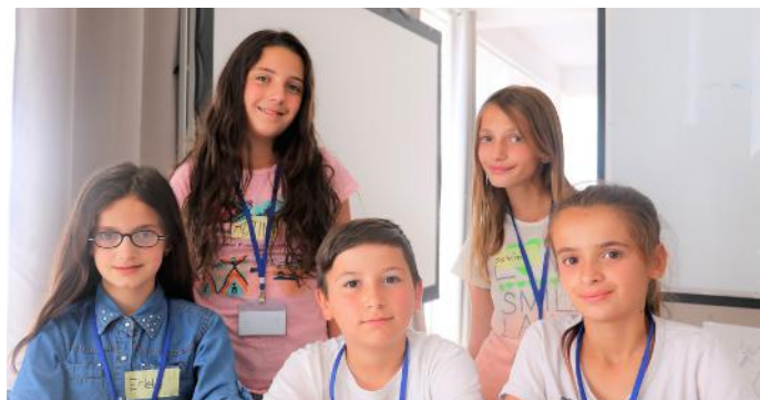
Në të ardhmen duam të jemi kandidatë për deputetë dhe duam që populli të jetë i kënaqur me punën tonë

nga kriteret që kandidatët duhet t'i plotësojnë janë: të jenë qytetarë të atij shteti që kanë kandiduar për deputetë, të jenë mbi moshën 18 vjeçare, të mos kenë kryer vepra penale, etj. Sot, kur i diskutuam këto parime dhe kritere që duhet t'i kenë përfaqësuesit e vendit, menduam se në të ardhmen mund të jemi edhe ne në rolin e përfaqësuesve. Besojmë se të gjitha parimet dhe kriteret do t'i zbatonim me shumë përgjegjësi. Pra, demokracia të jep lirinë të zgjedhësh dhe të kandidosh për t'u zgjedhur si përfaqësues. E tërë kjo është