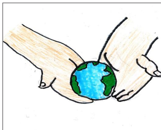
Bota është në duart tona