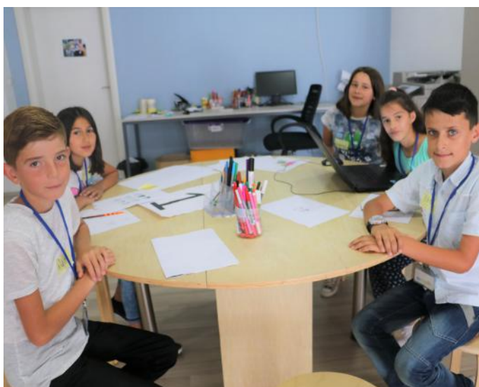
Detyrat e ndara në grup, na bënë më të përgjegjshëm