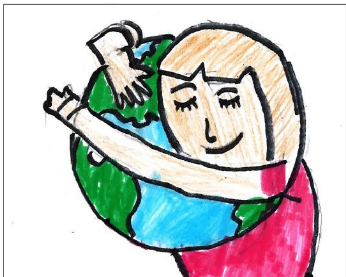
E duam planetin tonë, prandaj kujdesemi për të