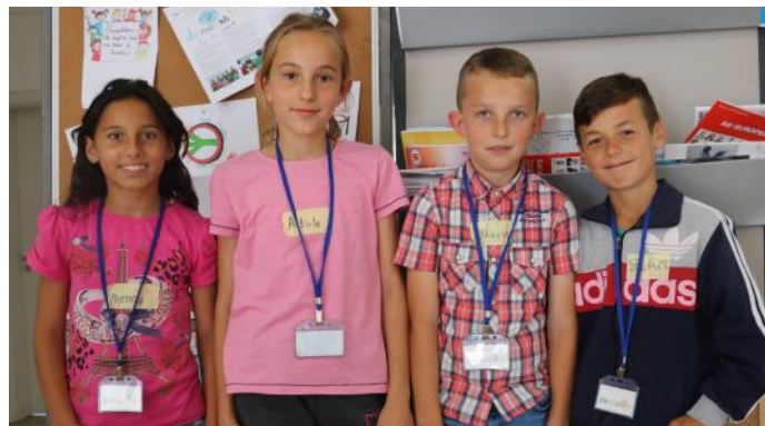
Grupi „Piktorët e Demokracisë“

deputetët si përfaqësues. Në Kuvendin e Republikës së Kosovës janë gjithsej 120 deputetë. 100 prej tyre, janë të kombit shqiptar dhe 20 të tjerë të komuniteteve jo shumicë (romë, ashkalinjë, egjiptianë, boshnjakë, serbë, turq dhe goranë). Meqenëse në Kuvend vendoset për ligjet, Kuvendi ka funksion legjislativ. Përveç këtij funksioni, Kuvendi ka edhe dy funksione të tjera, të cilat janë: funksioni kontrollues, sepse mbikëqyr punën e Qeverisë, si dhe funksioni përfaqësues, sepse deputetët që punojnë aty e përfaqësojnë popullin. Ata marrin vendime në emrin tonë. Ne mendojmë se demokracia është forma më e mirë e qeverisjes. Pasi që në demokraci udhëheqim ne si popull, të gjithë duhet të jemi të përgjegjshëm për veprimet tona. Kështu, së bashku e ndërtojmë një demokraci të mirë.