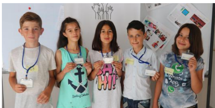
Autorët e artikullit

Kosova ka demokraci përfaqësuese, me sistem parlamentar. Ne qytetarët e Kosovës, i zgjedhim përfaqësuesit tanë, të cilët janë deputetët. Sistem tjetër i demokracisë përfaqësuese është ai presidencial, ku Presidentin e zgjedh direkt populli, e jo përmes deputetëve. Demokracia na ofron mundësinë që ne si qytetarë t'i zgjedhim deputetët, të cilët na përfaqësojnë neve në Kuvendin e Kosovës. Për këtë temë mund të lexoni në artikullin e përgatitur nga grupi tjetër.