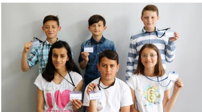
Sot qytetarë aktiv, e nesër deputetë

Marrim shembull, nëse në Kuvendin e Kosovës do të ishte propozuar një projektligj, që ka të bëjë me sigurimin e ushqimit të shëndetshëm pa pagesë për nxënësit e të gjitha shkollave të Kosovës, që nga klasa e I e deri tek ajo e IX. Kjo do të ishte një mundësi e mirë për të gjithë ne, sepse çdo fëmijë ka të drejtën e ushqimit. Funksion tjetër është ai përfaqësues, ku deputetët me mbështetjen e qytetarëve dhe me votat e tyre, marrin titullin e deputetit apo të përfaqësuesit të popullit. Funksioni kontrollues është gjithashtu një funksion shumë i rëndësishëm, që ka të bëjë me kontrollimin e punës të cilën e bën Qeveria. Pikërisht, deputetët janë ata të cilët e zgjedhin kryesuesin e këtij institucioni, pra Kryeministrin. Ne qytetarët, duhet të vetëdijësohemi dhe të kuptojmë rëndësinë tonë në shtetin tonë. Po të mos ishte populli për të votuar, nuk do të ishin as deputetët ata që e udhëheqin shtetin.