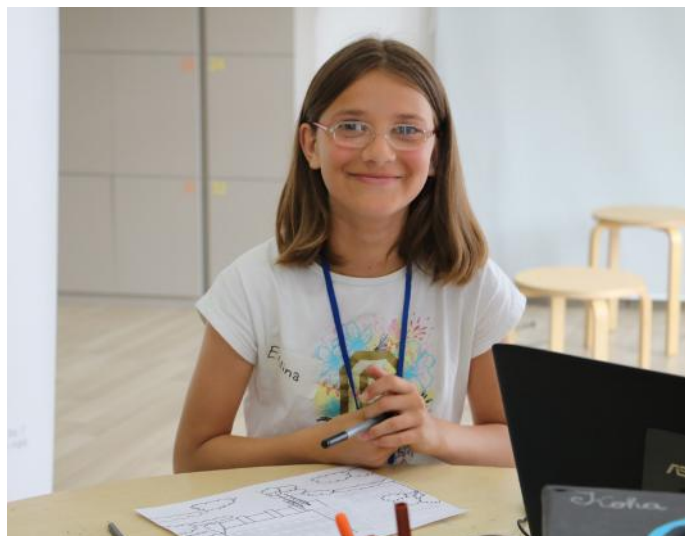
Ebrlina, sikurse të gjithë shokët e shoqet e klasës së saj, është e lumur që ishte pjesë e „Demos-ti“