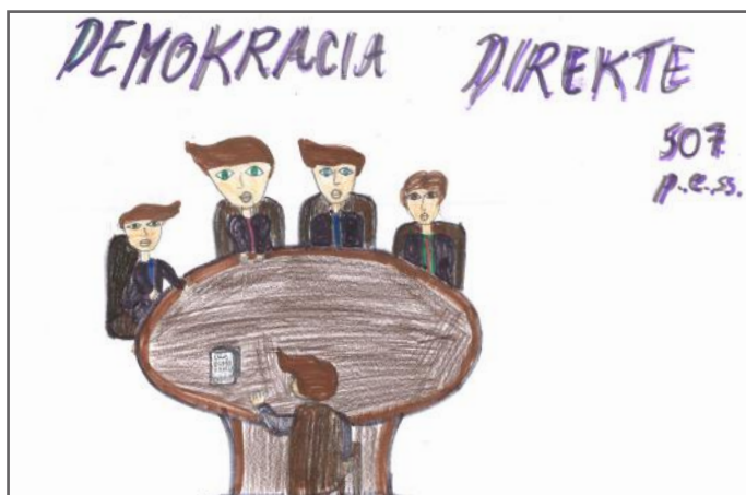
Kjo është forma e parë dhe më e vjetër e demokracisë

Ata votojnë kandidatët për deputetë, mandati i të cilëve zgjat për 4 vjet. Nëse nuk na pëlqen puna e ndonjë deputeti, në zgjedhjet e ardhshme ne do të votojmë dikë tjetër. Detyra e deputetit është të plotësojë kërkesat e qytetarëve. Në shkollë, kur kemi orë sportive, ne nxënësit votojmë për të zgjedhur kryetarin apo kapitenin e ekipit. Ai punon për grupin e tij. Kapiteni ka përgjegjësi ta udhëheq grupin për vetëm një mandat të caktuar. Ky mandat zgjat një orë. Kur vie ora tjetër, zgjedhim një kapiten tjetër. Ne dëshirojmë që të jemi të barabartë dhe të gjithë të kemi mundësi të njëjta që të bëhemi kapiten dhe të udhëheqim ekipin. Kjo është demokracia për të gjithë qytetarët e Republikës së Kosovës dhe ne jemi të lumtur që jetojmë në demokraci.