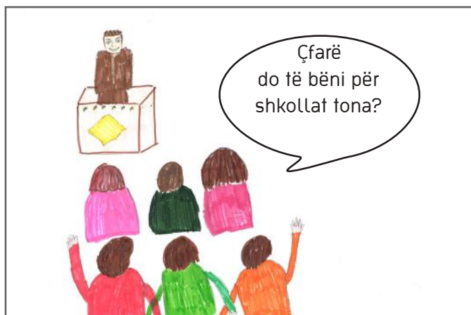
Qytetarët kanë të drejtë të pyesin deputetët e zgjedhur