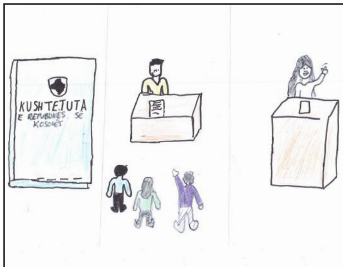
Kushtetuta është shumë e dashur për ne. Falë ligjeve që i kemi ne kemi jetë më të mirë