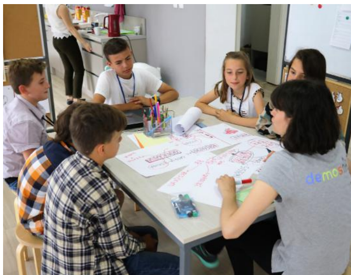
Puna gjatë shkruarjes së artikullit