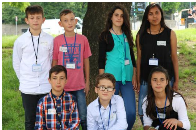
Gazetarët e artikullit të cilët realizuan intervistën

Të gjithë ne bëjmë zgjedhje. Për shembull, zgjedhim ekipin e futbollit që na pëlqen më shumë. Mirëpo, kjo zgjedhje nuk është aq e rëndësishme sa procesi zgjedhor. Zgjedhja e ekipit të preferuar nuk ndikon në progresin e shtetit. Kurse, zgjedhja e përfaqësuesve sigurisht që ndikon. Për ta kuptuar me shumë vlerën e votës, lexojeni se çfarë kanë thënë qytetarët.