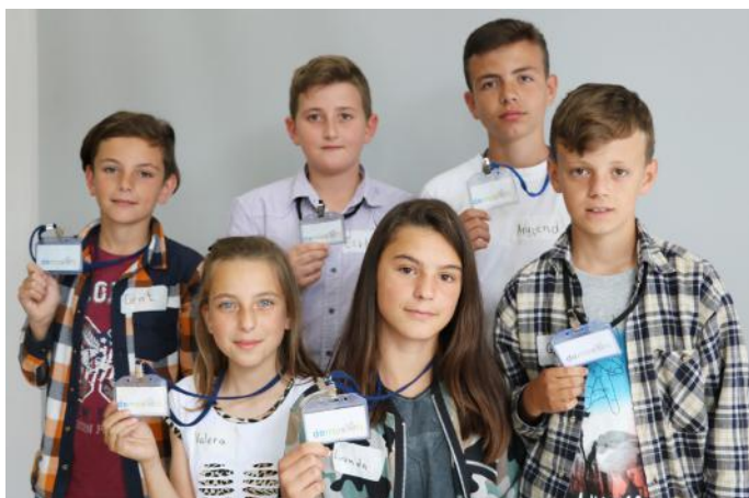
Grupi i tretë në Punëtori