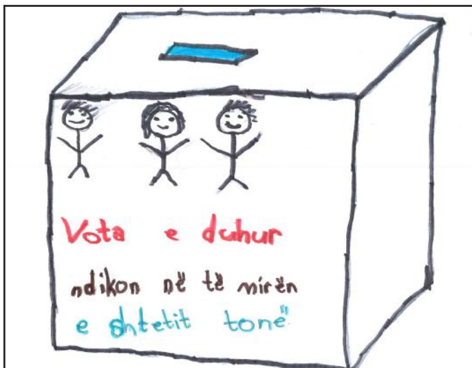
Me 11 qershor, vota e secilit do të luaj rol në vendin tonë. Prandaj, votoni me kujdes