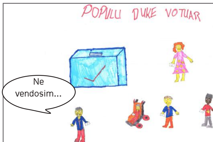
Vota është e rëndësishme në demokracinë përfaqësuese