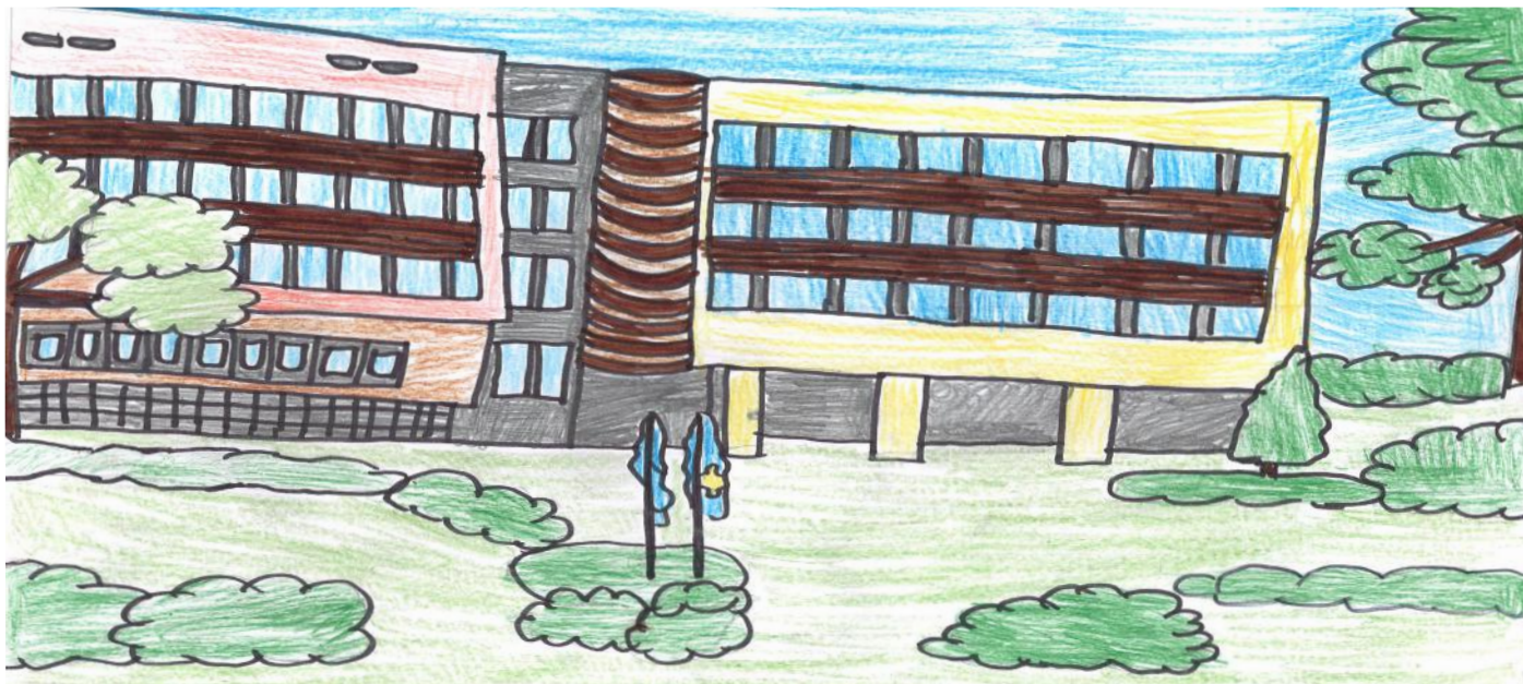
Objekti i Kuvendit të Republikës së Kosovës

GETOAR (12), OLT (12), ERBLINA (11), AULONA (11), ARTOR (11), ALTIN (12)