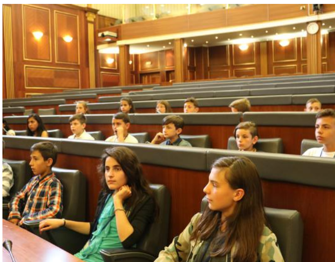
Deputetët e së ardhmes