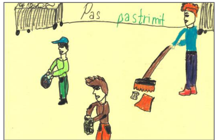
Disa fëmijë duke pastruar ambientin (lagjen)

Ashtu siç e cekëm më lart, në këtë pjesë të artikullit do t'iu informojmë më shumë rreth të drejtave të fëmijëve. Të drejtat e fëmijëve sipas nesh janë një ndër elementet kryesore të demokracisë.