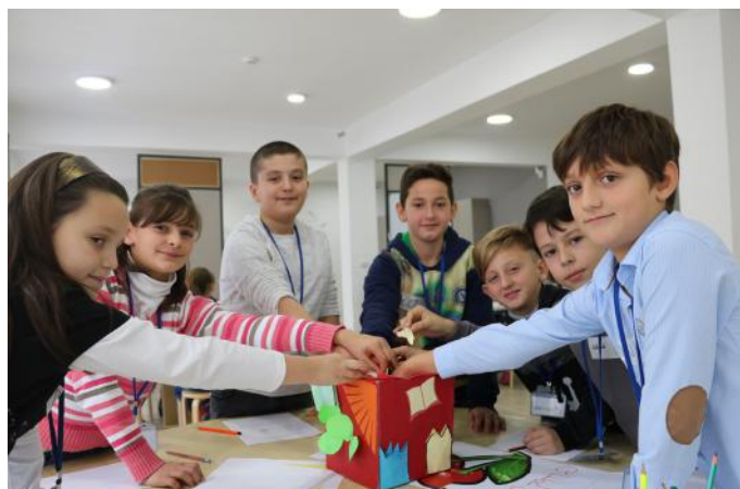
Ne sot votuam dhe zgjedhëm deputetin tonë nga partia „Edukata Fizike“