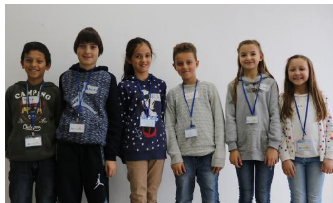
Autorët e artikullit