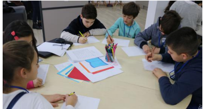
Të gjithë ne jemi qytetarë (fëmijë) aktiv

Për të drejtat e fëmijëve, ju ftojmë të lexoni artikullin më poshtë.