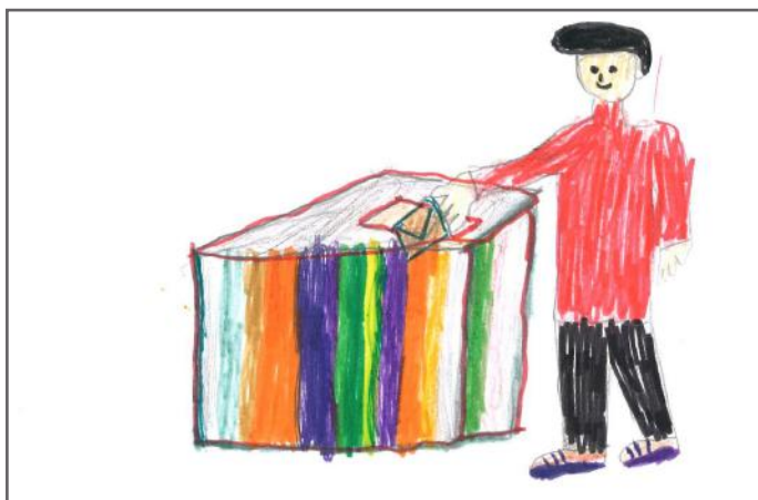
Një votë e jona bën ndryshimin