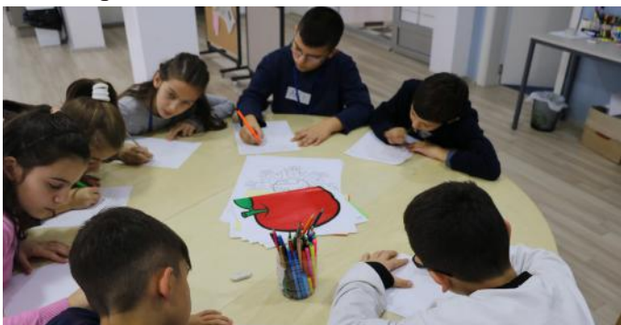
Gazetarët duke punuar

Demokracia është sistem i qeverisjes ku fjalën kryesore e ka populli. Demokracia ka filluar në vitin 507 p.e.s. në Athinë të Greqisë. Demokracia e atëhershme nuk ishte e barabartë për të gjithë. Në këtë demokraci nuk kishin të drejtë të merrnin pjesë në vendime të varfërit, gratë dhe as të moshuarit.