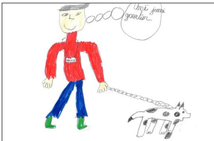
Kur e votojmë përfaqësuesin e duhur, ai na lehtëson jetën dhe na bën të lumtur