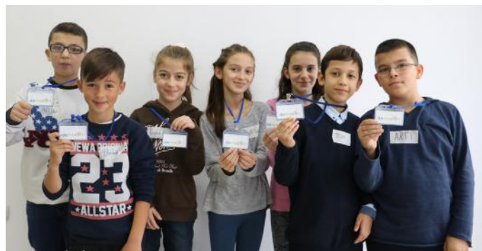
Gazetarët e demokracisë

Demokracia ndahet në demokraci përfaqësuese dhe të drejtpërdrejtë. Demokracia e drejtpërdrejtë është kur populli merr vendime direkt pa ndihmën e përfaqësuesve, kurse demokracia përfaqësuese është kur populli ka të drejtë të merr vendime politike, por përmes përfaqësuesve të tyre, të cilët janë deputetët. Demokracia përfaqësuese ndahet në demokraci parlamentare dhe presidenciale. Shteti i Republikës së Kosovës është formuar me 17 Shkurt më 2008. Kosova është shtet i pavarur dhe demokratik. Ajo ka demokraci parlamentare, ku populli përfaqësohet nga deputetët. Ne mendojmë se Kosova ka demokraci të zhvilluar dhe jemi krenarë që shteti ynë ka pasur një grua Presidente. Kjo tregon se në Kosovë edhe gratë kanë të drejta.