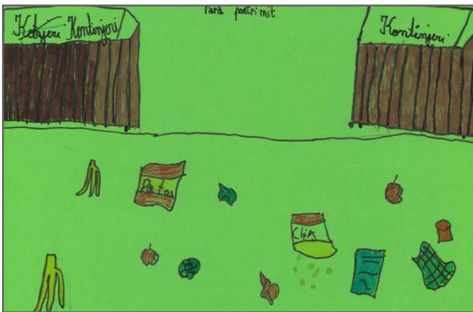
Një lagje para pastrimit

Në vizatimet mëposhtë do të informoheni më shumë rreth asaj se si ne si fëmijë mund të jemi aktiv për vendin tonë