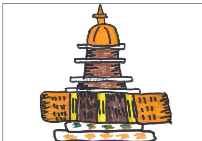
Unë jam Qeveria. Propozoj ligje