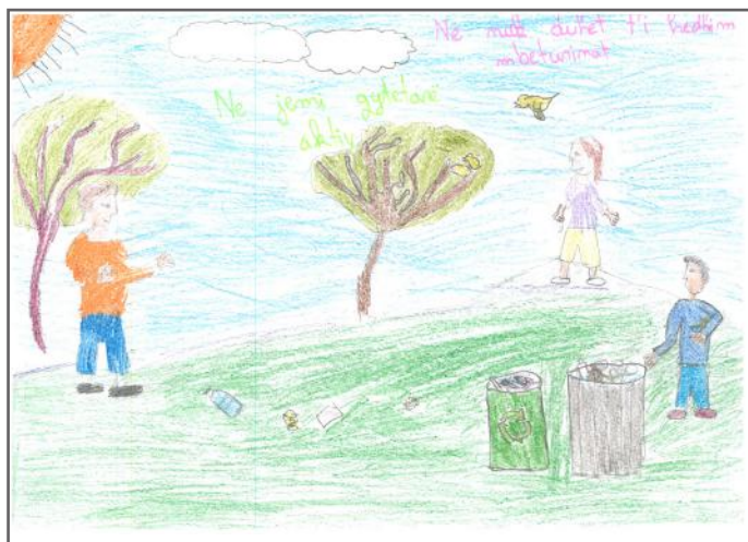
Ne duhet ta ruajmë ambientin e vendit tonë