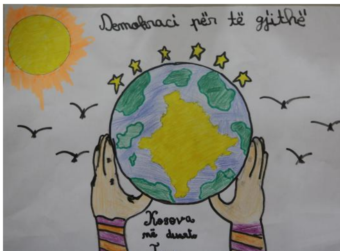
Demokraci për të gjithë