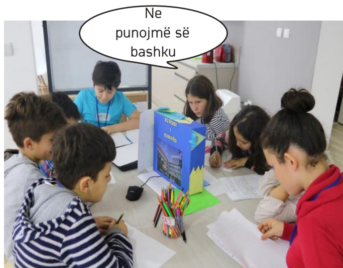
Duke punuar për artikullin tonë