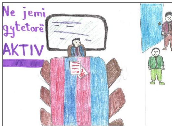
Mbledhja e qytetarëve për një problem të caktuar