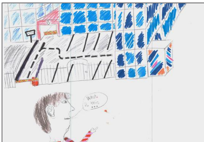
Qytetarët në demokraci