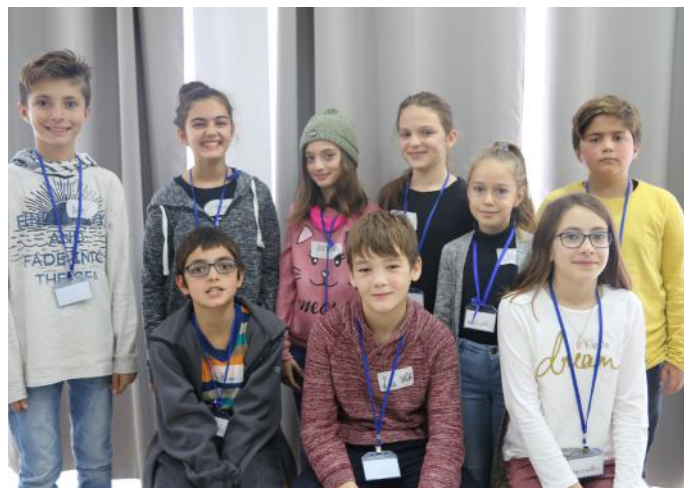
Autorët e artikullit

Ndarja e pushtetit bëhet për arsye që të drejtat të jenë të barabarta. Po ashtu, edhe që të mos ngarkohet vetëm një institucion. Tri pushtetet janë: Pushteti Legjislativ - Kuvendi, Pushteti Ekzekutiv - Qeveria, dhe Pushteti Gjyqësor - Gjykata. Qeveria propozon ligjet. Ndërkaq, Kuvendi i aprovon ato ose jo. Kurse, detyra e gjykatave është të gjykoj qytetarët nëse ata e shkelin ligjin. Në Kosovë kemi tri lloje të gjykatave: Gjykata Supreme, Gjykata Themelore dhe Gjykata e Apelit. Qëllimi i këtyre institucioneve është sigurimi i mirëqenies tonë, pra e popullit. Propozimi ynë është që në të ardhmen të mos ketë konflikte politike, por të mbesim gjithmonë një vend demokratik.