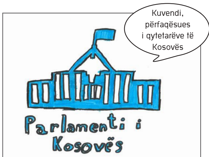
Kuvendi i Republikës së Kosovës

denti i Kosovës, 10.000 qytetarë, si dhe vetë deputetët e Kuvendit të Kosovës. Për miratimin e këtyre ligjeve mbahen mbledhjet, të cilat quhen seanca plenare. Kuvendi i Kosovës kryen tri funksione kryesore. Ato janë: funksioni përfaqësues, funksioni legjislativ dhe funksioni kontrollues. Funksioni përfaqësues do të thotë se deputetët janë përfaqësues të popullit. Funksioni tjetër është ai legjislativ, ku deputetët kanë të drejtë të propozojnë ligje dhe t'i miratojnë ato. Dhe funksioni i tretë është ai i kontrollit, ku Kuvendi mbiqëqyr Qeverinë duke i mbrojtur interesat e qytetarëve. Me plot punë dhe përgjegjësi, ky është Kuvendi i Republikës së Kosovës.