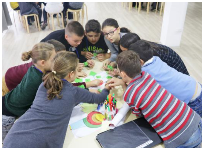
Duke punuar në grup