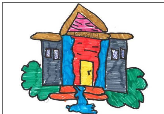
Unë jam Kuvendi. Miratoj ose jo ligjet