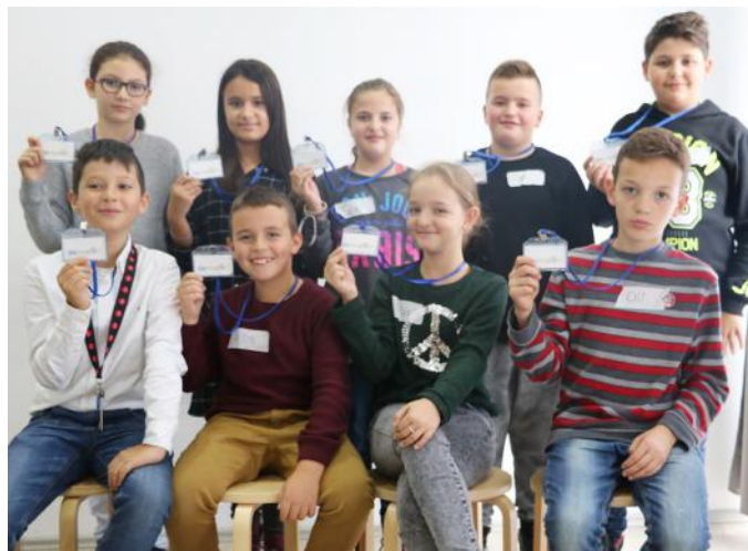
Gazetarët e demokracisë

Qytetarë aktiv mund të jenë qytetarët që bëjnë gjëra të mira për vendin e tyre. Edhe ne mund të jemi qytetarë aktiv duke kontribuar për të mirë në familje, në shkollë, në lagje dhe në shtet.