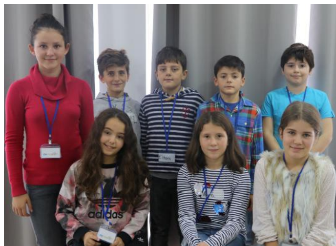
Qytetarët e Kosovës