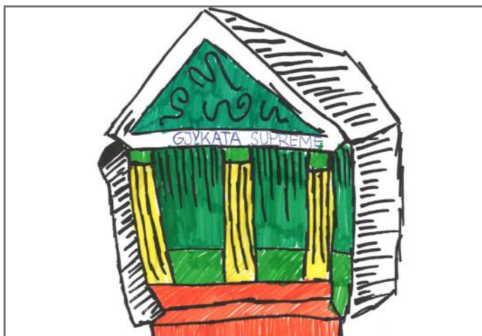
Unë jam Gjykata. Marr vendim për persona që shkelin ligjin