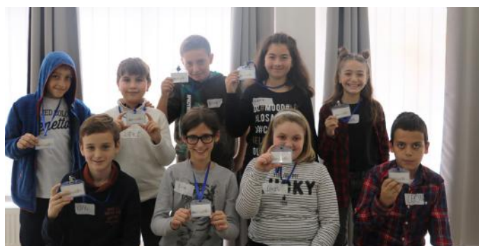
Grupi i specializuar për demokraci