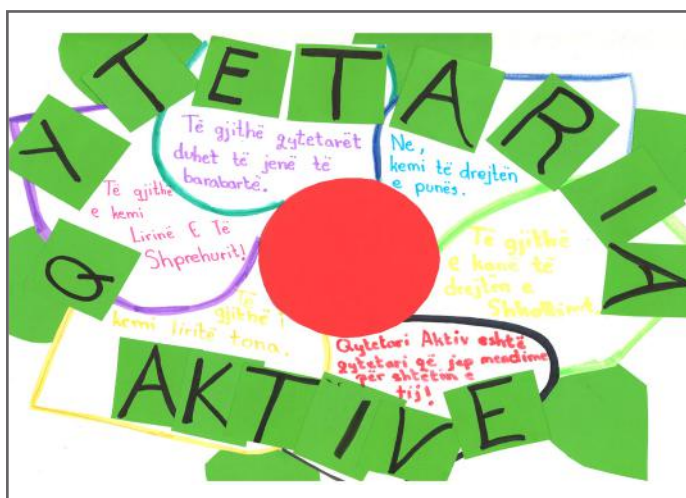
Mësimet tona për qytetarinë aktive