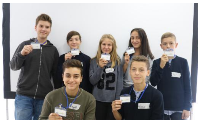
Gazetarët e rinjë