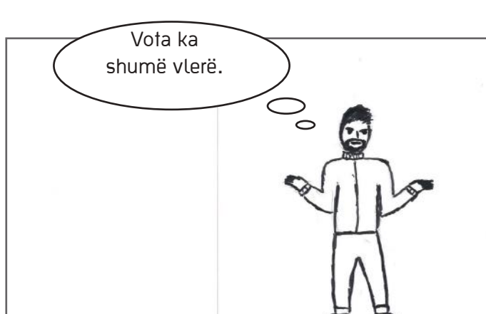
Mendimi i Jonit