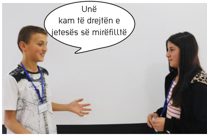
Jeta në demokraci