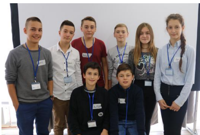
Ne si qytetarë i kryejmë obligimet tona