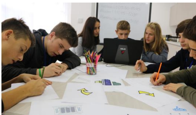
Gazetarët duke punuar