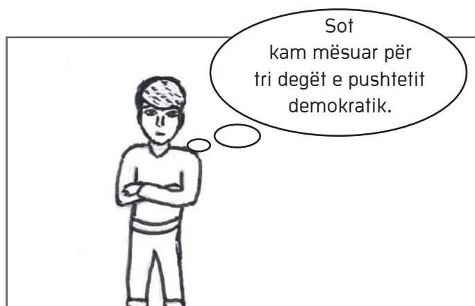
Mendimi i Veronit