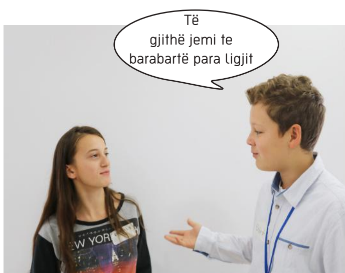
Barazia racore dhe fetare