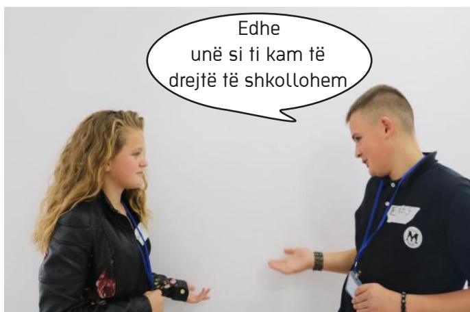
E drejta e shkollimit