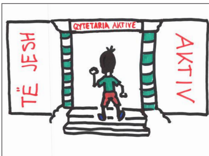
Të jesh aktiv në komunitet