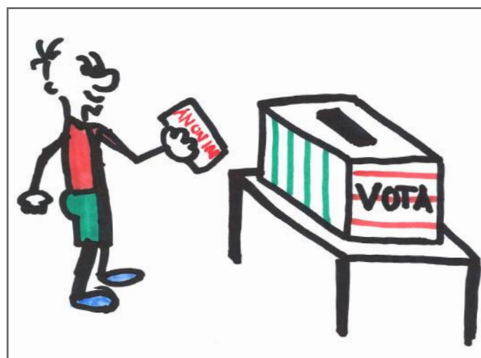
Përgjegjësia e qytetarit