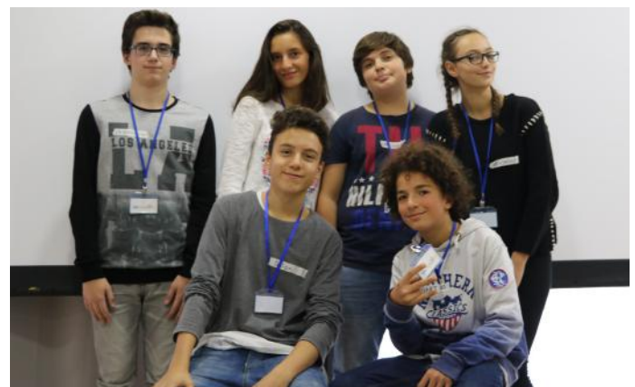
Të bashkuar për një të ardhme