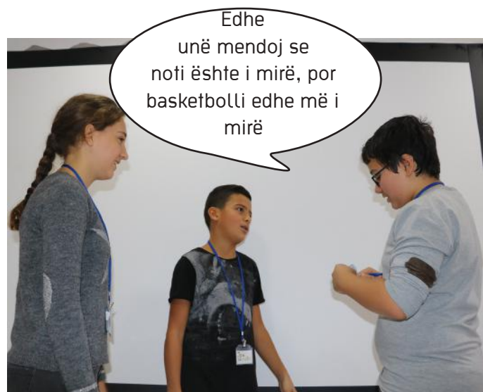
Shprehja e lirë e mendimit