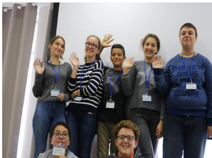
Të lumtur në demokraci

Më pas, i mblodhëm të gjitha mendimet rreth demokracisë dhe qytetarisë aktive, që përfshinin përgjegjësitë dhe të drejtat e çdo qytetari të cilat janë: e drejta për votë, e drejta për fjalën e lirë, e drejta për punë, e drejta për arsim, e drejta për të pasur familje dhe shumë e shumë të drejta të tjera. Ne si qytetarë aktiv duhet të kryejmë obligimet dhe përgjegjësitë tona në mënyrë që vendi ynë të ecë çdo ditë e më shumë.