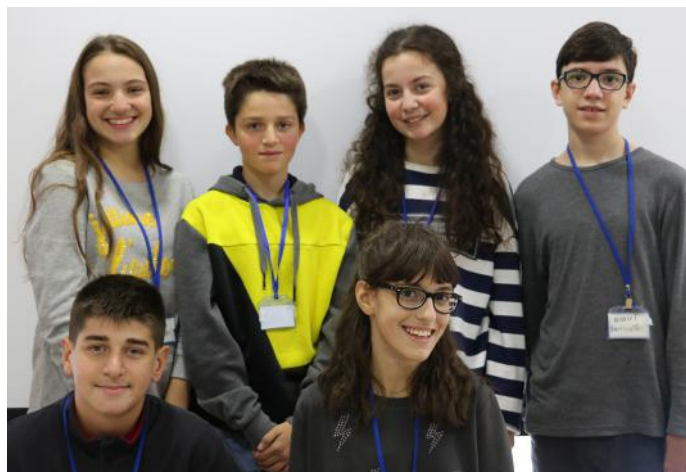
E ardhmja e qytetit