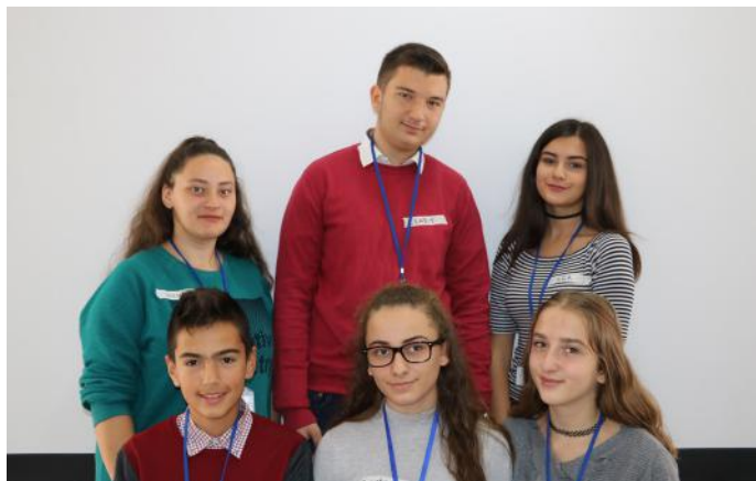
Krijuesit e artikullit

Ta mirëmbajmë ambientin tonë të dashur, shtëpinë dhe me të gjithë anëtarët të jemi të afërt, ndihmë dhënës në mënyrë që edhe ata të jenë qytetarë të ndershëm dhe aktiv.