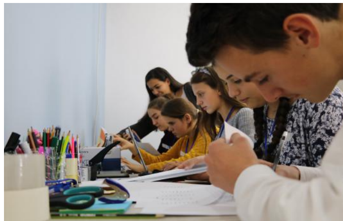
Qytetarët duke punuar në fabrikën e premtuar