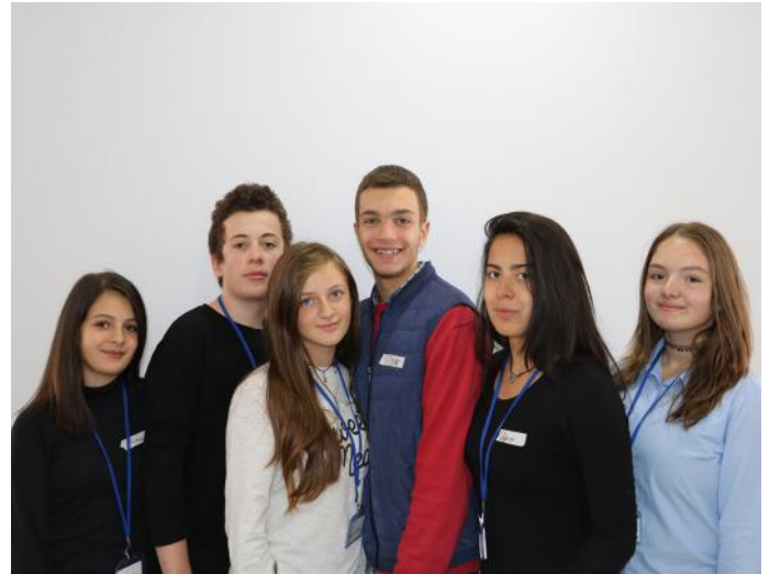
Grupi që bëri këtë artikull

Që të funksionojë demokracia në një shtet duhet të ketë disa themele të cilat e formojnë atë. Një ndër shtyllat kryesore që e formon atë është shkollimi sepse pa të nuk ka vlerë demokracia. Ne si qytetarë dhe individ aktiv, duhet të jemi të sinqertë dhe t'i kalojmë barrierat të cilat eliminohen me punën tonë. Ligji është i barabartë për të gjithë qytetarët e Kosovës! E disa nga funksionet themelore të qytetarëve janë mbizotërimi i barazive të llojllojshme pa dallim kombi, race apo feje, sepse në realitet ne të gjithë jemi të barabartë dhe e gëzojmë të drejtën e lirisë e të të shprehurit. Vetëm kështu mund të kemi një të ardhme demokratike. Që e ardhmja të jetë fitimprurëse duhet të ketë vetëbesim!