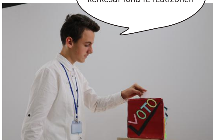
Qytetari duke votuar

Po votoj, me shpresën që kërkesat tona të realizohen