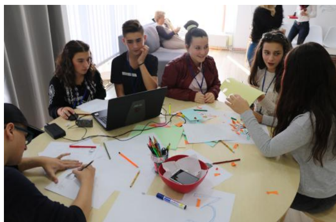
Nxënësit duke punuar