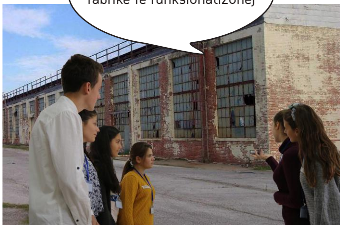
Dëshira e qytetarëve

Sa mirë do të ishte që kjo fabrikë të funksionalizohej