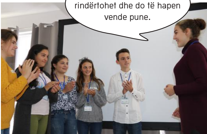
Deputetja e zgjedhur

Kjo fabrikë do të rindërtohet dhe do të hapen vende pune.