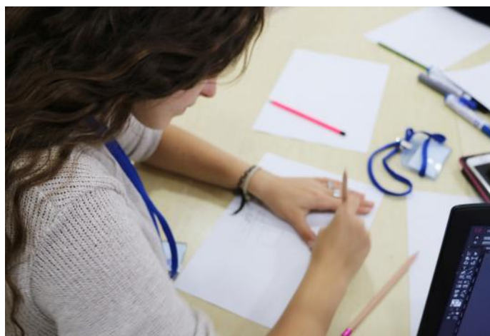
Duke vizatuar një shkollë të pastër

Qytetarë të denjë për shtetin tonë, jemi atëherë kur respektojmë njëri-tjetrin, kur mbajmë pastër ambientin, kur kujdesemi për njëri-tjetrin dhe kur solidarizohemi me të gjithë. Ne sot kuptuam se për të qenë qytetarë i denjë për popullin tonë duhet t'i respektojmë ligjet dhe njëri-tjetrin pa marrë parasysh fenë, racën dhe gjininë.