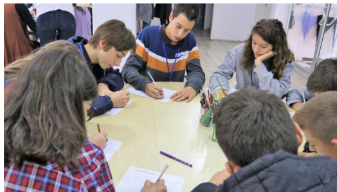
Edhe fëmijët mund të punojnë për zhvillimin e demokracisë