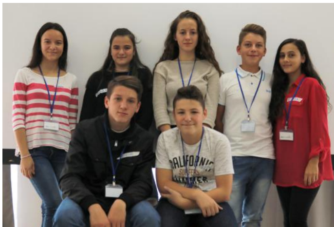
Fëmijët të cilët punuan artikullin