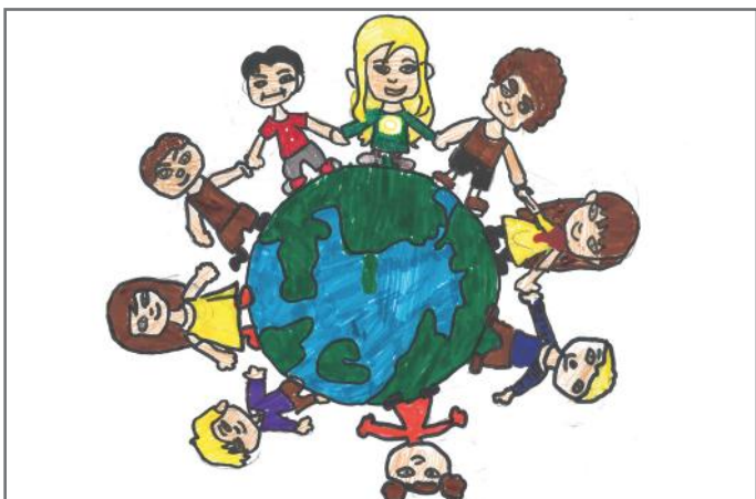
Të gjithë jemi të barabartë dhe të lumtur

nëntori, të cilat janë të njohura si Dita Ndërkombëtare dhe Dita Universale e Fëmijëve. Përpos të drejtave, ne kemi dhe përgjegjësi, të cilat janë: të shkojmë në shkollë, të mësojmë, të bëjmë detyra, të pastrojmë, të respektojmë të moshuarit dhe të gjithë personat e tjerë. Tani dëshirojmë të tregojmë një ngjarje shumë interesante. Disa nga shokët tanë ishin në autobus duke shkuar në shtëpi. Brenda në autobus hyri një i moshuar, por ai nuk kishte vend për t'u ulur. Ne si fëmijë të mirë dhe qytetarë të përgjegjshëm ia liruam vendin. Ai na falenderoi shumë dhe na tha: "Sa fëmijë të mirë jeni!., Ne u bëjmë thirrje të gjithë fëmijëve të sillen kështu sikur ne në të gjitha vendet publike.