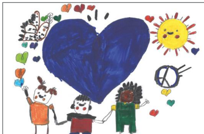
Fëmijët qëndrojnë të bashkuar