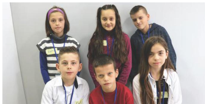
Demokratët e rinjë

të lumtur, sepse prindërit tanë nuk bëjnë dallime. Në rastet kur duhet të merren vendime të ndryshme familjare, prindërit tanë i marrin parasysh edhe kërkesat tona. Këtë ata e bëjnë, sepse janë të vetëdijshëm se në shtetin demokratik idetë e të gjithëve kanë peshë të madhe. Pra, falë demokracisë e cila është shfaqur në vitin 507 p.e.s. në Greqi, jeta e shumë qytetarëve ndryshoi për të mirë. Demokracia, ende nuk e ka arritur zhvillimin e plotë. Për këtë arsye, ne nuk do të ndalemi me kaq. Gjithmonë, do të kontribuojmë me forcat tona për zhvillimin e saj, sepse me të vërtetë e dijmë se çka do të thotë të jetosh në paqe. Ndryshimin nuk mund ta bëj vetëm një person. Atë duhet ta bëjmë të gjithë ne, me punë dhe me përkushtim. Ne jemi në proces të zhvillimit të demokracisë, prandaj japim fjalën se do të vazhdojmë kështu të veprojmë, derisa të arrijmë një nivel të kënaqshëm e ndoshta edhe më shumë. Kërkojmë edhe ndihmën tuaj për këtë aspekt.