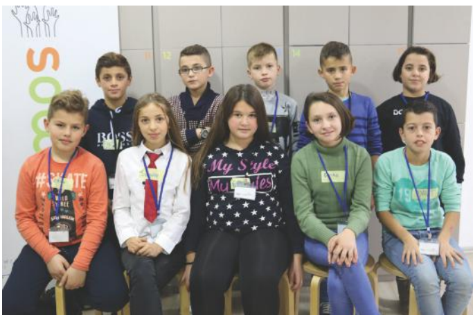
Fëmijët gazetarë të këtij artikulli