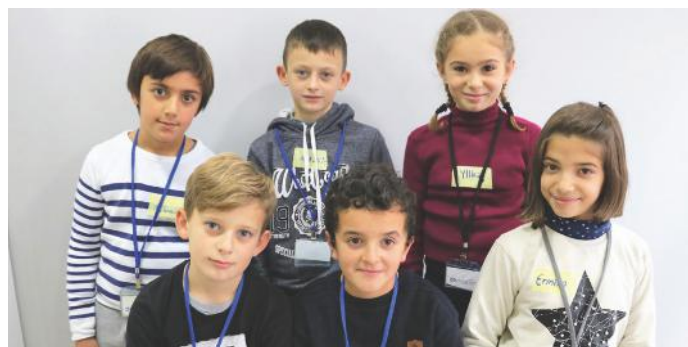
Qytetarët aktiv, ngrisin zërin e tyre për komunitetin

e madhe. Siç edhe e dimë, të gjithë duhet ta ndiejmë përgjegjësi zhvillimin e shtetit tonë. E shteti ynë, mund të zhvillohet vetëm nëse ne jemi qytetarë aktiv. Edhe ne si nxënës të klasës së V-të, jemi munduar çdo herë që me mundësitë që i kemi ti shërbejmë komunitetit tonë. Jemi duke e përdorur fjalën komunitet, për arsye se në secilin vend që ndodhemi, ne veçse bëhemi pjesë e atij vendi dhe duhet të kujdesemi për