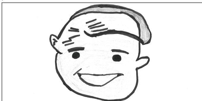
Këtu mund ta shihni fytyrën e ndritur të një qytetari aktiv

të. Pa dyshim, kjo vënie nga fakti se ne jemi qenie sociale ku duhet dhe kemi mundësi t'i ndihmojmë të tjerëve. P.sh. ne në shkollë, së bashku me të gjithë nxënësit, kemi marrë një iniciativë dhe i kemi mbledhur mbeturinat dhe kemi pastruar tërë oborrin e shkollës. Këtë e kemi bërë, pasi që e dimë se si ndikon ndotja e ambientit në shëndetin tonë dhe nuk duam që një veprim i papërgjegjshëm i dikujt të ndikojë një shoqëri të tërë. Po ashtu, kemi marrë shumë iniciativa të tjera pozitive, vetëm e vetëm që të kontribuojmë për shtetin. Kjo pra është qytetaria aktive, ku qëllimi parësor i saj është krijimi i një shoqërie të shëndoshë. Prandaj, iu ftojme të gjithëve të aktivizoheni dhe të bëni veprime të duhura. Sepse edhe zgjedhja juaj profesionale ndikon që të jeni aktiv. Nëse dikush bëhet mjek/e në të ardhmen, ai/a jo nuk do të kontribuojë vetëm vetes së tij/saj, por tërë komunitetit. Këtu pra, mund ta shihni se sa i rëndësishëm është kontributi i gjithsecilit.