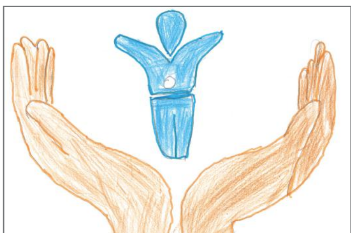
Kur sëmuremi, ne kemi të drejtë të shërohemi