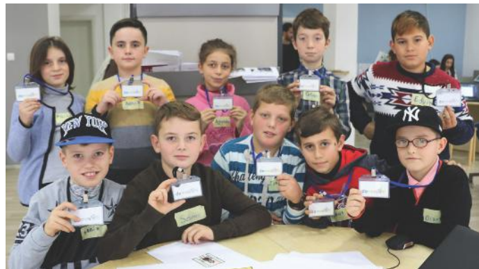
Ne jemi gazetarët e grupit „Bletat Punëtore“

Ne jemi shumë të lumtur, sepse edhe brenda grupit tonë, këtu në Punëtorinë për Demokraci „Demos-ti“, kemi pasur mundësinë të zgjedhim vetë se cilën punë ta kryejmë. Kjo dëshmoi se ne vërtet kemi frymë demokratike dhe kështu duhet të veproni edhe ju lexues të dashur. Vetëm duke bashkëpunuar ne mund ta forcojmë demokracinë.