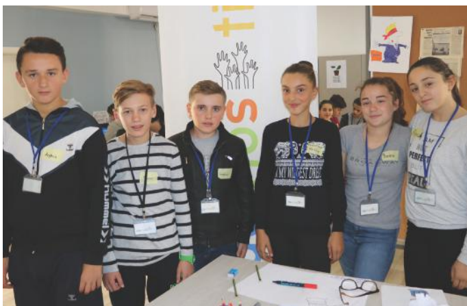
Ne sot ishim mysafir të projektit Demos-ti

e vetë e delegon tek deputetët. Është edhe Qeveria, ajo e cila ka rol të rëndësishëm në jetën tonë. Bile mund të themi afërsisht të njëjtë me Kuvendin. Po të mos ishte Qeveria, jeta jonë dukshëm do të ishte më ndryshe, sepse ligjet që propozohen nga ky institucion na lehtësojnë jetën tonë dhe na bëjnë më të lumtur. Por, nganjëherë jo të gjithë qytetarët i zbatojnë dhe i respektojnë ligjet. E për të gjithë ata që veprojnë në kundërshtim me ligjin, është Gjykata ajo që merret me ta. Në Kosovë, kemi Gjykatën Themelore, të Apelit dhe atë Supreme. Siç po e shihni, prania e këtyre institucioneve në jetën tonë, qenka shumë e rëndësishme dhe e nevojshme.