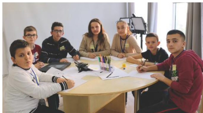
Gazetarët e demokracisë

kracisë që janë: paqja, toleranca, respekti, liria, etj., atëherë ne do të ndërtojmë një demokraci të qëndrueshme. Po, ç'është demokracia? Demokracia është dhurata më e bukur që kemi. Falë saj, ne qytetarët jemi pjesë e vendimmarrjes. Demokraci do të thotë udhëheqje e popullit. Andaj, të udhëheqim ashtu si na ka hije. Me dinjitet dhe me respekt për njëri-tjetrin.