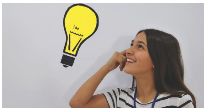
Unë kam ide të ndryshme për të qenë qytetare aktive

Secili qytetar mund të kontribuoj në shtetin e tij pavarësisht se në bazë të të cilit sistem jeton ai shtet.