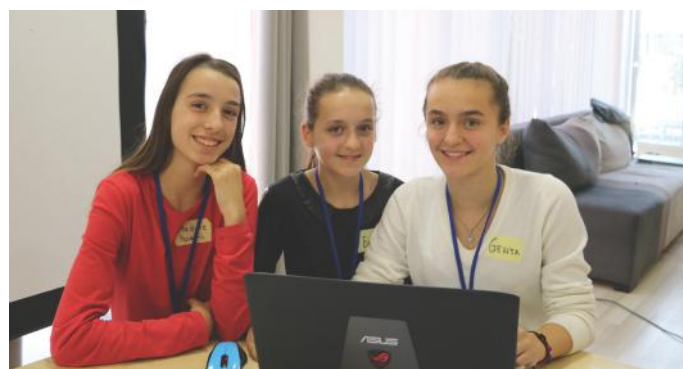
Kurse, këto janë shkrimtarët e këtij artikulli

Edhe pse jemi ende fëmijë, ndoshta neve na ka rënë rasti të jemi pjesë e votimeve. Mua më ka ndodhur një gjë e tillë: Unë me familjen time ishim në shtëpi duke qëndruar dhe vendosëm ta vizitojmë një familjarë tonin. Nuk e dinim se te kush të bënim vizitë. Babait pak çaste më vonë i erdhi në mendje një ide. Ai na tha të bënim një lloj zgjedhjesh. Ne duhej të votonim. Ashtu edhe bëmë. Pas votave, vendosëm të vizitonim hallën. Nga kjo kuptova në një farë mënyre se çfarë janë votimet.