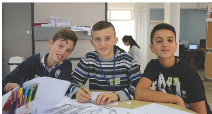
Këta janë piktorët e artikullit për Zgjedhjet

Këtë artikull vendosëm ta fillojmë duke treguar se çfarë janë zgjedhjet. Kur isha e vogël e dëgjoja nënën duke i thënë babait: „Sot është dita e zgjedhjeve!“ Por unë nuk e dija se ç’po thonin. Prandaj, e pyeta nënën: