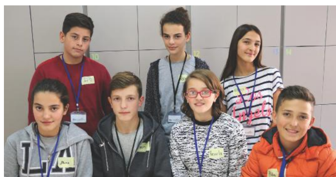
Jemi qytetarë aktiv, sepse e duam shtetin tonë

nxënës kemi pasur rastin të jemi qytetarë aktiv. Kjo ka rrjedhur nga fakti se në demokraci të gjithë mund të japim ide të ndryshme. Ideja që ne kemi dhënë ishte shumë efektive. Kjo ide, kishte të bënte me ndihmën që u kemi ofruar nxënësve të cilët nuk i kishin të mira kushtet ekonomike. Ne së bashku me nxënësit e tjerë, kemi përgatitur ushqime të llojllojshme dhe i kemi shitur ato. Të hollat që i kemi fituar, i kemi dërguar tek familjet e tyre dhe kështu kemi ndikuar që ato familje të ndahen të kënaqura me iniciativën tonë. Kemi pasur edhe shumë raste të tjera ku kemi qenë qytetarë aktiv dhe kemi vërejtur se të qenurit aktiv, nuk ndikon vetëm në nivel individual, por edhe në nivel grupor. Kjo i bie se përfshirja e qytetarëve në iniciativa të ndryshme me karakter pozitiv e përmirëson dukshëm jetën e tërë komunitetit dhe zhvillimin e demokracisë. Prandaj, qytetarë të dashur mos e lër pas kontributin që mund ta ofroni në shtetin tuaj. Idetë tuaja kanë vlerë.