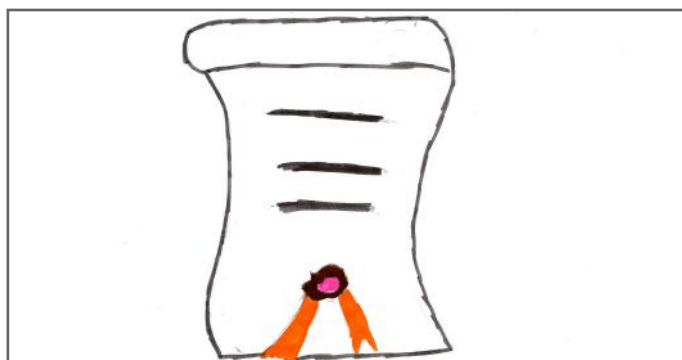
Ligjet duhet të zbatohen