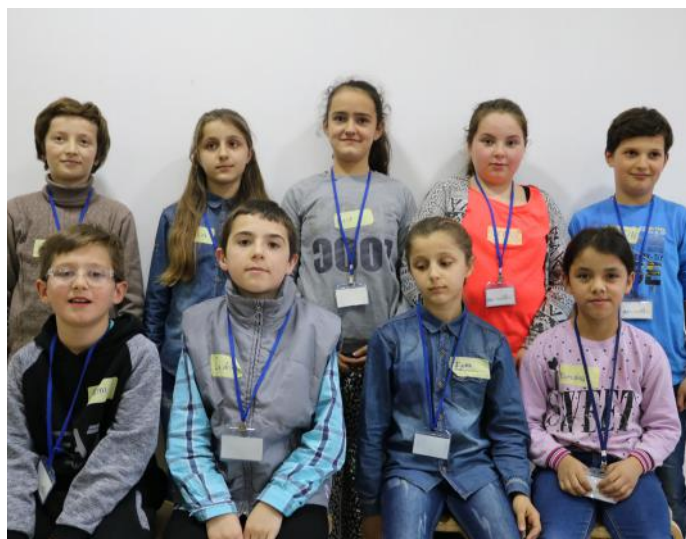
Autorët e artikullit

votuat ishte ndarja e roleve brenda grupit. Kur përfundoj votimi ndodhi diçka jo shumë e pritur nga ana jonë. Ishte numri i njëjtë i votave për dy nga anëtarët e grupit. Pastaj ajo çka menduam ishte që, nëse bindim edhe shokun tonë të votojë atëherë do të kemi një ndryshim. Votuat përsëri, por këtë herë dolëm më ndryshe, sepse një votë vendosi se cili nga anëtarët do të shkruajë e cili do të vizatojë. Pra, kjo luajti rol shumë të madh, sepse neve na bëri të kuptojmë më mirë rëndësinë e votave. Secili nga ne tani e dijmë se sa e rëndësishme është pjesëmarrja në zgjedhje.