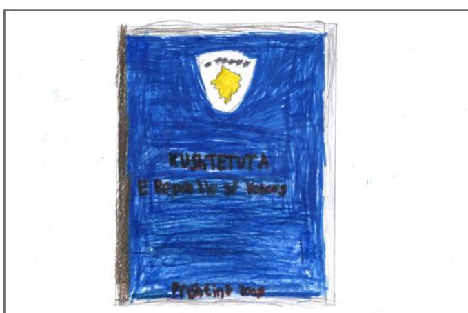
Punimi i Fatlindës për Kushtetutën e Kosovës