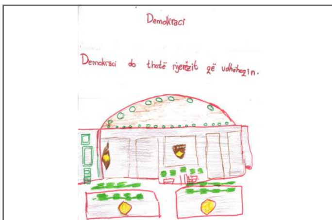
Kuvendi, vendi ku punojnë deputetët tanë