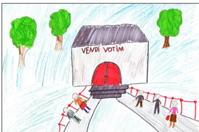
Të gjithë kemi të drejtën për të zgjedhur