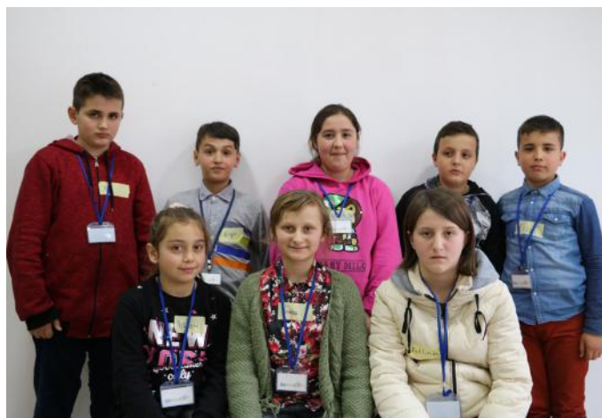
Grupi i demokratëve të rinjë

Çfarë dimë ne për demokracinë është se ajo është një formë e udhëheqjes së një populli. Fjala demokraci rrjedh nga gjuha greke, sepse aty ka lindur demokracia. Demokracia ka lindur në Athinë të Greqisë në vitin 507 para erës sonë. Janë dy forma të demokracisë. Ato janë: demokracia e drejtpërdrejtë dhe demokracia përfaqësuese. Në demokracinë e drejtpërdrejtë vendimet i merr i gjithë populli në mënyrë të drejtpërdrejtë. Kurse, në demokracinë përfaqësuese qytetarët e vendit tonë votojnë për deputetët e Kuvendit të Kosovës. Ne qytetarët e vegjël posa t'i mbushim 18 vjet premtojmë se do të dalim të votojmë për të udhëhequr vendin tonë të dashur në mënyrë sa më demokratike.