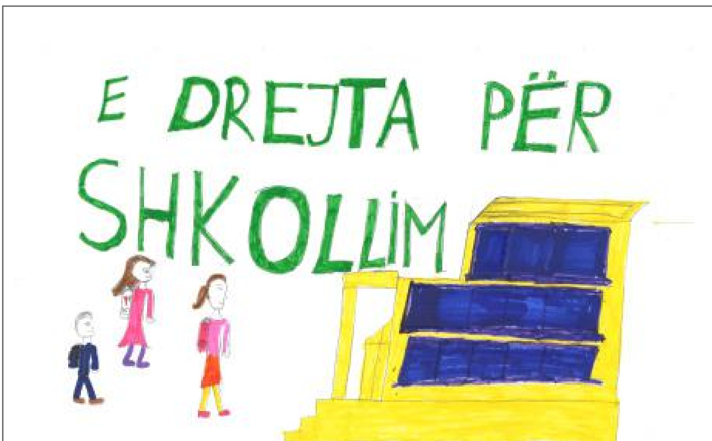
Në këtë vizatim kemi paraqitur disa shokë dhe shoqe tona duke shkuar në shkollë. Në vendin tonë, e drejta e shkollimit është një e drejtë e cila është e respektuar dhe e dashur nga çdo qytetar