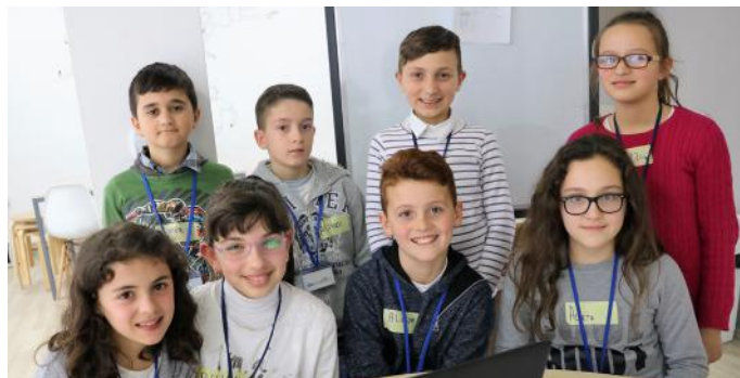
Grupi i deputetëve të ardhshëm

Grupi ynë ka një mesazh për ju që e lexuat këtë artikull, të respektojmë njëri-tjetrin dhe t'i zbatojmë ligjet duke qenë qytetarë të përgjegjshëm.