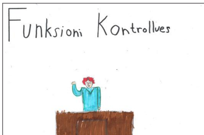
Këtu kemi paraqitur funksionin kontrollues