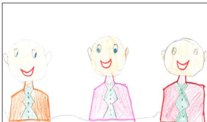
Disa nga përfaqësuesit e popullit