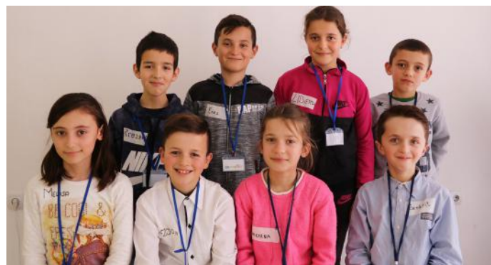
Autorët e artikullit të zgjedhjeve

Udhëheqësi nëse tregohet i pavëmendshëm dhe nuk i merr parasysh problemet e qytetarëve vështirë se do t'i fitoj zgjedhjet e ardhshme. Prandaj, ne, duhet të jemi të kujdesshëm për atë që do e votojmë.