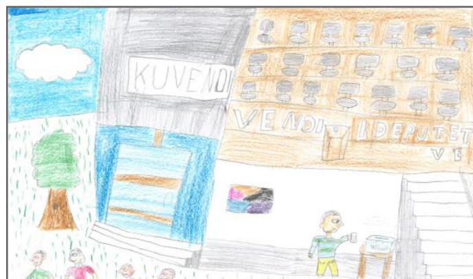
Këta përfaqësues punojnë në Kuvend