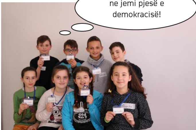
Grupi i gazetarëve të sotëm