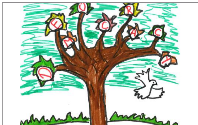
Pema e demokracisë