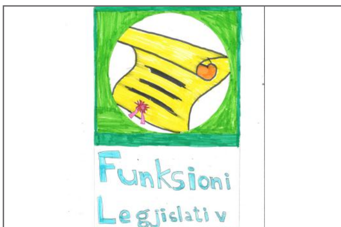
Ndërsa këtu kemi funksionin legjislativ të Kuvendit