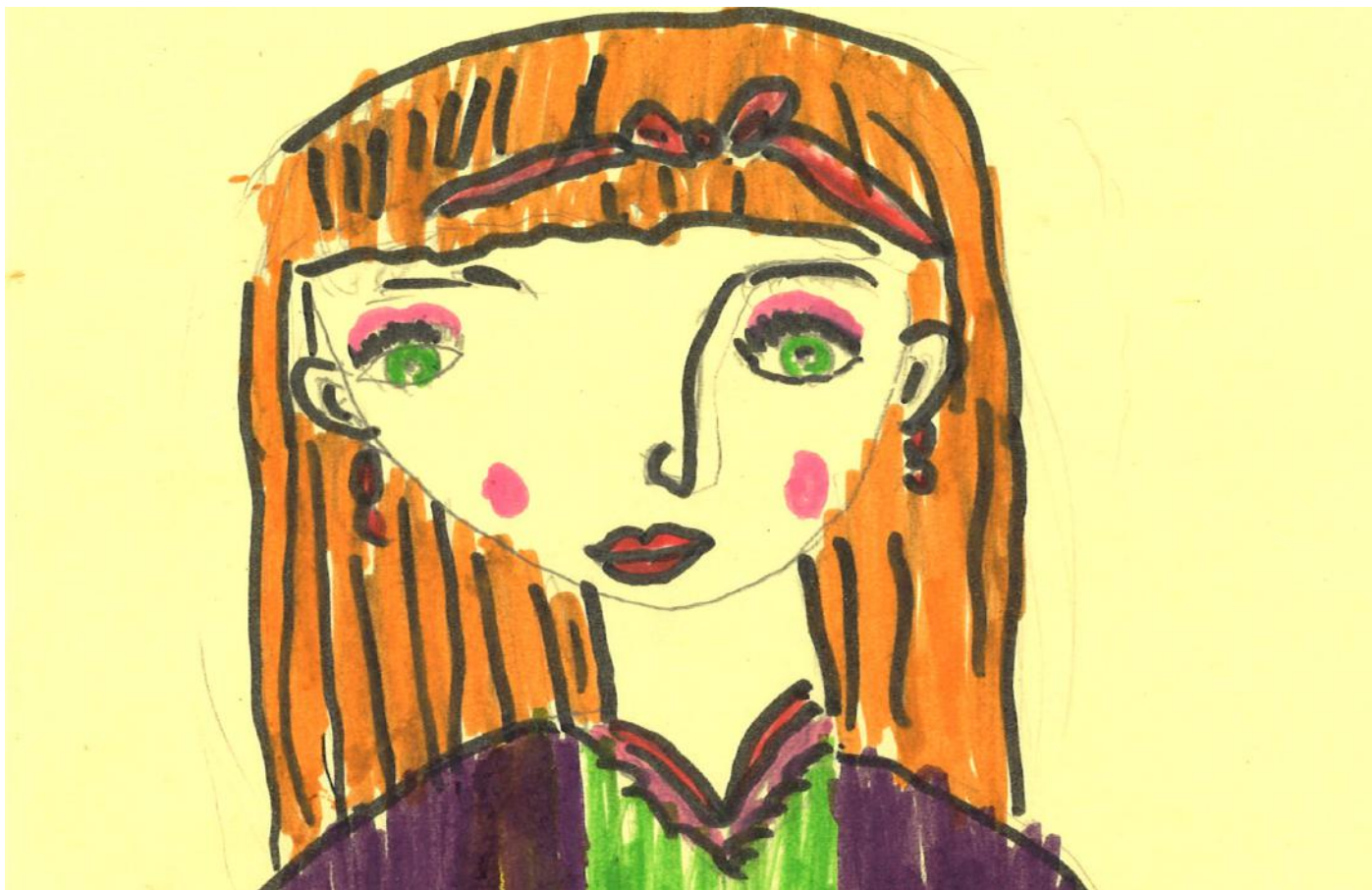
Në vendet demokratike e drejta për të qenë vetëvetja është e drejtë thelbësore