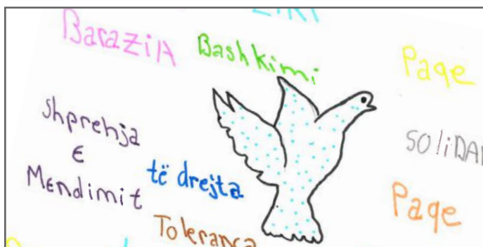
Është kënaqësi të jetosh me parimet e demokracisë

Pra, populli e ka fuqinë më të madhe për të vendosur për të ardhmen e tij, sepse voton dhe zgjedh deputetët që do ti përfaqësojnë interesat e tyre në „Shtëpinë e Popullit“ pra në Kuvend. Mesazhi ynë është: respekto veten tënde duke i respektuar parimet e demokracisë.