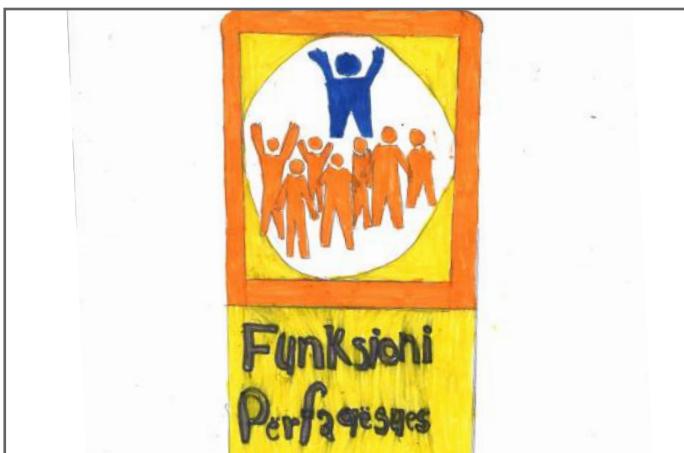
Ky është funksioni përfaqësues

Ne kemi mësuar se Kuvendi ka tri funksione kryesore. Ka funksion përfaqësues, sepse Kuvendi përfaqëson popullin, ka funksion legjislativ që do të thotë ligjvënës dhe që miraton ligje, si dhe ka funksion kontrollues që kontrollon Qeverinë. Kuvendi kontrollon Qeverinë me anë të pyetjeve ndaj Kryeministrit dhe ministrave. Këto pyetje shpesh ngjajnë me debatet tona në klasë. Më së shumti ne debatojmë për qeverisjen e klasës. Ne diskutojmë përse të tjerët sillen ndryshe kur mësuesja nuk është në klasë. Këto mosmarrëveshje i rregullojmë duke biseduar me njëri-tjetrin dhe duke rënë dakord me mendimet tona. Ne dëshirojmë të themi se puna e një gazetari është shumë e këndshme dhe e vlefshme për të forcuar demokracinë.