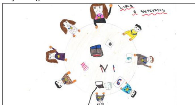
Këtu kemi paraqitur grupin tonë

Por çka janë zgjedhjet, pse janë të rëndësishme si dhe çfarë lloje të zgjedhjeve kemi ne në vendin tonë do të informoheni gjatë artikullit. Zgjedhjet e lira janë shprehje universale e një vendi demokratik, ku marrja e pushtetit realizohet me mjete paqësore. Kosova, është ndër ato vende që zhvillon zgjedhjet demokratike sepse qytetarët mbi moshën 18 vjeçare janë të lirë që të votojnë për atë që mendojnë se është më i miri dhe mund t'i përfaqësoj më së miri nevojat e tyre si qytetarë.