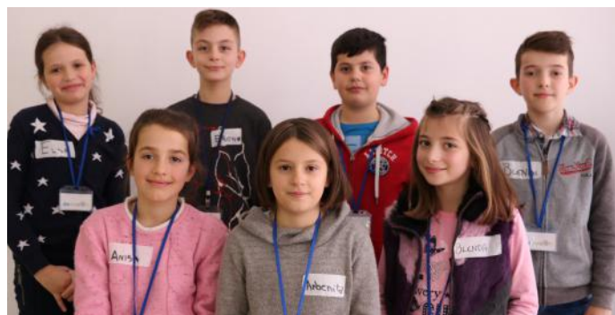
Gazetarët e demokracisë